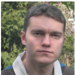
AUTEUR Nicolas Scelles TITRE Maître de conférences Université de Poitiers (EA 1722)

Dans un article précédent, nous avons développé le concept d'intensité compétitive en l'appliquant à la Coupe du monde de la FIFA 1 . L'article qui suit soulève la même question, mais cette fois pour les compétitions sans phase finale. Objectif : étudier l'intensité compétitive intra-championnat. Le terrain retenu est celui de la Ligue 1 française de football sur la période 1932-2011.