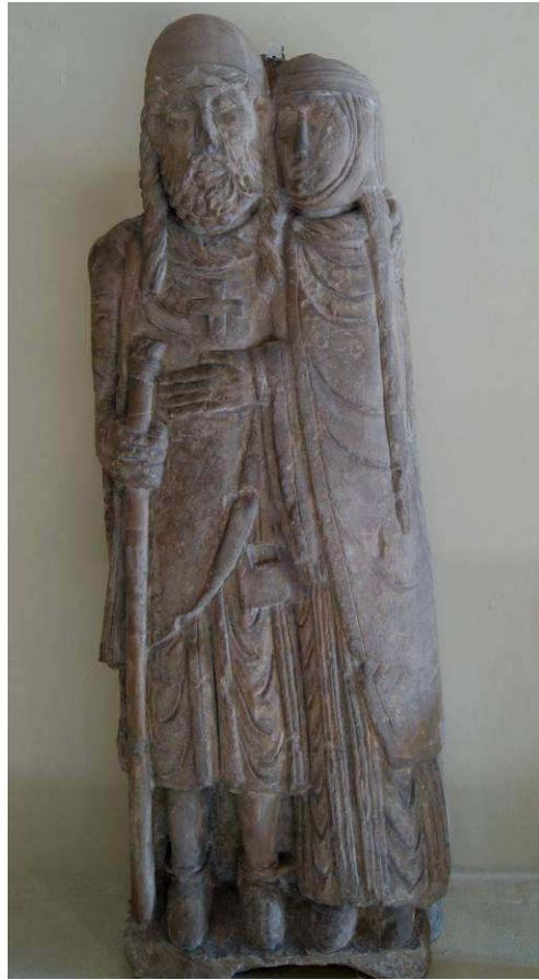
Image 8 : Le Retour du Croisé, fin du XII e siècle, Musée lorrain, Nancy