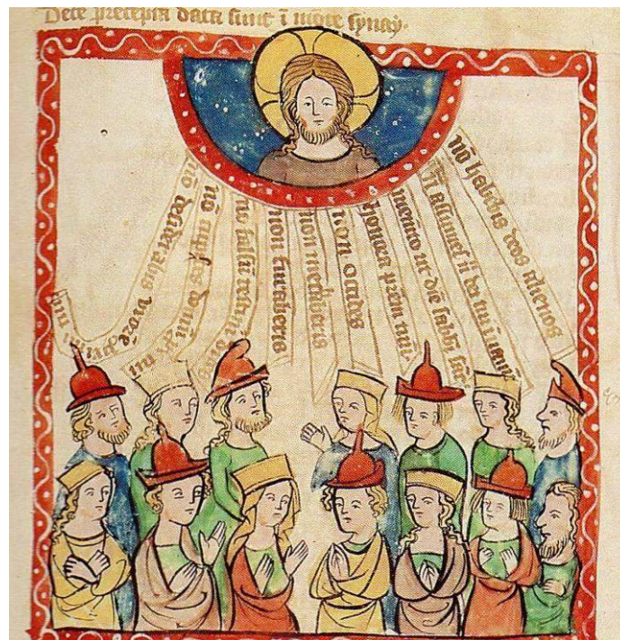
Image 1 : Les Juifs recevant les Dix Commandements, Heilsspiegel , vers 1360, Landesbibliothek Darmstadt, Ms 2505, chap. 32 (34)