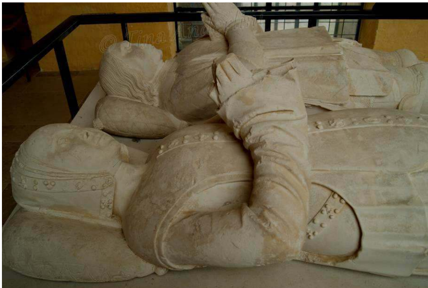
Image 4 : Gisant de Jeanne de Hangest, morte en 1514, Musée Antoine Vivenel, Cloître Saint-Corneille, Compiègne.