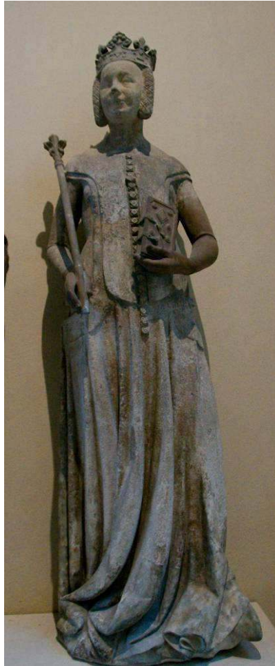
Image 3 : Jeanne de Bourbon, 1365–1380, Musée du Louvre, Paris