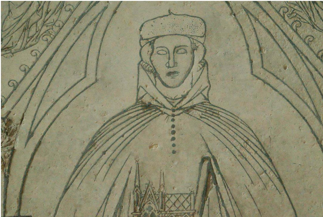
Image 5 : Plaque tombale de l'architecte Hugues Libergier, mort en 1263, provenant de l'église Saint-Nicaise, cathédrale de Reims