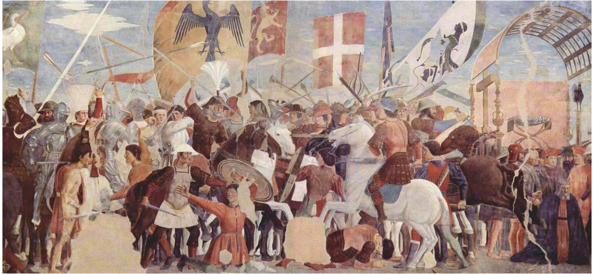
Image 10 : Piero della Francesca, Victoire d'Héraclius sur Chosroès , 1456–1462, basilique Saint-François, Arezzo