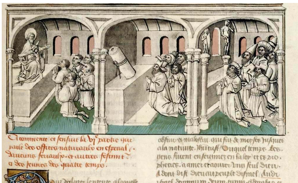
Image 2 : Rational des divins offices, début du XV e siècle, Bibliothèque municipale, Beaune, ms 21, f. 149