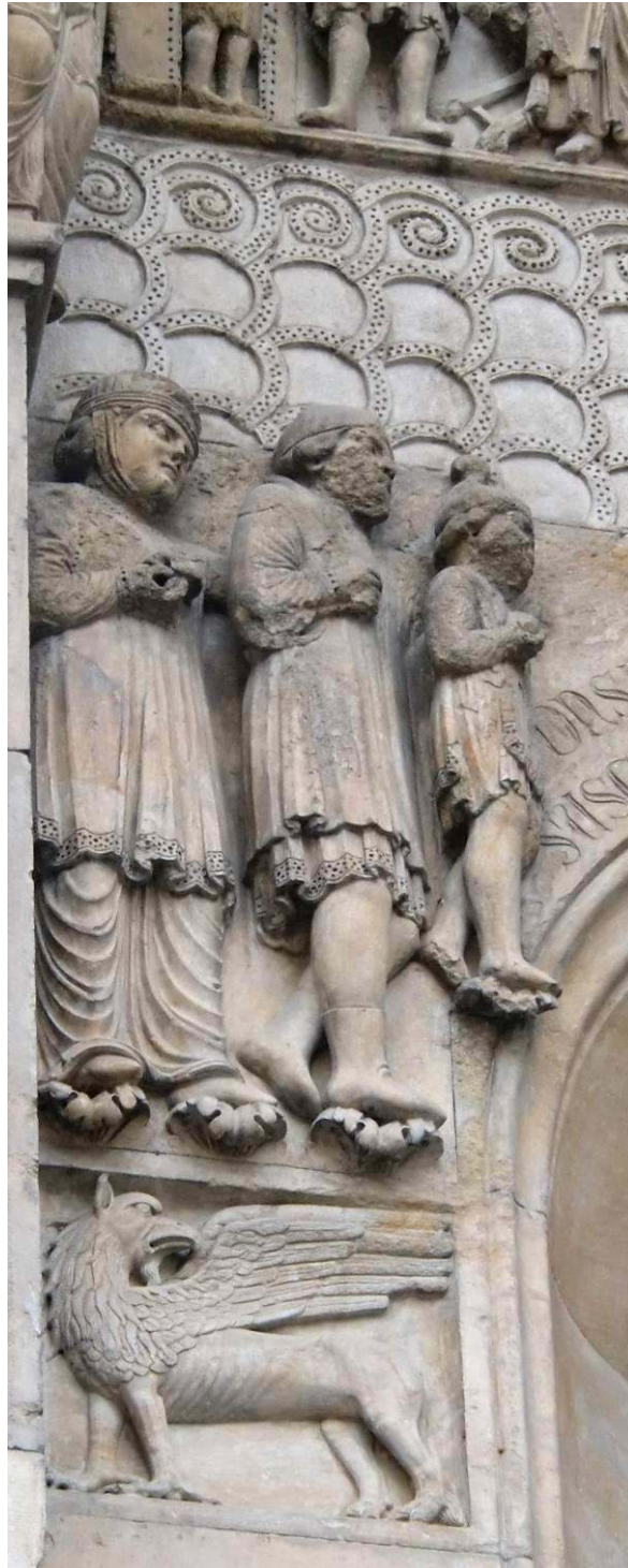
Image 7 : Atelier de Benedetto Antelami. Les Riches Pèlerins, autour de 1200, cathédrale, Fidenza.