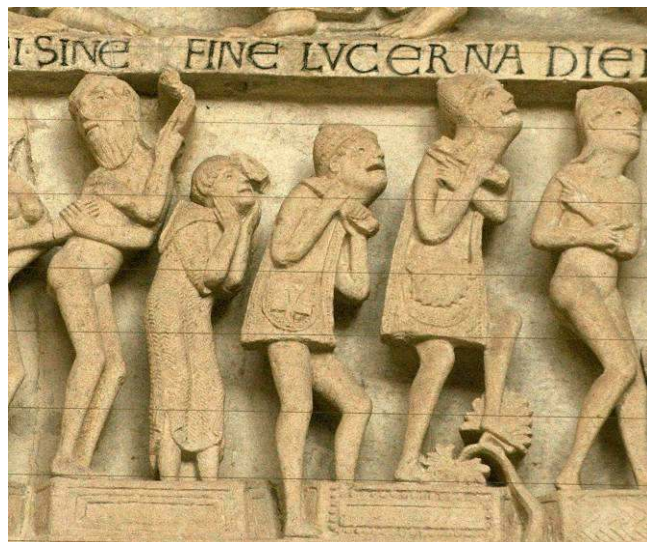
Image 9 : Gislebertus (?), vers 1130–1135, Pèlerins du Jugement Dernier, cathédrale d'Autun