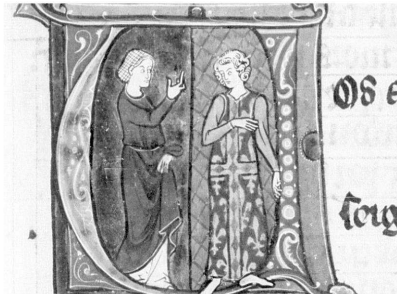
Image 11 : Le Roman de la Poire , Pitié ou Humilité, 3 e quart du XIII e siècle, Bibliothèque Nationale de France, MS Français 2186, f. 71