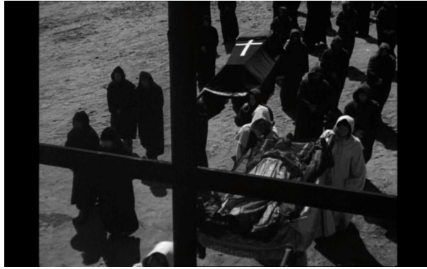
Le motif de la croix – Othello (1952)

Mais ce miroir n'est pas le miroir de mort « dans lequel le héros fini[rai]t par trouver la connaissance de soi solitaire » 20 . Car ce n'est que dans ses derniers mots, ceux qu'il prononce avant de retourner sa dague contre lui-même, qu'Othello parvient à faire une brève descente introspective – il est d'ailleurs filmé en plongée. Or, pour se définir, il recourt à une comparaison, comme s'il ne pouvait s'appréhender que dans un reflet, reflet qui affirme son altérité mais qui est aussi « image du passage de l'inconscience de soi à la conscience de soi » 21 : « one whose hand, / Like the base Indian, / threw a pearl away / Richer than all his tribe » (5.2.344-6).