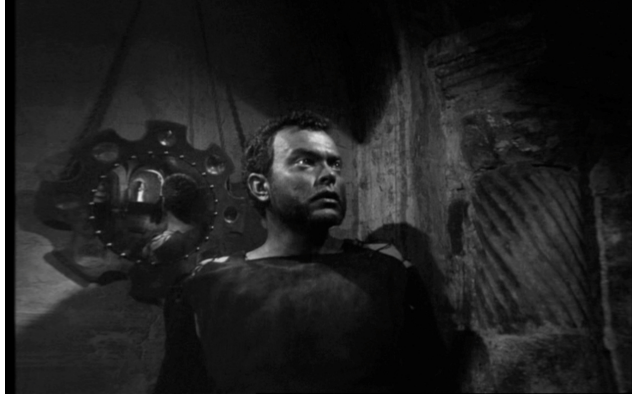
La profondeur de champ fallacieuse du miroir – Othello (1952)

En outre, ce miroir nous montre qu'Othello a intériorisé la vision calomnieuse de Iago. Desdémone, qui, inquiète, a suivi Othello, se reflète à son tour dans le miroir : elle y apparaît en arrière-plan, comme dans une profondeur de champ, avec Othello qui, au premier plan, la regarde.