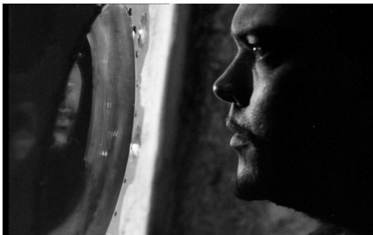
Un reflet tronqué – Othello (1952)

Le troisième miroir dans lequel Othello se regarde, après avoir congédié Iago et repoussé Desdémone, nous révèle une thématique liée à la folie, celle « de l'isolement et de la création d'un monde distordu » 17 . Il n'est plus nécessaire à Iago d'être là pour en orienter les reflets, car Othello a déjà intériorisé la distorsion des images que l'enseigne lui a renvoyées précédemment. Le Maure avance son visage au plus près de la surface réfléchissante, comme pour la forcer à lui livrer ses secrets d'optique : le miroir mural donne à voir un pan de visage presque méconnaissable, comme dans les anamorphoses catoptriques 18 , un reflet tronqué aux contours difficiles à distinguer.