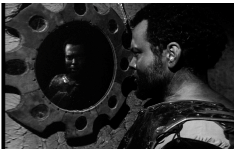
Le premier miroir – Othello (1952)

pas d'un manque de confiance en soi, d'« une absence de certitude de soi » 5 ? Les propos insidieux du scélérat semblent déclencher chez Othello, qui se tourne alors vers un premier miroir accroché au mur, un mouvement introspectif avec un questionnement du type : « Qui suis-je vraiment pour être ainsi trahi ? ». Tout se passe comme si Othello se mettait en quête d'un miroir de vérité qui le rassurerait sur sa propre identité, sur sa propre valeur, qui lui renverrait l'image du noble Maure de Venise, celui que Desdémone aime, admire et ne peut trahir. Les contours flous du reflet déjà à demi envahi par la noirceur de l'arrière-plan – emprise de l'âme noire de Iago sur Othello – annoncent la plongée subjective du personnage.