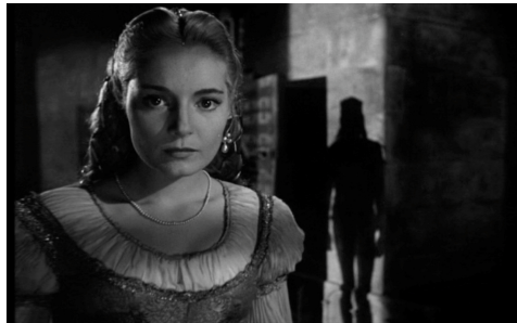
L'ombre de Iago – Othello (1952)

Ils ne figurent pas la réciprocité des consciences, comme dans The Arnolfini Portrait de van Eyck, mais l'élément intrusif, créant la discorde et accélérant la séparation – leur reflet déformant évoquant la réputation calomniée de Desdémone et le devenir monstrueux d'Othello. Ces miroirs capteurs de lumière en viennent paradoxalement à représenter l'ombre de Iago qui s'immisce entre les amants, la noirceur de son dessein.