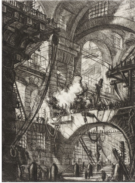
Une architecture de l'emprisonnement : Giovanni Battista Piranesi (1720-1778), « The smoking fire », Le Carceri d'Invenzione (planche VI, seconde version, 1761).