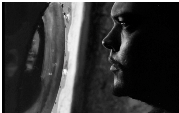
Les miroirs dans lesquels Othello s'observe – Othello (1952)

Mettant en regard les deux premières adaptations shakespeariennes de Welles à l'écran, Youssef Ishaghpour remarque :