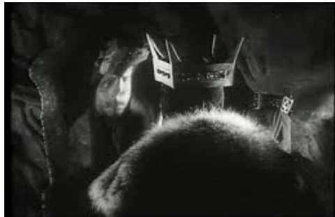
Le reflet déformé : Othello et Macbeth

Tout se passe comme si le miroir faisait surgir quelque chose de l'ordre de l'inquiétante étrangeté, le barbare dans le civilisé, le monstrueux dans l'humain, l'autre dans le même.