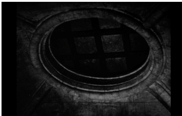
Plongée et contre plongée finales – Othello (1952)

Quand l'opercule du plafond se referme, signe de la clôture tragique, il évoque étrangement, par sa forme, l'arrondi des miroirs dans lesquels Othello semblait chercher une issue, par la position de la caméra en contre plongée, le couvercle d'un tombeau qui se referme.