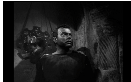
Deux visions fallacieuses servies par la profondeur de champ – Othello (1952)