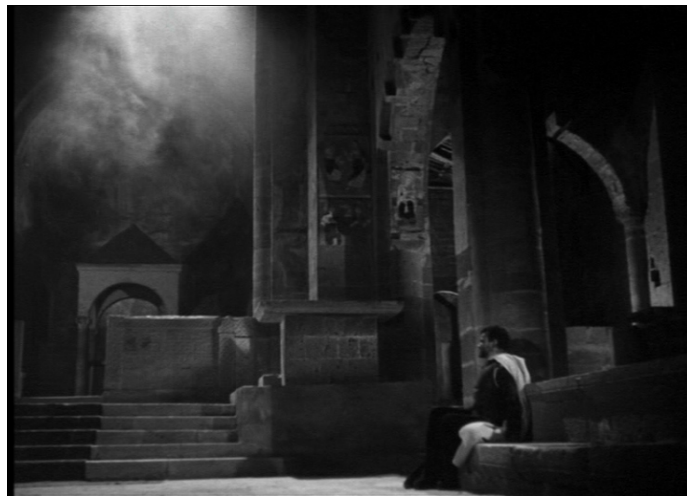
Une architecture de l'emprisonnement : Othello (1952)