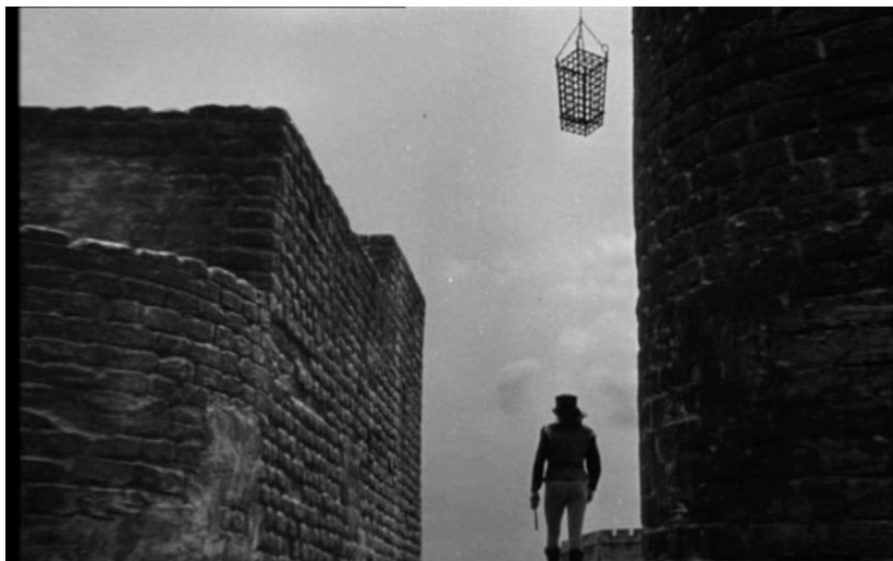
Motifs d'emprisonnement – Othello (1952)

Sous l'influence de Iago, le deuxième miroir fait donc surgir dans le champ de l'imaginaire des représentations dégradantes, celles d'une Desdémone dépravée et d'un Othello barbare. Puis, avec le brusque départ d'Othello, c'est-à-dire en l'absence de son regard se mirant, ce miroir, tel un miroir de vérité, nous livre le reflet de ce qui est à l'œuvre : la nasse qui, lentement mais sûrement, se referme. En cela, le miroir s'intègre parfaitement à l'architecture qui, à partir de cet instant, ne cesse de présenter des perspectives sans issues, qu'elles soient symboliquement barrées par des ombres de toutes sortes ou labyrinthiques. Pour Youssef Ishaghpour, c'est alors toute l'architecture du château qui en vient à évoquer les prisons imaginaires, Carceri d'Invenzione 16 , de Piranèse, comme une extériorisation de l'espace mental d'Othello.