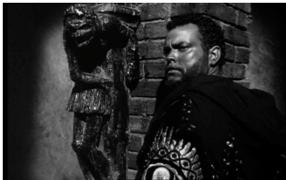
Othello et la figure de grotesque (1952)

Peut-être que ce n'est plus le général vénitien que le miroir reflète, mais le monstre de jalousie, ce « green-eyed monster, which doth mock / The meat it feeds on » (3.3.168-9), dont on peut voir une préfiguration, décalée et ironique, dans la figure de grotesque sculptée sur le chapiteau, en arrière-plan de la tête d'Othello.