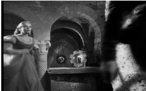
Miroirs en parallèle – Othello (1952)

Sous l'emprise d'une passion désormais destructrice, le Maure serre brusquement Desdémone contre son cœur avant de la quitter tout aussi brusquement. Au moment de la séparation, de façon très fugace, presque imperceptible, Welles fait entrer dans le champ de sa caméra les deux miroirs ronds cerclés d'échancrures, l'un accroché au mur du fond, l'autre posé sur une table.