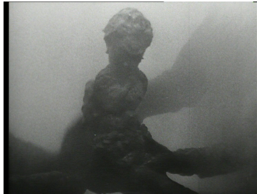
La manipulation à l'œuvre dans Othello (1952) et dans Macbeth (1948)

Dans l'adaptation d' Othello , ce miroir rond, que Youssef Ishaghpour appelle judicieusement « miroir sorcier » 14 , pourrait devenir une image du cercle infernal qui crée un univers clos,