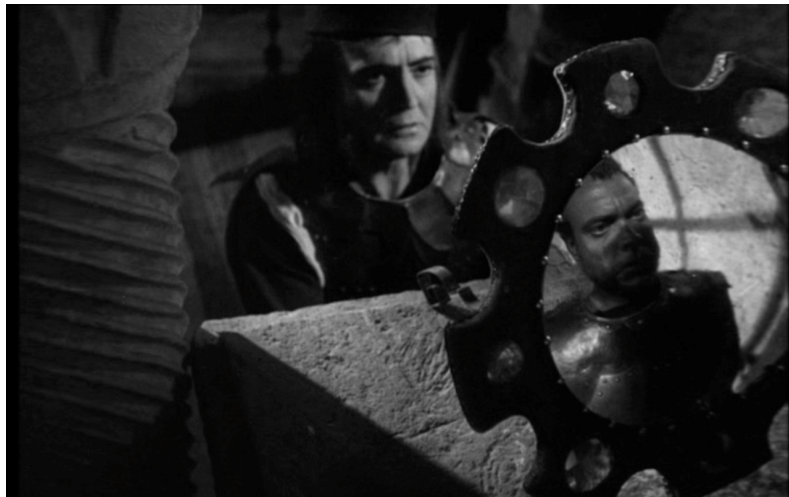
Iago derrière le miroir – Othello (1952)

Or, au risque de forcer légèrement le trait, la caméra de Welles nous montre Iago qui se positionne juste derrière le miroir, comme s'il le faisait sien pour le tendre lui-même à Othello et en maîtriser l'orientation et le reflet.