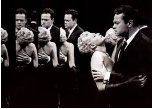
Reflets démultipliés dans Citizen Kane (1946) et The Lady from Shanghai (1947)

Il n'est donc pas étonnant que Welles introduise des miroirs dans l'adaptation qu'il fait, en 1952, de l' Othello de Shakespeare, jouant ainsi davantage sur « la fragmentation des espaces » 2 . Homme du vingtième siècle, il n'en garde pas moins à l'esprit l'infinie richesse symbolique – notamment dans l'ordre de la connaissance – que recélait le miroir à la Renaissance.