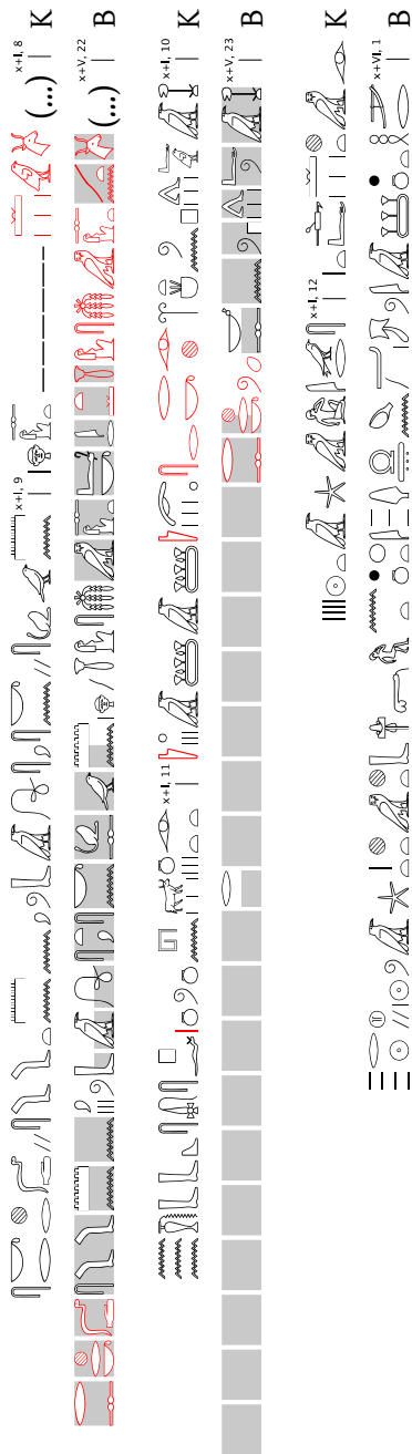
Fig. 5 Synopse du pBrooklyn 47.218.2 col. x + v, 22 - x + vi, 2 et du pKahun UC 32057, col. I, 8-12, cas n° 3