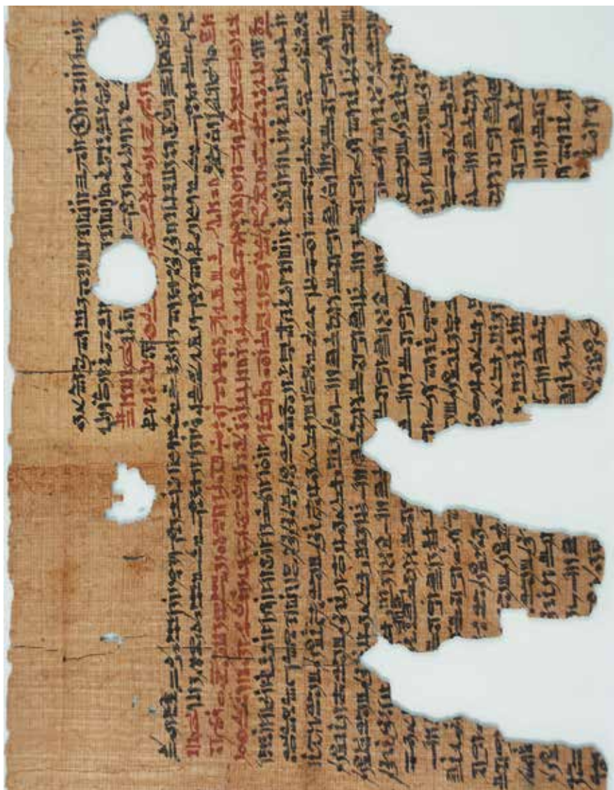
Fig. 1 Colonne x + iii du pBrooklyn 47.218.2