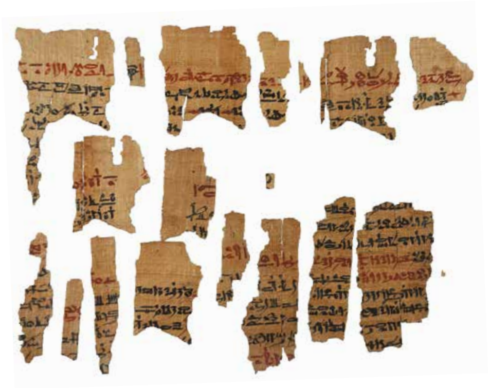
Fig. 2 Quelques nouveaux fragments du papyrus

aussi nettement du Mutter und Kind de Berlin 30 qui s'apparente plus à un papyrus magique qu'à un véritable traité médical.