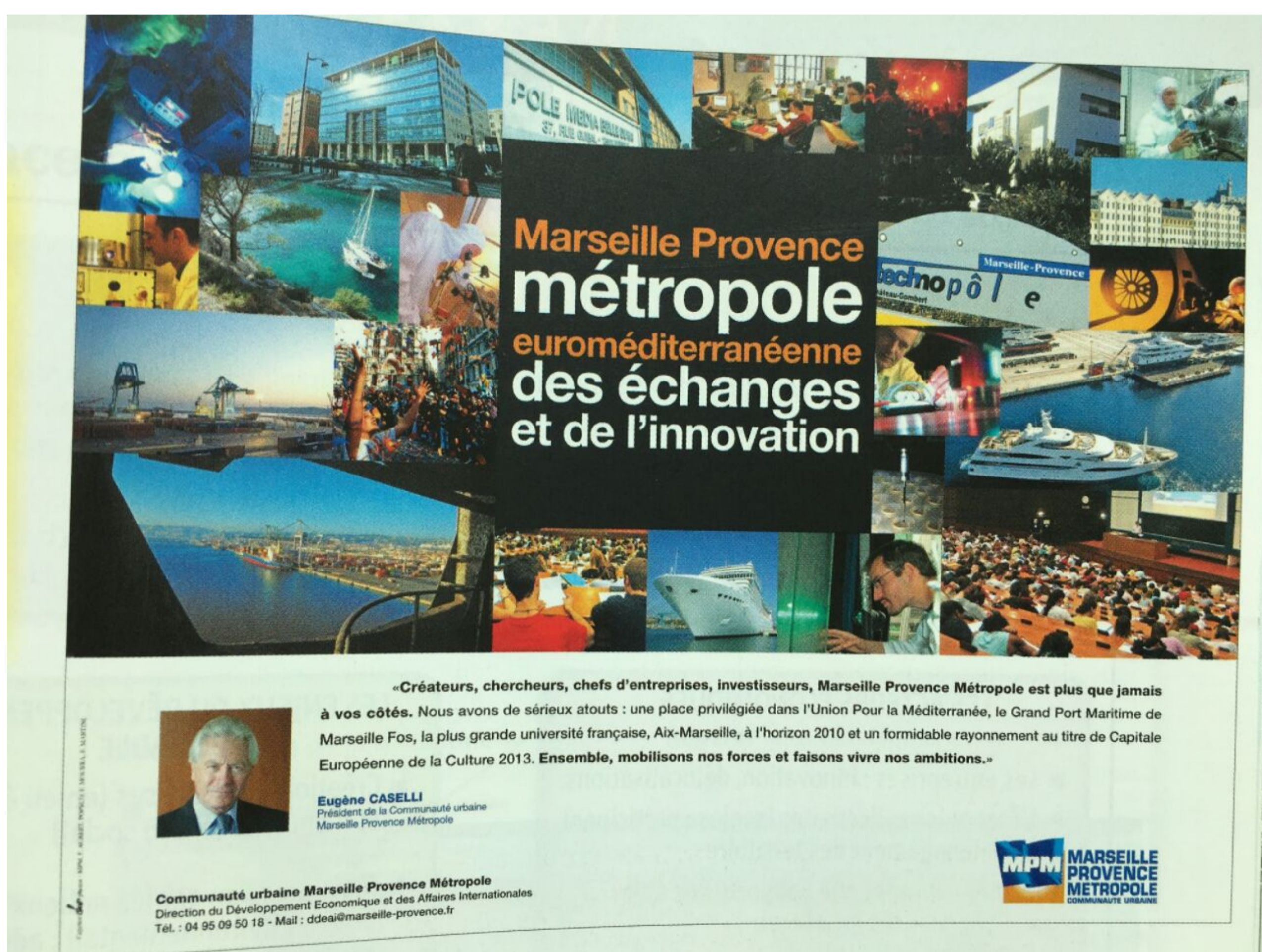
Figure 4 : Affiche de marketing territorial sur Marseille Métropole, (Ivernel M et Villemagne B. (dir.), Histoire-Géographie 3e, Hatier, 2012, p. 295