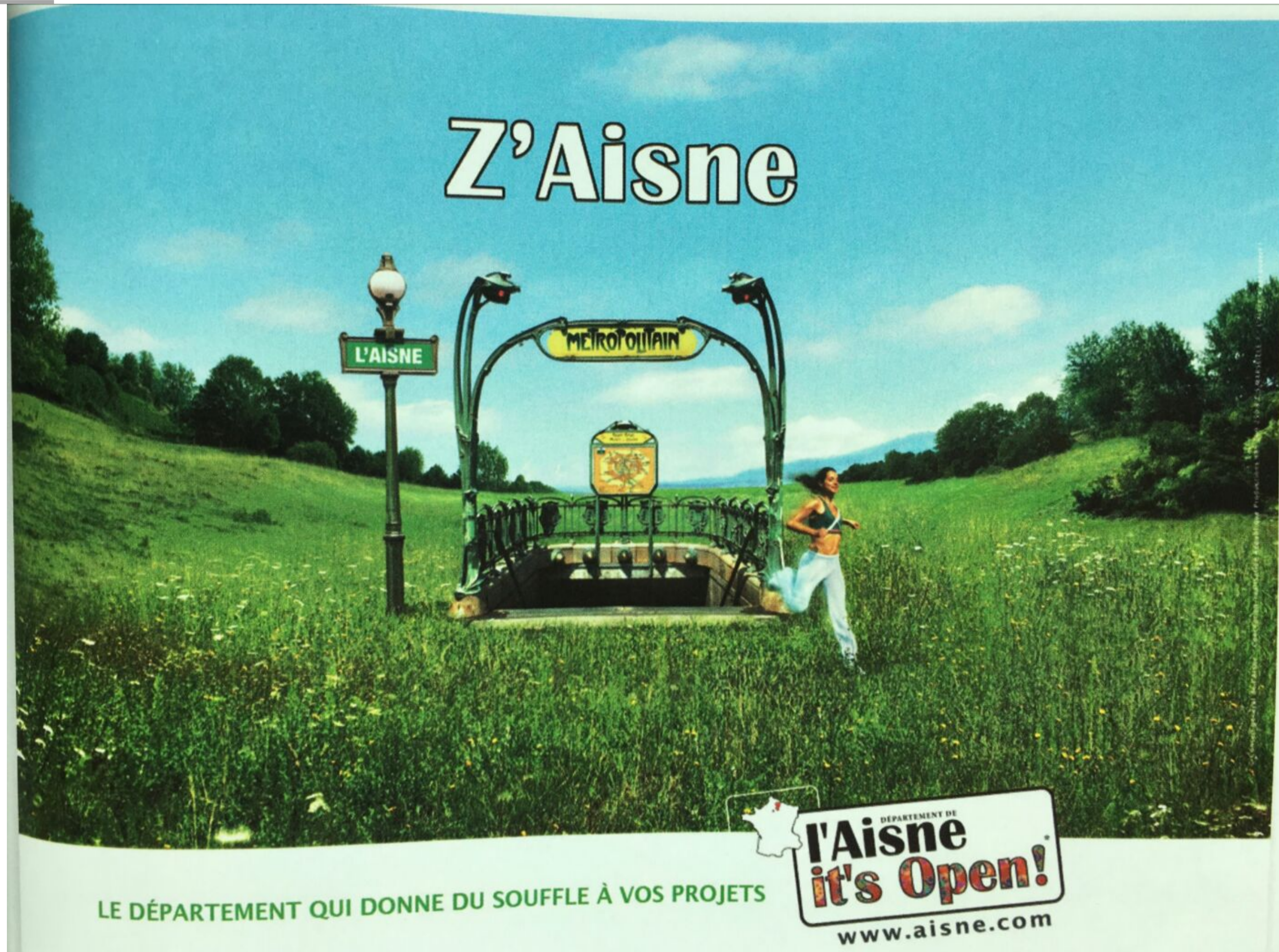
Figure 2 : Affiche de marketing territorial sur l'Aisne (Arias S. et Chaudron E. (dir.), Histoire-Géographie 3e, Belin, 2012, p.253