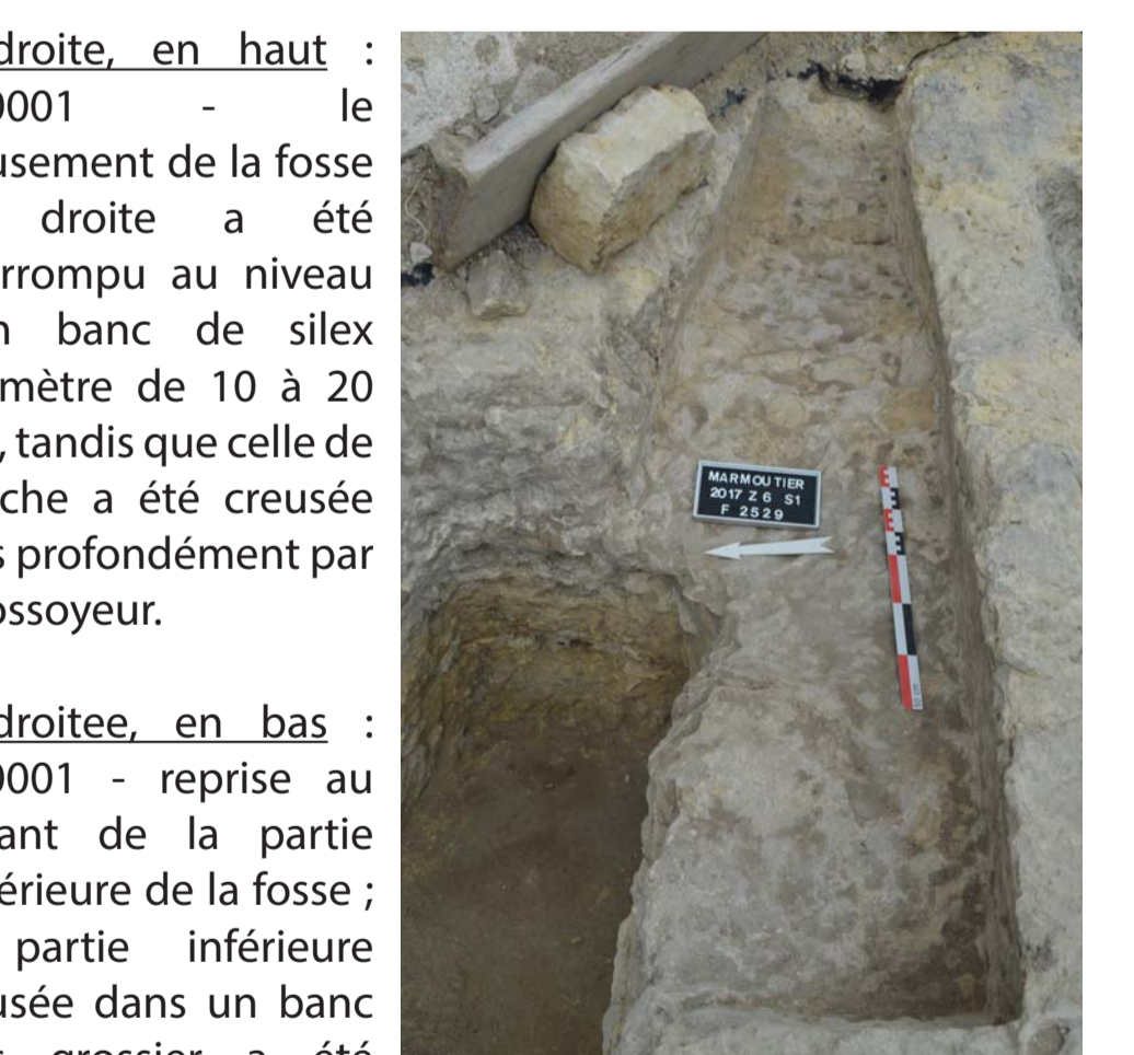
A droite, en haut : 37.0001 - le creusement de la fosse de droite a été interrompu au niveau d'un banc de silex (diamètre de 10 à 20 cm), tandis que celle de gauche a été creusée plus profondément par le fossoyeur.