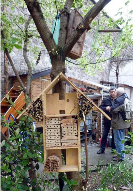
Figure 3 – Hôtel à insectes et nichoir dans un arbre des Petits Prés Verts (Aubervilliers)