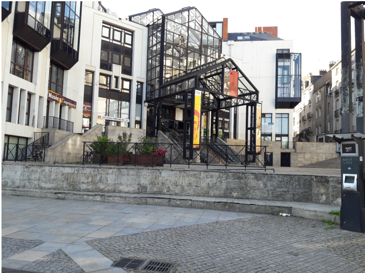
4. Le spot « Média » à Nantes (Robin Lesné, mars 2018)

La question de l'appropriation spatiale est prégnante en géographie et le parkour remet au centre de ce processus le corps qui, sentant et ressentant, constituant, s'engageant, et donnant sens à l'espace, habite le monde (Duhamel, 2014). La spécificité de cette pratique se situe dans la transgression qu'elle opère pour s'approprier l'espace. Ainsi et à partir des travaux de Chihsin Chiu (2009), il est possible de considérer que le parkour participe à la production d'un espace représenté qui « est d'abord matériellement produit par les architectes et paysagistes puis socialement reproduit par les personnes qui s'investissent dans les usages de ce lieu » ( ibidem : 33) 1 . C'est par le corps que le traceur produit l'espace dans une interrelation avec ce dernier, dépassant les usages physiques préconçus par l'aménagement. Le parkour n'évolue donc pas dans l'espace représentationnel conçu pour un usage spécifique et qui, selon l'auteur, n'est pas remis en question.