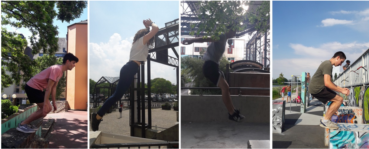
Couverture : Décomposition du saut de précision de Rennes à Nantes (Robin Lesné, mai 2018)

Pour citer cet article : Lesné R., 2019, « Quand le déplacement devient une fin en soi. La pratique du parkour, une mobilité qui fait bouger l'urbanité », Urbanités , #11 / Bouger en ville, en ligne .