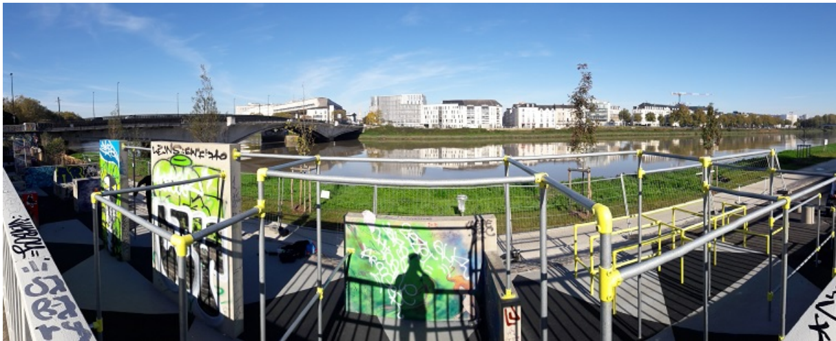
5. L'espace dédié du parkour-park, quai Doumergue à Nantes (Robin Lesné, novembre 2017)