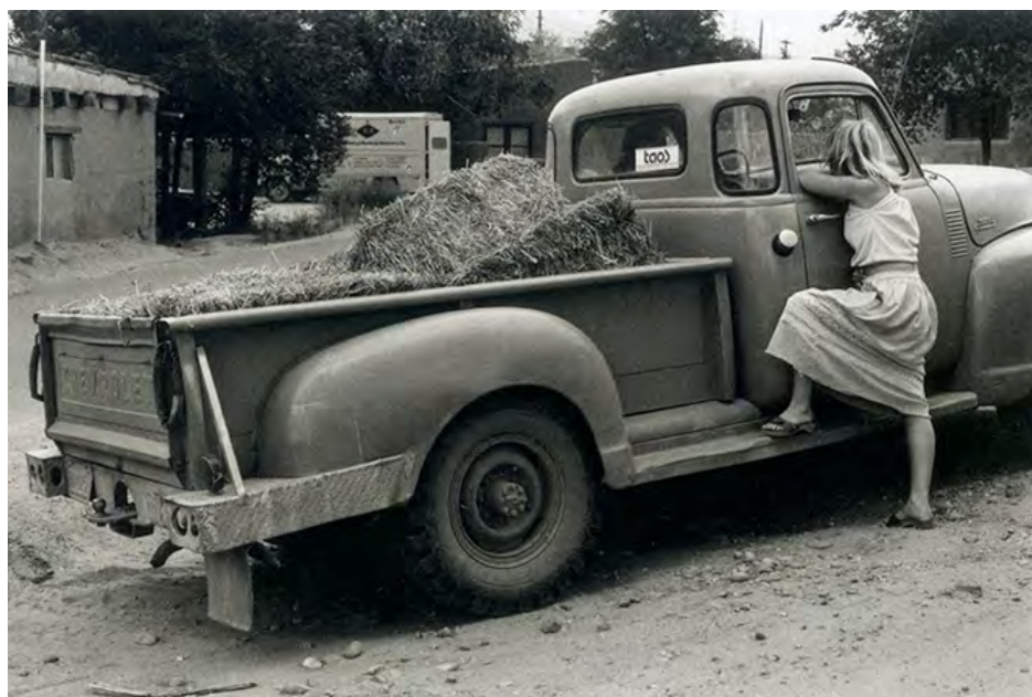
► Bernard Plossu, « Taos Scene », NMR , 25 © Bernard Plossu, avec l'aimable autorisation du photographe.

saisir en pied, la distance moyenne étant plutôt de l'ordre d'une dizaine de mètres [10]. Le 50 mm supprime le plan le plus proche de l'opérateur, le forçant à un tri. Optiquement, il est moins une focale « normale » qu'une focale qui rapproche un tout petit peu du sujet tout en maintenant le photographe un peu éloigné quand même [11]. À cette distance se pose plus nettement la question de l'identité que ne le ferait l'invasion de l'espace privé par le grand-angle ou au contraire la pénétration à distance d'un espace intime par le regard « voyeur » du téléobjectif. Ainsi Plossu dans ses images s'impose-t-il une distance au sujet que j'appellerai « intermédiaire » pour paraphraser le titre d'un de ses livres [12]. Pour lui, le couple 24 x 36 / 50 mm n'est pas celui qui permet, dans la tradition d'un Robert Frank ou d'un Henri Cartier-Bresson, d'être au contact d'un flux vital, mais au contraire qui distancie, comme l'illustre parfaitement l'une de ses plus célèbres images prise à Taos. Le photographe peut, derrière le 50 mm, se tenir à cette distance où il n'est ni celui qui s'immisce dans un moment relativement privé, ni celui qui reste le témoin distant d'une scène publique. Juste ici et maintenant, entre les deux, ou les deux à la fois.