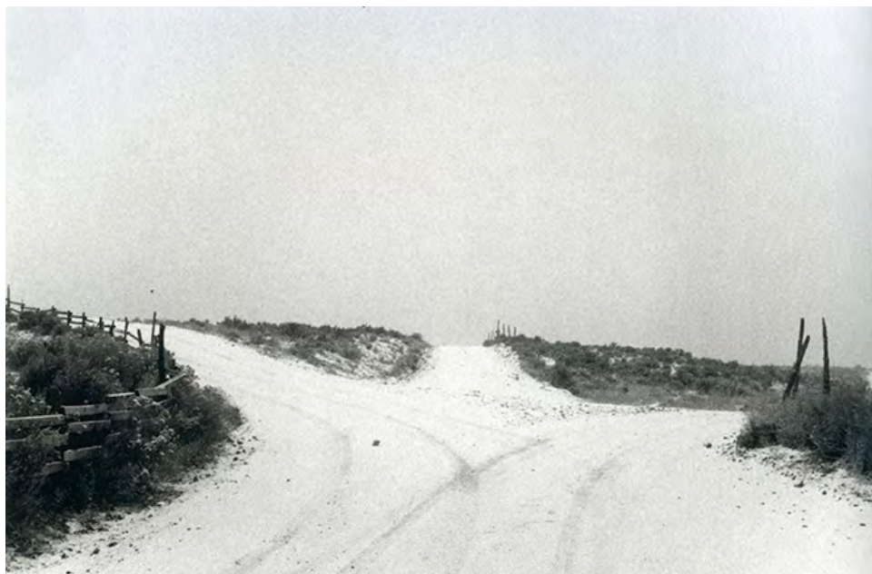
› Bernard Plossu, « State Road 338 south of Animas, heading toward Mexico », NMR , 92 © Bernard Plossu, avec l'aimable autorisation du photographe.