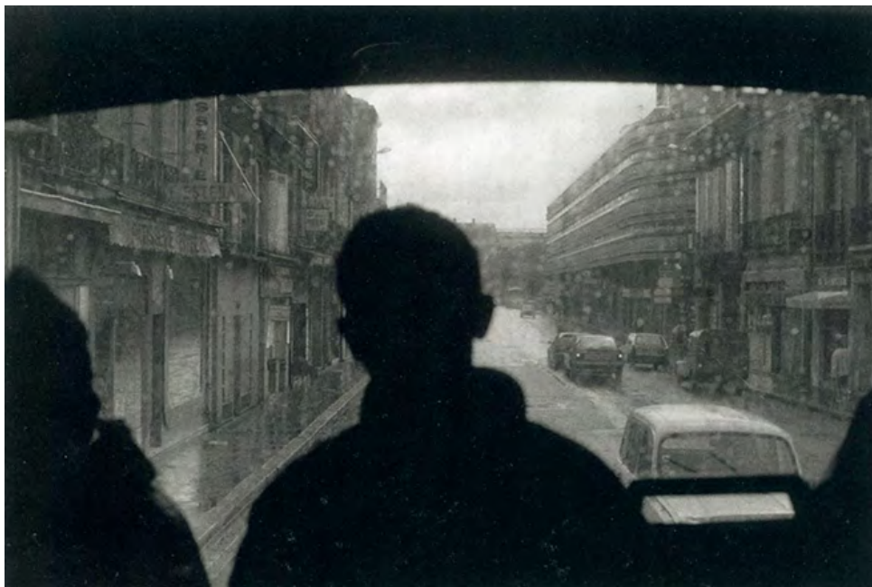
► Bernard Plossu, « Bordeaux, France, 1994 » © Bernard Plossu, avec l'aimable autorisation du photographe.

C'est pourquoi la route prend une si grande place dans son travail, comme dans celle de nombreux écrivains et photographes américains. Mais, contrairement à une large part de la photographie américaine contemporaine, Plossu ne s'intéresse pas au constat mais se saisit de la route comme d'une question. Être anthropologue, n'est-ce pas faire de la description elle-même une question [27] ? Des routes bien sûr, mais aussi des échelles, des maisons, des arbres, des ouvertures qui ne sont pas de simples artefacts signalant la présence humaine, des informations, mais une matérialisation du rapport anthropologique lui-même.