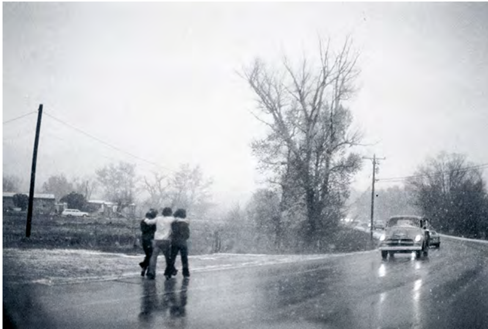
› Bernard Plossu, « Winter in Taos », NMR , 48