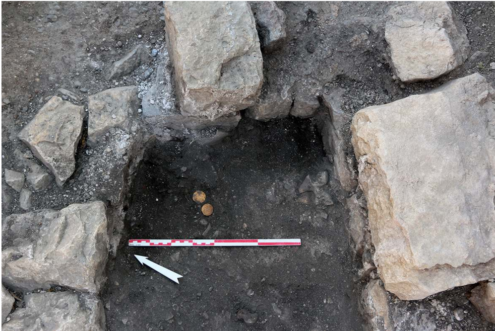
Fig. 9 – Découverte des monnaies byzantines dans la tombe 6.168.