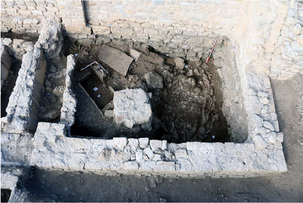
Fig. 3 – Secteur V, travée sud du vestibule roman : tombe en coffre protohistorique 5.285 sous la fondation 5.191 de la cuve baptismale médiévale présumée.