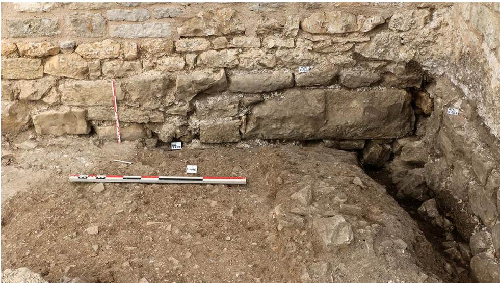
Fig. 4 – Secteur V, détail du remploi de grand appareil antique dans la fondation du mur est du vestibule roman.