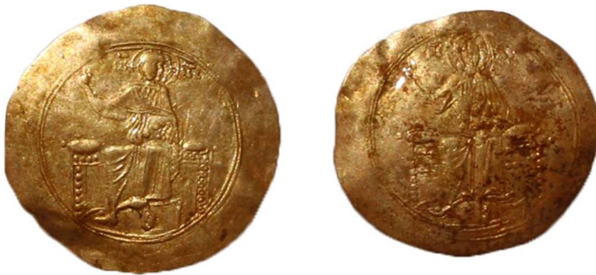
Fig. 10 – Détail des monnaies byzantines : à droite, DO IV, 1 ; à gauche, DO IV, 2.