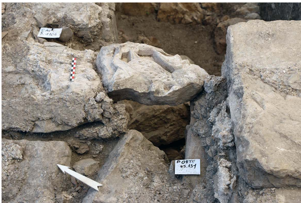
Fig. 6 – Secteur V, détail du remploi d'un fragment de sculpture romane dans la tombe 5.170 du vestibule.