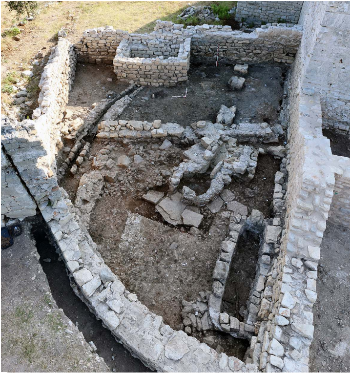
Fig. 8 – vue générale du secteur VI à l'issue de la fouille en juillet 2017.