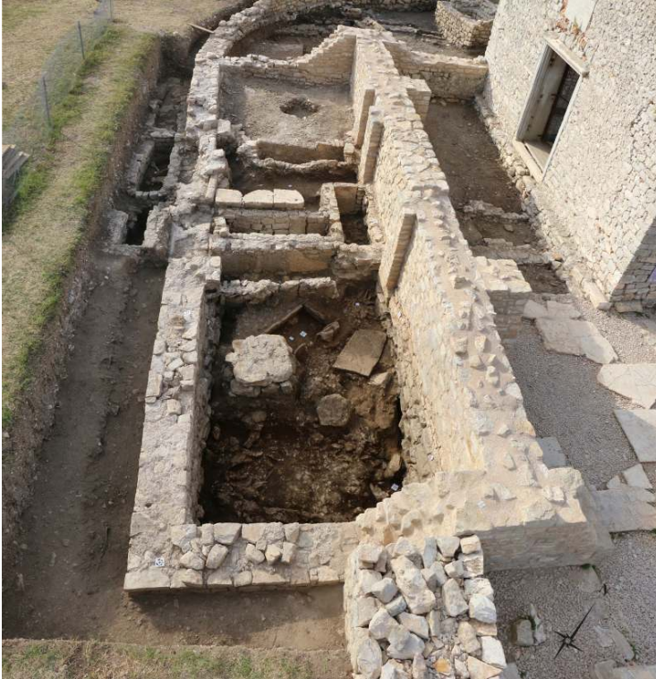
Fig. 2 – Vue générale du vestibule roman (secteur V) à l'issue de la fouille en juillet 2017 ; le mur de façade interne a été partiellement remonté à l'automne 2016 à l'issue de la première campagne de fouille.