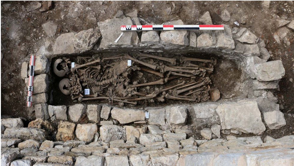
Fig. 11 – Secteur VI, tombe 6.168 en cours de fouille.