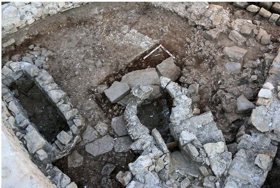
Fig. 13 – Secteur VI, détail de la structure hydraulique (?) à double chambre adossée à la forge de l'Antiquité tardive/haut médiévale.

manifeste par la présence d'une canalisation (6.134) qui traverse la forge présumée, mais sans que la fouille n'ait pu en déterminer l'origine et l'aboutissement.