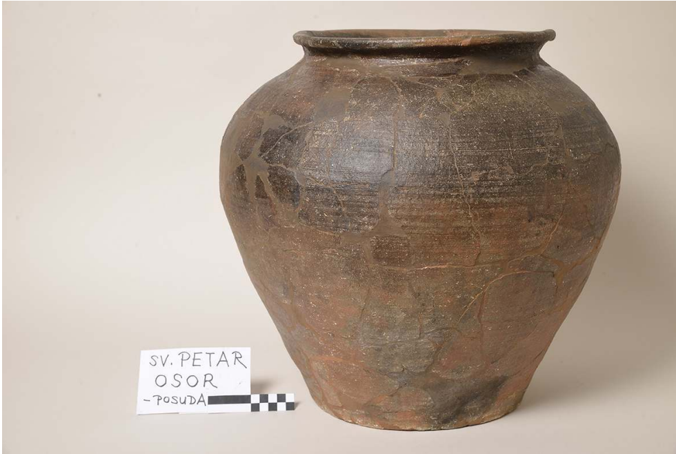
Cl. Maša Vuković Biruš, Hrvatski restauratorski zavod (HRZ), Zagreb.