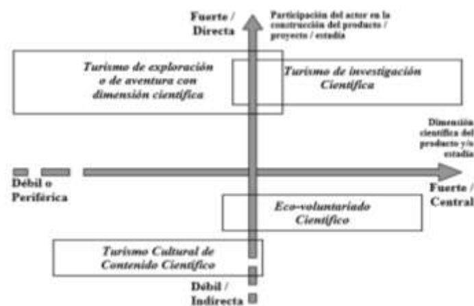
Figura 1. Planteamiento de las formas del turismo científico

Según Bourlon y Mao (2011), existen cuatro formas 7 que muestran cómo se moviliza la dimensión científica en el sector del turismo a través de dos ejes fundamentales, que por un lado, permite la integración del actor en la construcción del producto; y por el otro, la dimensión científica que da lugar a la concepción o desarrollo de una estadia (Figura 1).