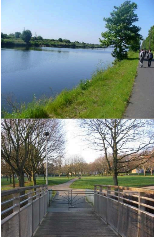
Figure 6. Parcours iconographiques comparés à Hérouville Saint-Clair (la « nature »)