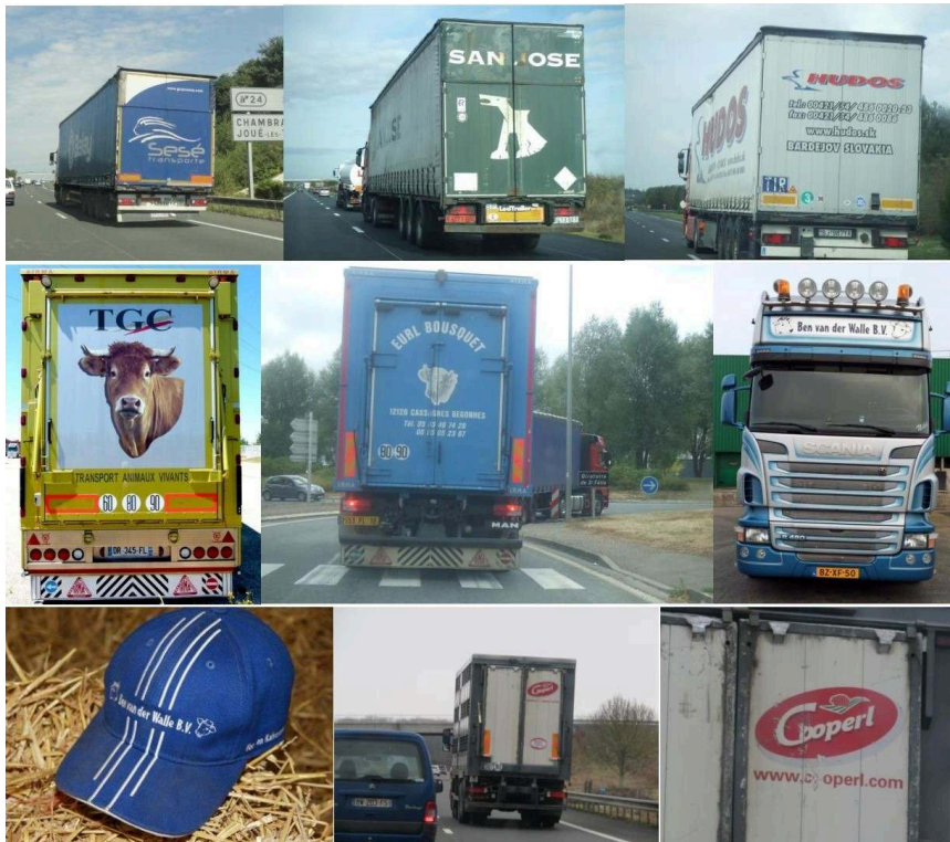
Figure 7. Paysages en mouvement : iconographies animales sur camions

Figures a, b, c : Figures d'un bestiaire (le lion, l'ours, l'aigle).