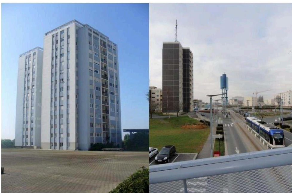
Gauche : Les tours jumelles (lycéens). Droite : Les tours noires (étudiants).