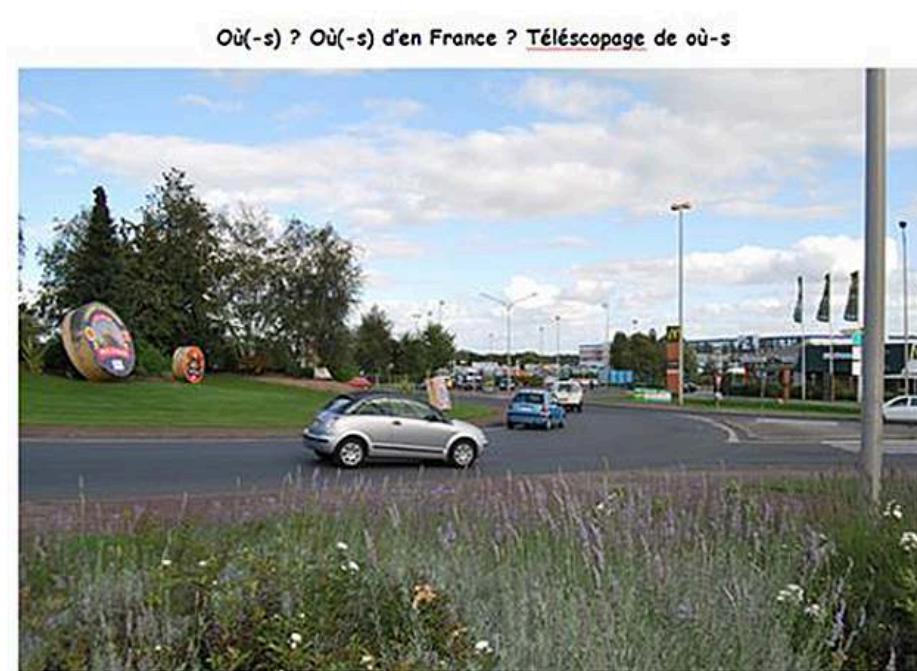
Figure 2. Support d'activité élèves