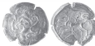
b/ Statère de la série "au cavalier armé", attribuée aux Osismes Titre : 17,3 %

1. Exemple de statères de titre différent (éch. 1 : 1). a/ Statère de la série "au trident", Pons/St-Eanne : ex. n° M1 983.1 découvert à Pons (Charente-Maritime), musée de Saintes (cliché IRAMAT-CEB). b/ Statère de la série "au cavalier armé" : ex. n° CA1 N2 provenant du dépôt de Laniscat (Côtes-d'Armor), SRA Bretagne (cliché IRAMAT-CEB). Analyses LA-ICP-MS, IRAMAT-CEB.