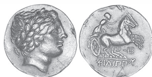
a/ Imitation du statère aux types de Philippe II de Macédoine, série "au trident", Pons/St-Eanne Titre : 98,8 %

Parmi les méthodes d'analyses de surface, l'EDXRF reste celle qui est actuellement la plus couramment employée en raison de son accessibilité, de son coût relativement faible et de sa rapidité d'exécution. L'épaisseur analysée est comprise entre 30 et 50 micromètres mais c'est généralement au sein de cette couche