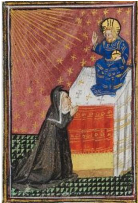
Figure 1, Yolande d'Aragon en prière. Cambridge, Fitzwilliam Museum, ms 62, f 139v

pour parvenir à susciter une contemplation intérieure qui n'est plus le fait des yeux du corps, mais des yeux de l'âme. 6 L'ordre du matériel doit être dépassé pour aller vers ce qui se trouve au-delà et l'image y occupe la place d'un seuil à franchir.