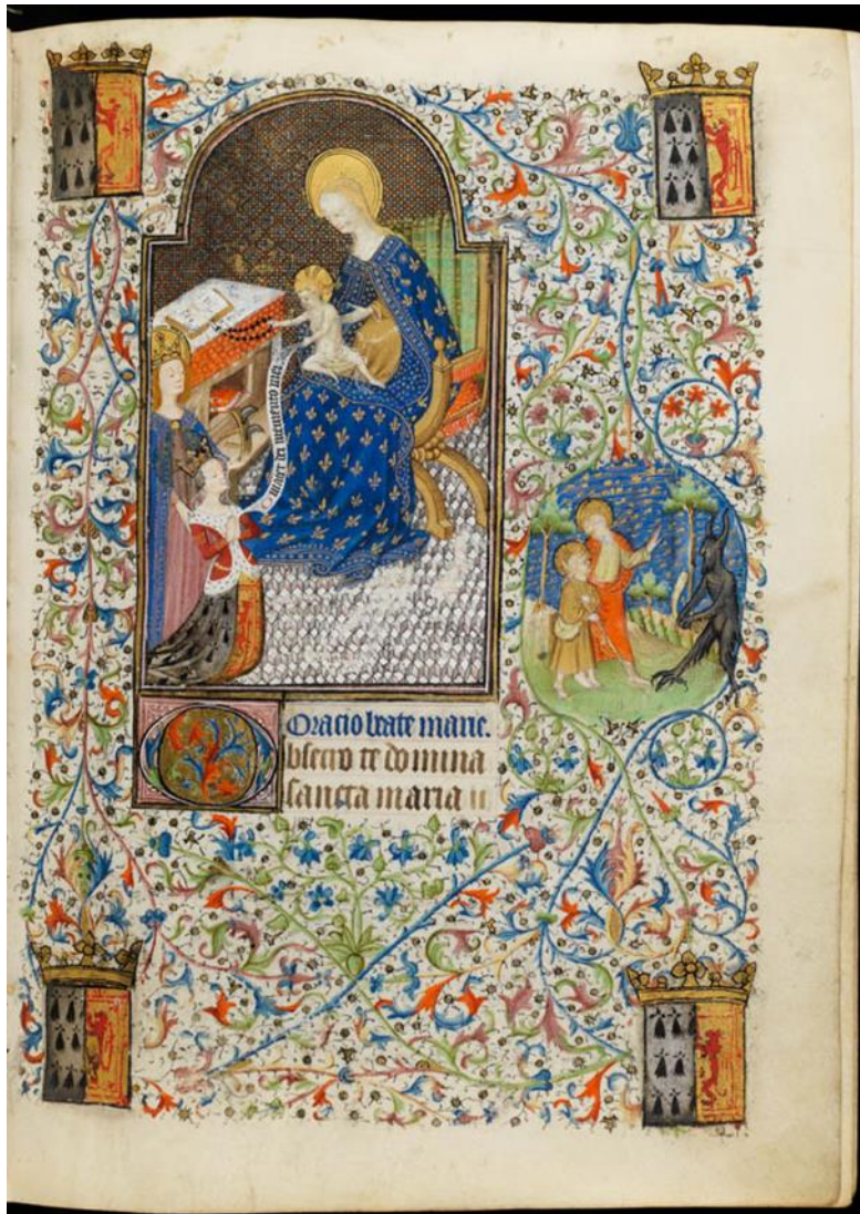
Figure 4, Isabelle Stuart en prière devant la Vierge, Cambridge, Fitzwilliam Museum, ms 62, f 20r

Le même balancement entre vision et mise en image de celle-ci se trouve au folio 20r (figure 4), qui ouvre l' Obsecro Te . 8 La composition prise dans sa globalité suggère le mouvement d'élévation nécessaire à l'esprit de la dévote pour atteindre le divin : les drapés du manteau de la Vierge, le phylactère qui porte les mots de sa prière et la position des personnages tracent une diagonale qui met les deux sphères, celle du