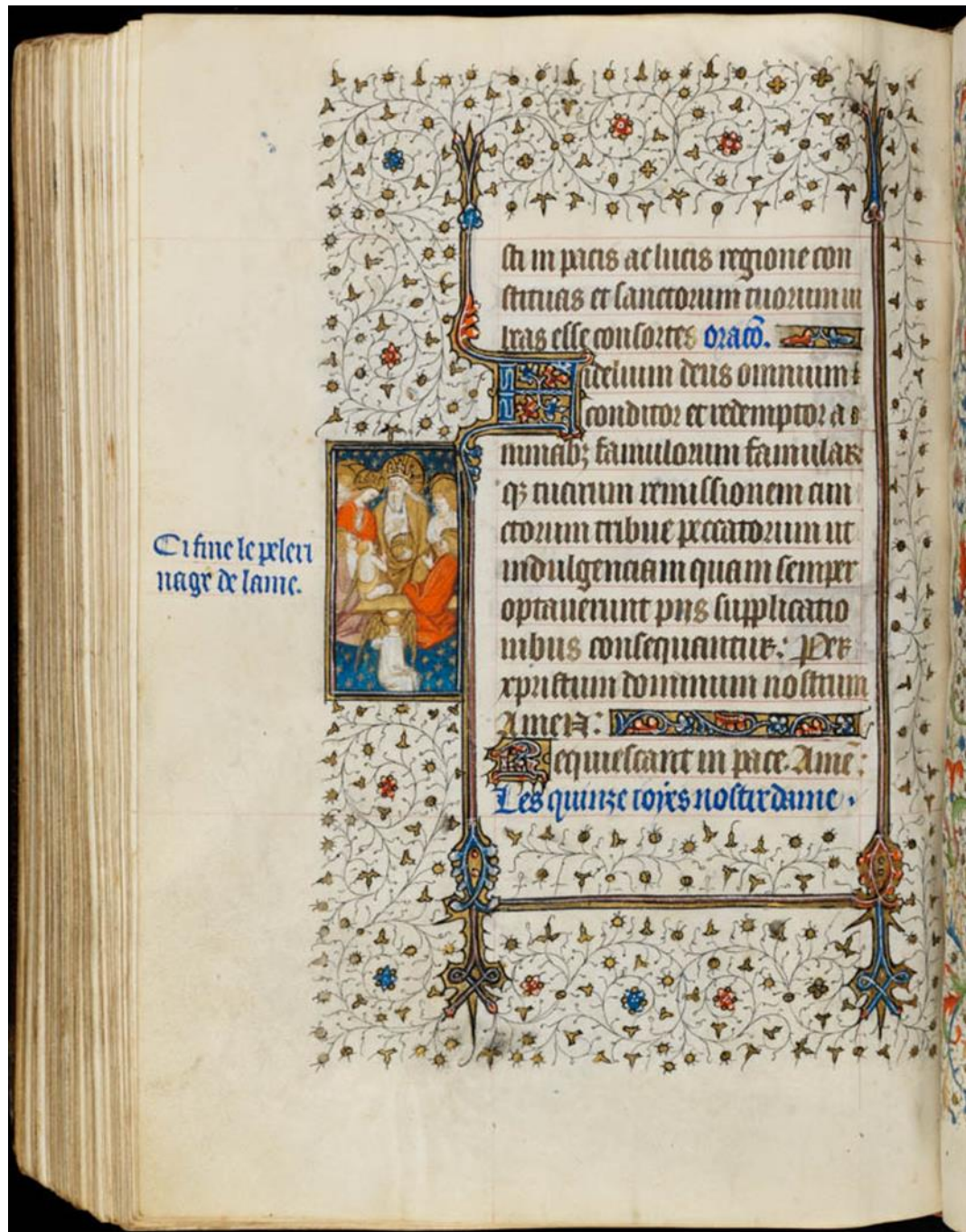
Figure 5, l'Âme du Pèlerin reçue au Paradis, Cambridge, Fitzwilliam Museum, ms 62, f 191v

enterrements et le parcours de l'âme de Guillaume de Digulleville, l'image offre une réponse aux prières formulées, avant d'ouvrir une perspective vers le Salut final, ce qui n'est pas sans faire écho aux visions de l'Apocalypse, puisqu'elles s'achèvent par la mise en présence de l'âme avec Dieu, dans une anticipation de la vision béatifique qui constitue l'horizon du temps chrétien.