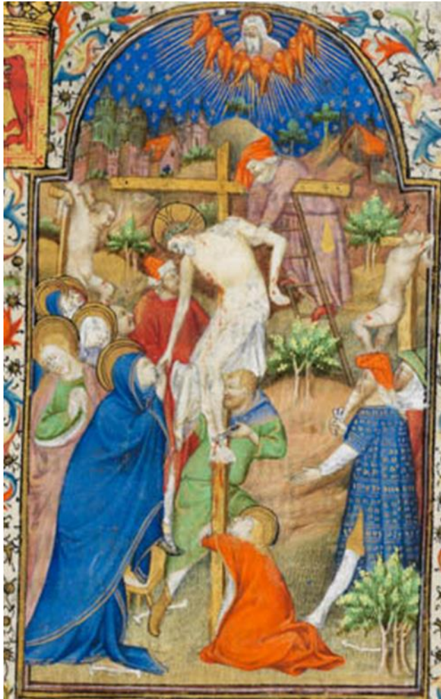
Figure 11, Descente de Croix, Cambridge, Fitzwilliam Museum, ms 62, f 134r