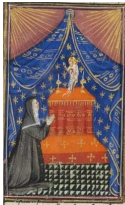
Figure 2, Yolande d'Aragon en prière, Cambridge, Fitzwilliam Museum, ms 62, f 140r

Aux folios 139v (figure 1) et 140 r (figure 2), le texte du Creator celi s'accompagne de deux images marginales de Yolande d'Aragon en prière devant des statues placées sur des autels. La première représente Dieu en majesté, et la seconde le Christ bénissant. Elles sont analogues à des corps : par leur couleur, par leur tridimensionnalité et leur interaction avec la dévote, vers laquelle leurs yeux sont tournés, ces caractéristiques définissent l'image matérielle comme le lieu d'une présence convoquée par la prière. 7 Cette présence est également rendue manifeste par la lumière qui rayonne depuis les coins de la vignette et signifie la sacralité