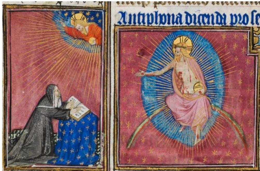
Figure 3, Yolande d'Aragon en prière, Christ Juge, Cambridge, Fitzwilliam Museum, ms 62, f 230v

de l'oratoire et de l'objet de la prière. Néanmoins, ce n'est pas l'image elle-même, en tant que réalité matérielle, qui reçoit cette dévotion, mais le prototype rendu présent par l'œuvre. L'ordre du visible doit donc être interprété et franchi pour atteindre le divin mobilisé par l'acte de piété.