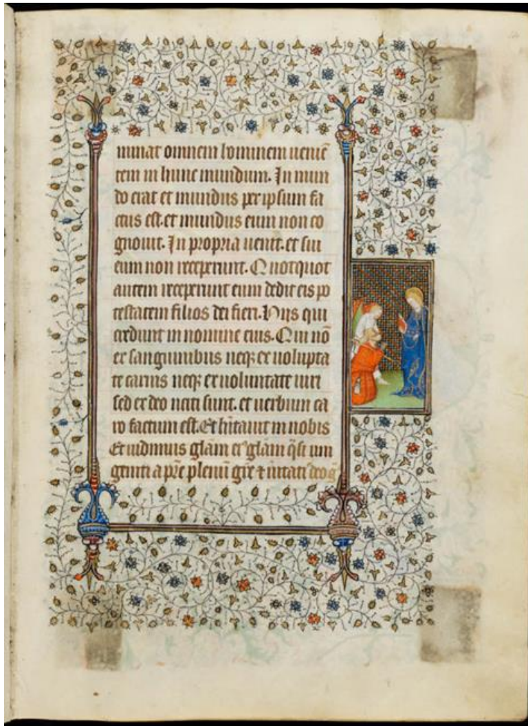
Figure 8, Joseph devant la Vierge, Cambridge, Fitzwilliam Museum, ms 62, f 16r

La verticalité que suppose donc la vision inspirée comme mode de révélation n'efface ainsi pas la posture nécessaire du récepteur qui doit, par l'exercice de l'esprit, comprendre et rendre intelligible ce qui lui est donné à voir et à connaître. La vue est ici un mode de perception non plus corporel, mais spirituel, comme moyen de réception de la vérité qui émane de Dieu : les images du cycle de l'Apocalypse mettent en scène la réception de la vision et le rôle du témoin en représentant saint Jean dans une posture de récepteur et de transmetteur de la révélation.