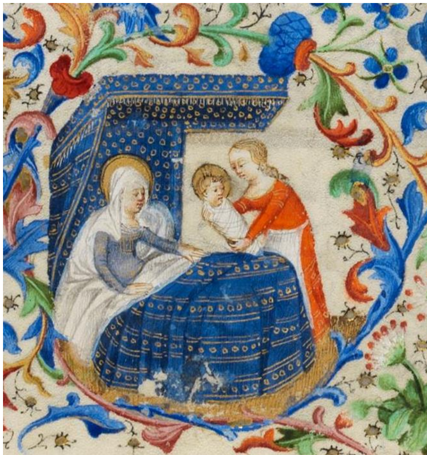
Figure 14, Nativité de la Vierge, Cambridge, Fitzwilliam Museum, f 29r

Un des exemples traités par Elizabeth L'Estrange est celle de la maternité et des rites qui s'y rattachent à travers la Nativité de la Vierge et la Présentation au Temple.