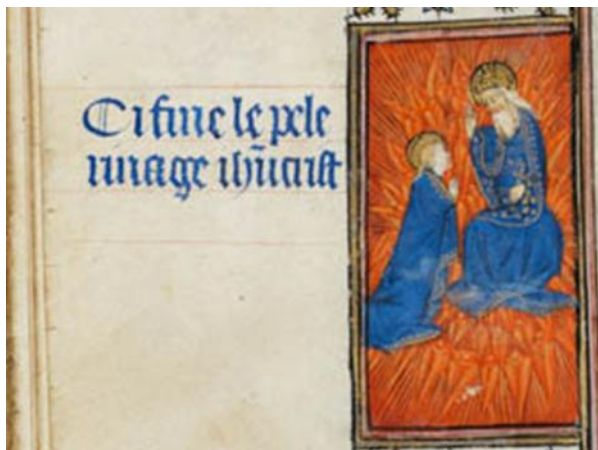
Figure 9, Vierge en prière, Cambridge, Fitzwilliam Museum, ms 62, f 28r

par la présence de Dieu. Au terme de deux des trois récits de Guillaume de Digulleville, comme à la fin du texte de la Révélation se trouve une image de la vision de Dieu ou de sa promesse : au folio 28v, la Vierge est en prière devant lui (figure 9), au folio 98v Jean reçoit une vision de Dieu qui clôt l'Apocalypse (figure 10), et l'âme du pèlerin est accueillie au Paradis au folio 191v (figure 5). Dans cette image tout particulièrement, qui se trouve à la fin de l'Office des Morts, l'âme est présentée face à Dieu et à la cour céleste. Cette image du Paradis anticipe la vision béatifique des élus à la fin des temps et fait écho à la Jérusalem Céleste vue par saint Jean et dont l'image, sous la forme de l'Église à laquelle le pèlerin est amené par la Grâce de Dieu, termine le Pèlerinage du Corps .