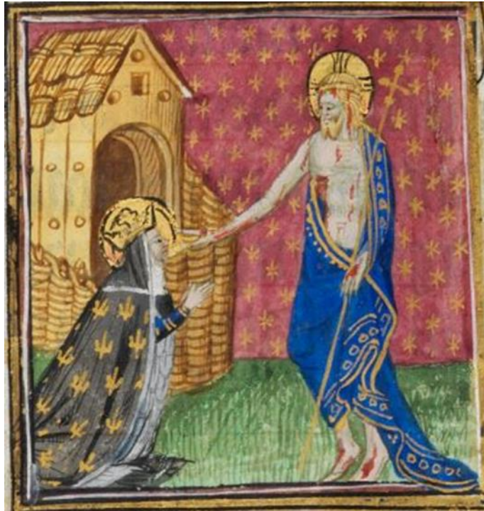
Figure 13, sainte Radegonde en prière, Cambridge, Fitzwilliam Museum, f 226v

Toutes ces images paraissent mettre en scène un rapport particulier entre les femmes et Dieu : on y voit Marie Madeleine, figure de la pécheresse repentie devenue si proche de Dieu qu'elle est la première à le reconnaître après sa Résurrection, l'abbesse épouse du Christ, connue pour sa piété et sa profonde dévotion, et enfin la duchesse d'Anjou qui est donc représentée à la toute fin du manuscrit. Cette attitude est à rapprocher de la figure de la sponsa du Cantique dont le modèle matrimonial est celui de l'union à Dieu en même temps qu'un modèle de relation entre le charnel (du côté du féminin) et le spirituel (principe masculin). 24 Il y a de surcroît une transition entre un Christ incarné, présent dans le monde, vers qui la médiation se fait par le toucher puis par la vue, par l'eucharistie, et enfin cette vision finale de la seconde venue du Christ qui s'impose à la fois comme une réalité future et comme la vision spirituelle d'une dévote en prière.