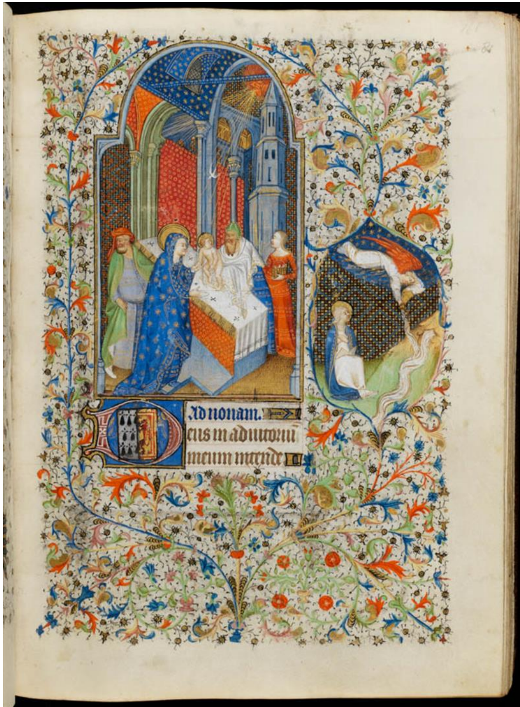
Figure 15, Présentation au Temple, Cambridge, Fitzwilliam Museum, f 84r

Une autre image discutée dans ce cadre est la Présentation au Temple, qui ouvre fréquemment l'office de None (f 84 r, figure 15). Cette fête est assimilée à la Purification de la Vierge et fait écho à une pratique bien attestée au Moyen Âge qui est celle du rite des Relevailles, étudié