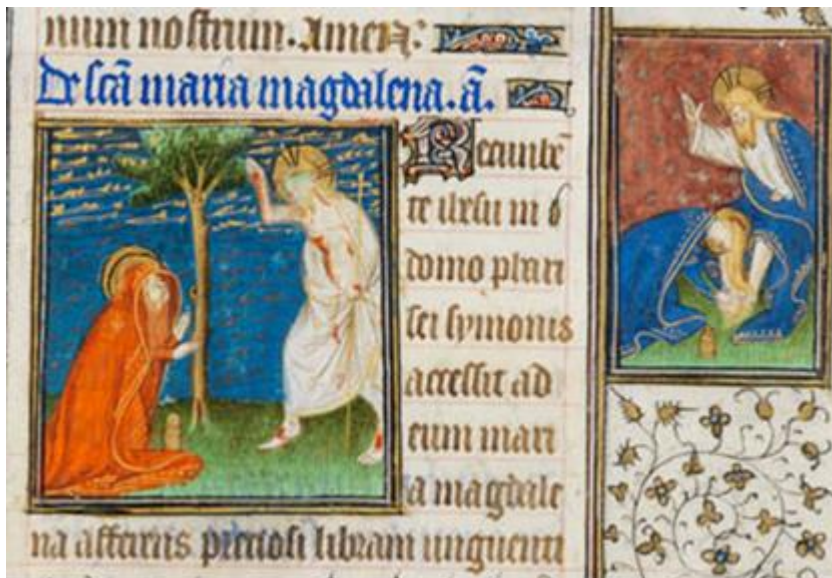
Figure 12, suffrage de Marie Madeleine, Cambridge, Fitzwilliam Museum, f 217v