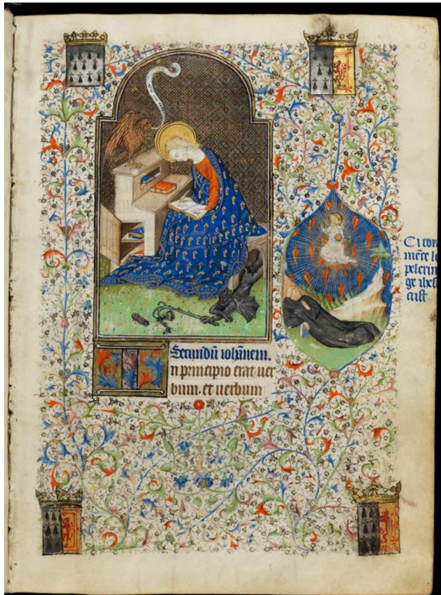
Figure 6, Saint Jean l'Évangéliste, vision de Guillaume de Digulleville, Cambridge, Fitzwilliam Museum, ms 62, f 15r

spectateur de sa part active puisque toute vision doit être comprise et interprétée. Ce type de vision décrit ici ajoute une dimension supplémentaire : celle de témoin et de transmetteur, de médiateur qui met en avant le rôle prépondérant des prophètes et des évangélistes tels que saint Jean.