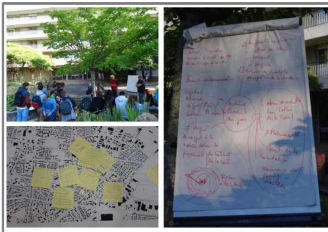
Fig n°5 : Exprimer son ressenti

Mais comment donner à voir ces expériences singulières ? Comment dire le dépaysement ? C'est l'exercice de la difficile transposition de la richesse de l'expérience vécue. L'enjeu est de témoigner de ces expériences intimes, uniques et non reproductibles. Il est alors nécessaire d'accompagner le processus d'énonciation qui fait advenir la compréhension et d'inciter, au récit pour permettre la prise de distance à l'égard du vécu du terrain. « Qu'avez-vous ressentis en parcourant ce(s) lieu(x) ? », la psychomotricienne de l'hôpital, tout comme l'artiste marcheur ou l'animateur-maraicher, invitent les étudiants à exprimer leurs affects à l'issue de leur marche : carte heuristique, post-it positionnés sur une carte (fig. n°5) réactivent un cheminement mental et confèrent au chemin un rôle de structure narrative.