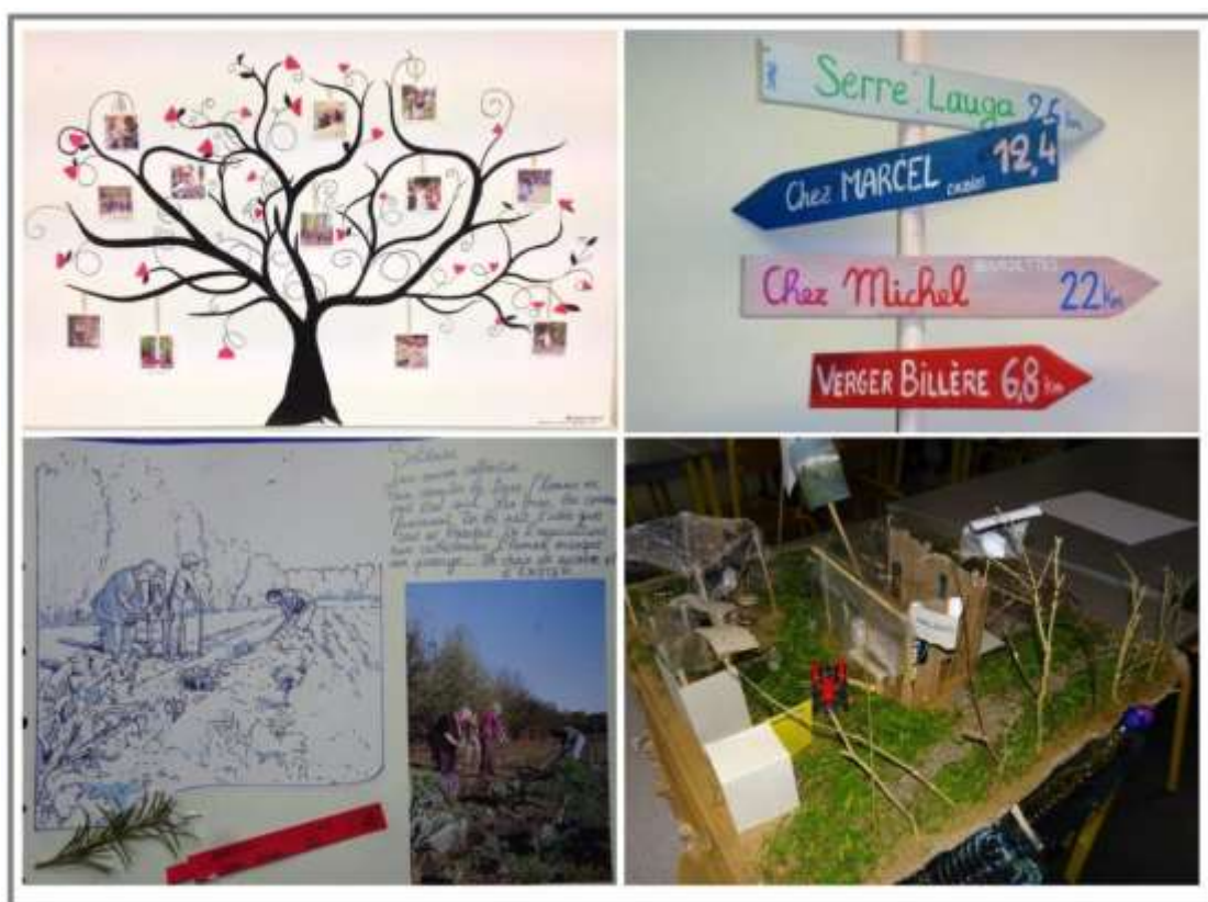
Fig n°6 : Diversité des formes des récits géographiques

Les auditeurs sont toujours surpris, voire émus, de la puissance évocatrice des créations proposées.