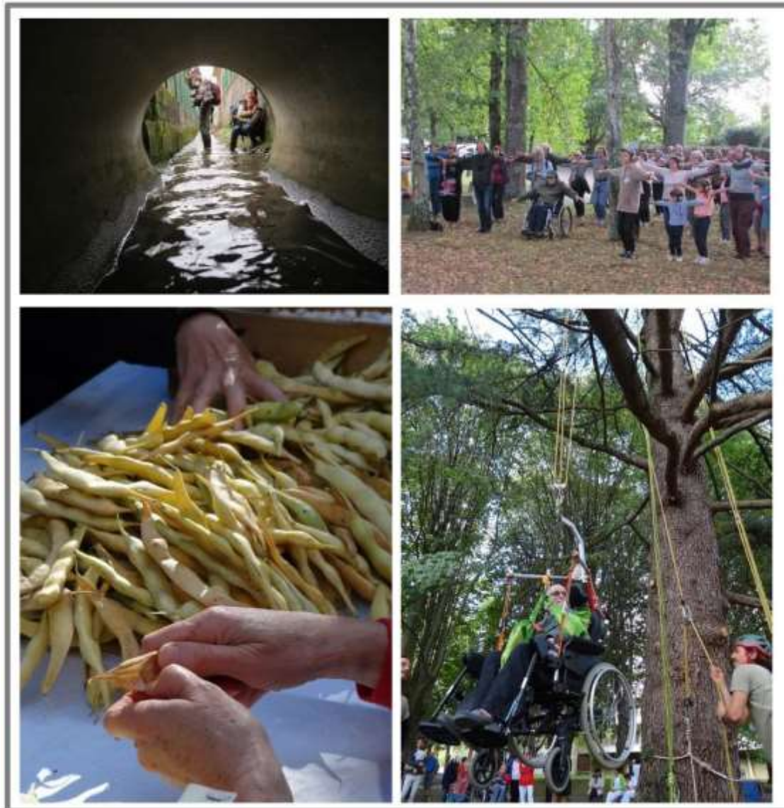
Fig n°3 : Le corps pour tisser des liens.

fauteuil roulant, grimper aux arbres, planter des choux collectivement, ces manières de pratiquer les lieux autorisent des rencontres et des proximités surprenantes, souvent désinhibitrices, qui mettent les personnes en situation de co-présence, sans crainte de jugement. Le processus complexe d'intériorité/ extériorité de l'individu autorise un décentrement par rapport à soi et une nécessaire attention à l'autre.