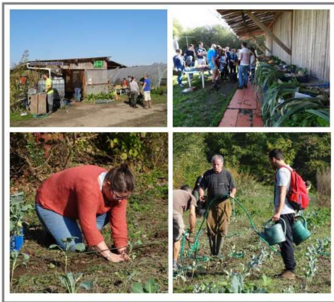
Fig n°2 : Interagir en travaillant la terre aux Parcelles Solidaires®.

La dernière expérience a eu lieu dans le cadre d'une manifestation culturelle portée par un collectif d'acteurs issus de divers milieux professionnels du soin, de l'art et de l'éducation et ayant pour enjeu de décloisonner le regard sur le vieillissement . Le projet, intitulé Les 5 Saisons de l'Arbre 6 , mêle la médiation artistique et le rapport à la nature pour favoriser la rencontre intergénérationnelle . En continuité d'ateliers de création animés par des artistes au sein du service hospitalier, quatre week-ends-événements, conçus comme des dispositifs artistiques participatifs, interpellent le public dans des déambulations entre les jardins publics de l'hôpital et de la ville. Les étudiants ont été amenés à observer 7 les formes d'appropriation éphémère de ces espaces publics. Les parcours, de longueur restreinte, engagent fortement la gestuelle et le corps pour interpeller sur les réalités du vieillissement dans l'accessibilité aux lieux publics.