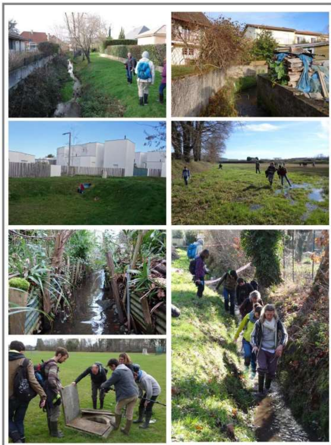
Fig n°1 : « La sensation de continuité [du cours d'eau] permet d'appréhender de manière plus vive le contraste des ambiances traversées » (Strum 2010: 167).

Une deuxième expérience se présente comme une « balade en paysage d'éleveurs » 3 . Ce dispositif, piloté par la Chambre d'Agriculture, a été construit pour permettre une rencontre improbable entre un public de vacanciers et des agriculteurs. L'enjeu est de donner la parole aux