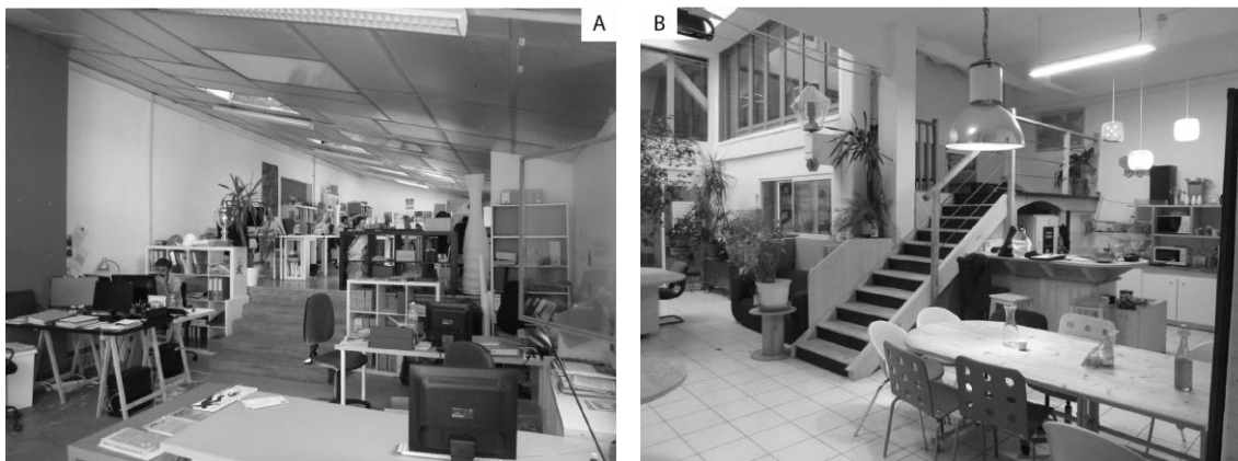
Figure 1 : Intérieurs de deux espaces de coworking de Nantes et Marseille

Les espaces de coworking sont aménagés de manière à avoir à la fois des bureaux de travail (A) et des espaces conviviaux d'échange tels qu'une cuisine et une salle à manger (B).