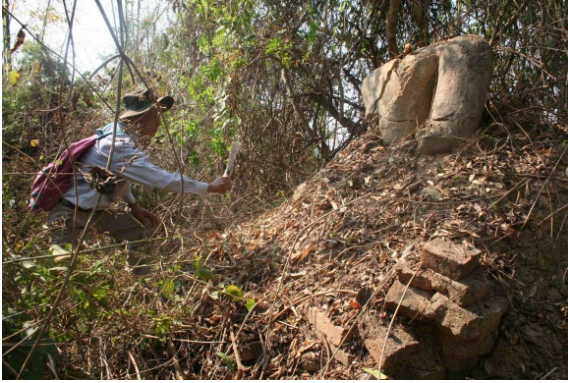
Ill. n° 2. Autel d'un temple abandonné