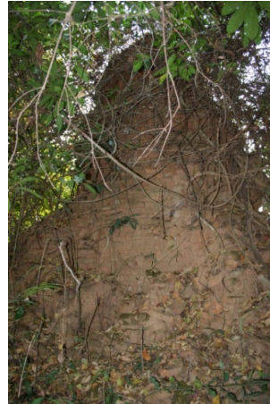
Ill. n° 3. Ruines d'un stūpa

Phanom) est alors l'un des sièges du pouvoir siamois dans la région 5 . À cette époque, et ce jusqu'à la fin des années 1880, le contrôle de Bangkok s'exerce de fait également sur une grande partie de la rive orientale du Mékong, empiétant sur l'ancienne zone d'influence du Vietnam, voire de la Chine – et il n'est plus question depuis environ un siècle de pouvoir lao indépendant, avec la soumission en 1779 des trois grandes entités politiques de Vientiane, Luang Prabang et Champassak à l'autorité du roi Phya Taksin, puis à celle de la dynastie Chakri.