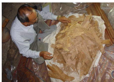
Ill. n° 7. Manuscrits