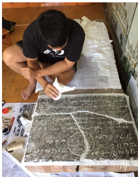
Ill. n° 10. Piédroit inscrit de Ban Xieng Vang

Il s'agit des grandes stèles inscrites du Vat Ho Phra Kaeo de 1813 70 et du Vat Sisaket de 1824 71 . Toutes deux fournissent en effet un élément qu'aucune autre stèle à part celle du That Sikhot ne contient : la mention du « tithi ». Par ailleurs, les stèles du Vat Sisaket, du That Sikhot et de Ban Xieng Vang sont les seules sur la rive gauche du Mékong qui précisent les données jusqu'à mentionner l'« avoman » 72 . Une autre caractéristique apparemment relative à la date tend à rapprocher la stèle du That Sikhot de celle du Vat Sisaket : cette dernière contient deux formules liées à un chiffre – « maṅgala rūp 44 » et « maṅgala som 44 » 73 – mais qui pourraient également se retrouver dans la première, puisque les termes « som » et « rūp » semblent s'y retrouver, dans un ordre différent, et associés semble-t-il aux chiffres 58 et 59. Se pourrait-il alors que les deux stèles retrouvées près de Thakhek aient été en fait rédigées