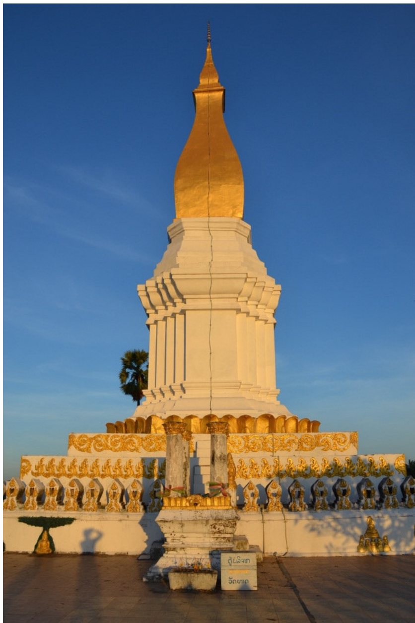
Ill. n° 1. That Sikhot face ouest