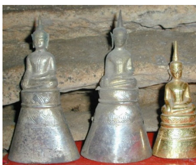
Ill. n° 6. Statuettes du Buddha

Parmi les divers objets anciens découverts dans la grotte de Tham Pa Fa, se distinguent nettement quelque 230 images de Buddha, de différentes tailles et en différents matériaux, y compris en or et en argent (ill. n° 6). Une soixantaine d'entre-elles sont inscrites et parmi celles-ci la plupart indiquent une date, parfois précise. Dans l'état actuel des recherches 51 , il est intéressant de constater que la plus ancienne inscription remonte à 1611, c'est-à-dire à une époque où le Lān Xāng, après avoir été contrôlé durant deux décennies par les Birmans, commence à trouver une stabilité – et que la plus récente date de 1758, peu de temps avant que le royaume lao alors divisé soit contrôlé par les Siamois. Les inscriptions sont rédigées sur les bases ou sur les trônes des images.