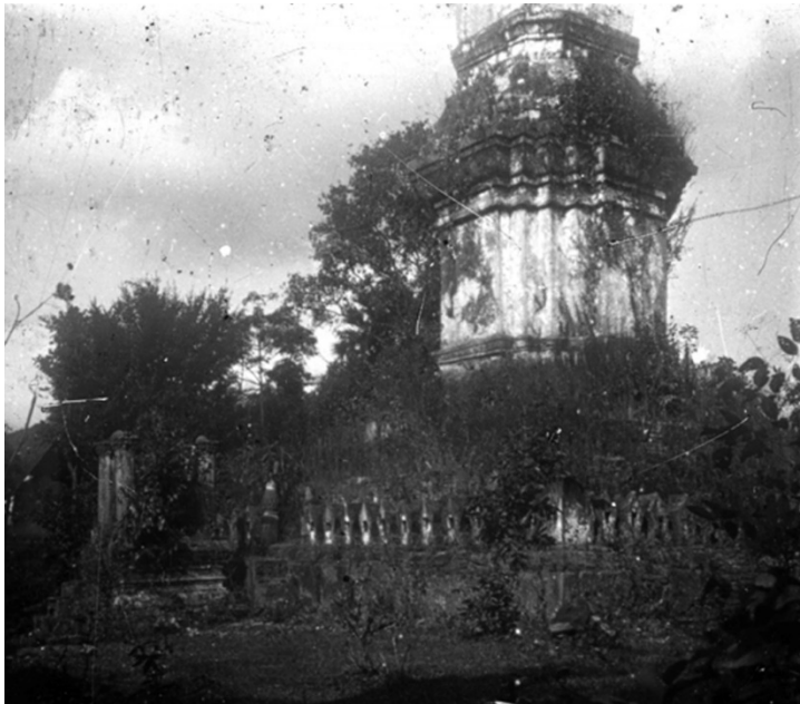
Ill. n° 4. That Sikhot, 1911 (Parmentier, H., op. cit.)

par une production concurrente de grandes et belles images en bois (comme à Luang Prabang) ou d'une statuaire en pierre (comme à Phayao au Lān Nā). Il y a là un problème à résoudre touchant à l'histoire de la culture matérielle de la région, d'autant plus que celle-ci était riche en mines d'étain et de cuivre.