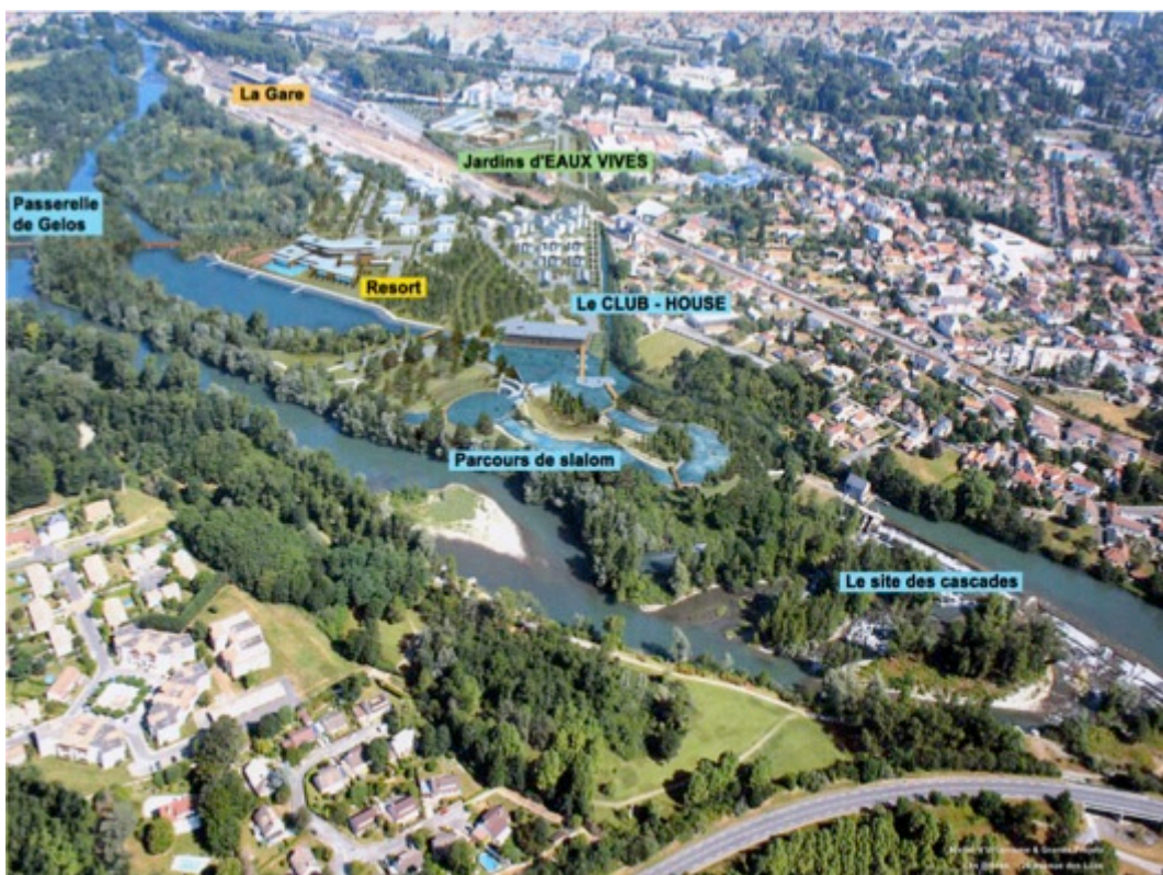
Figure 4 : Vue d'ensemble de l'aménagement du stade d'eaux vives