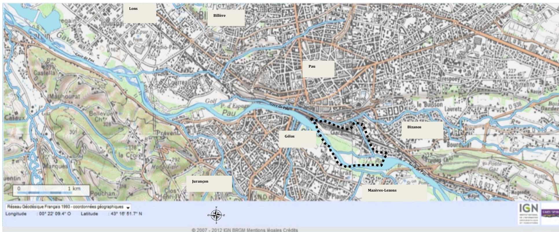
Figure 2 : localisation du projet Portes des Gaves, à Pau