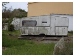
Trace d'exposition aux intempéries : caravane délabrée