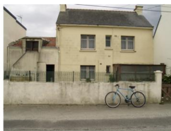
Le vélo contre le désœuvrement