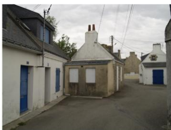
Maisons fermées en basse saison

« il y avait du travail, à l'époque il n'y avait aucun problème, il y avait l'arsenal qui employait pas mal de personnes, et la pêche qui était très importante. On a connu jusqu'à... au moins 50 bateaux, pas des petits canots comme on voit maintenant, des bateaux qui faisaient entre 12 et 18m, qui employaient l'hiver 7 personnes, l'été jusqu'à 12... »