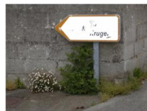
Trace d'exposition aux intempéries : panneau illisible