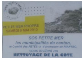
Nettoyage : prendre soin du littoral