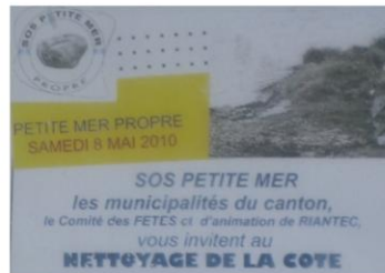
Nettoyage : prendre soin du littoral