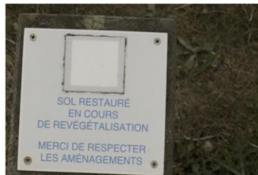
Révégetalisation : prendre soin du littoral