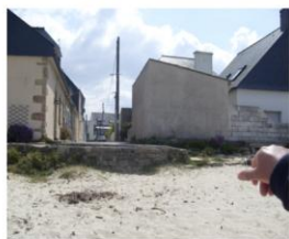
Figure 1. Album commenté : l'expérience des éléments dans tous ses états

« ma grand-mère habitait là, ce mur là on le voyait 2 mètres en dessous le sable, et le sable est monté, monté... il y avait rien de ça, tout du long, il y avait un escalier un peu plus loin, il faisait bien 2 m. de haut... »