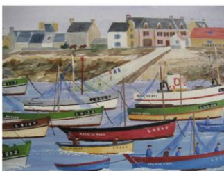
Imaginaire social de la pêche

« il y a un problème ici, c'est le déficit de sable, la cause de cette submersion c'est le déficit de sable, on a perdu en sable à peu près 2m à 2m50 de hauteur, tout du long de cette plage alors le sable s'en va... il y a la dérive littorale qui s'en va par là-bas, donc le sable il s'en va toujours par là-bas, ce qui fait que là il nous reste pas de sable... »