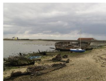
Vestiges d'un passé de pêche intense