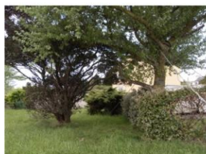
Trace d'exposition aux intempéries : arbre attaché

« ils avaient revégétalisé tout le secteur autour mais pour empêcher les gens d'aller dessus, après, il faut un suivi... c'est pas évident parce qu'à la commune il n'y a pas assez de monde pour faire ça,... ils veulent faire une promenade qui partira de Gâvres, ça fera une belle promenade... »