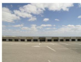
Vue bloquée de la mer

« quand on s'est battu pour l'extraction de sable, on avait eu des mails du Sénégal où il y avait des problèmes comme ça aussi, et les scientifiques qui s'occupaient de cette affaire au Sénégal, c'était aussi par rapport à des extractions, donc ils disaient que la main de l'homme y était pour beaucoup quand même »