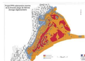
PPR submersion marine