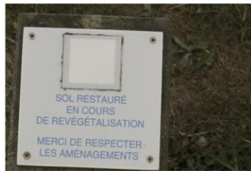
Révégétalisation : prendre soin du littoral