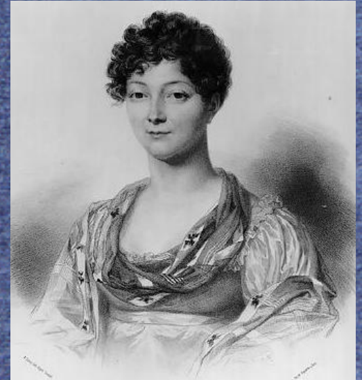
Gounod Credit : J.H. Camus