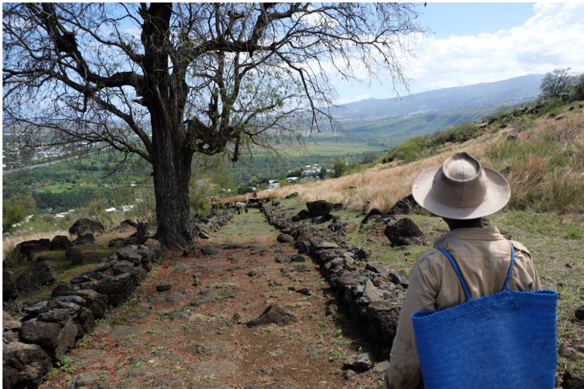
Un éleveur sur un chemin pavé du XVIII e siècle, dans la savane de Crève-Cœur.

Cette mutation des paysages de savane n'est par ailleurs pas séparable d'un changement profond de mode de vie, qui tient à l'obtention de droits sociaux nouveaux par les populations les plus déshéritées, mais aussi à l'évolution plus ou moins contrainte des manières d'habiter. La politique de R.H.I. (Résorption de l'Habitat Insalubre) a eu des effets particulièrement importants dans ce secteur de l'île, où les quartiers de cases en tôle ont disparu au profit de lotissements en dur et de petits collectifs, dans lesquels il n'est plus possible de garder des animaux. Le petit élevage familial de cabris a ainsi régressé de façon spectaculaire ces dernières décennies 7 , avec pour conséquence de favoriser la prolifération de certaines espèces d'arbustes et d'arbres, que le feu ne participe plus aussi efficacement qu'auparavant à contenir.