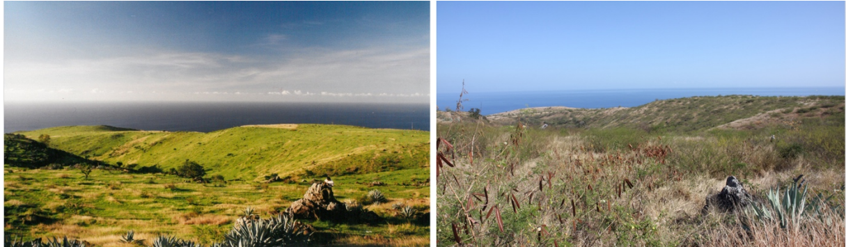
Progression spectaculaire du Leucaena leucocephala dans la savane du Cap La Houssaye entre 2001 (à gauche) et 2015 (à droite).

Reste que viser à conserver des savanes et, plus globalement, à formuler un projet pour ces espaces, voire en faire un objet de recherche, ne va pour le moins pas de soi, aujourd'hui encore, à La Réunion ; cela pour de multiples raisons dont on proposera ici un bref examen.