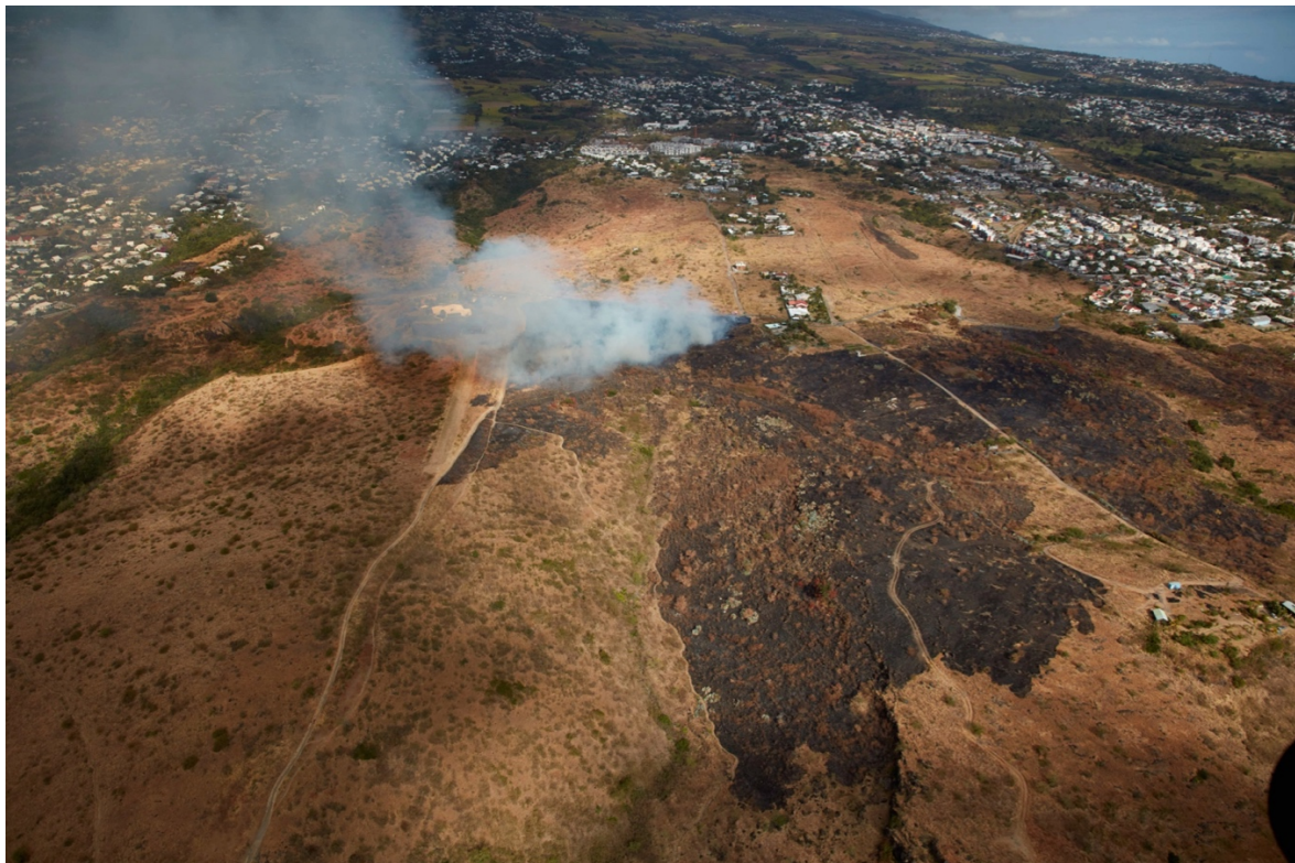
Chantier de brûlage d'août 2017 au Cap La Houssaye.

terrains brûlés dès la repousse. Piloté par l'association APPER — auquel le Conservatoire du littoral a confié cette responsabilité — et une agronome du CIRAD en charge de cet aspect de notre recherche-projet 31 , ce volet pastoral poursuit deux objectifs complémentaires. Celui de se servir de cette expérience pour construire un troupeau conservatoire de la race « cabri péi », aujourd'hui en danger de disparition à La Réunion et celui d'impliquer les éleveurs des savanes intéressés par ce projet dans le montage et le gardiennage du troupeau. La future gestion que préfigurent les expérimentations menées au Cap La Houssaye ne vise de fait pas à substituer l'action de la collectivité à celle des éleveurs (et des usagers de la savane en général), mais à poser les bases d'un projet visant à la fois à la reconnaissance symbolique, la légalisation, la sécurisation (pour ce qui est du brûlage) et — grâce à tout cela — la revitalisation de pratiques d'exploitation des ressources indispensables à la conservation des paysages.