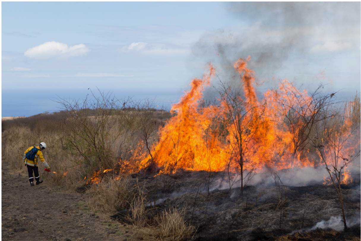
Opération de brûlage dirigé au Cap La Houssaye (novembre 2016).

de gestion des ressources, sur lesquelles avait reposé, dans la longue durée, l'entretien de ces milieux et paysages.