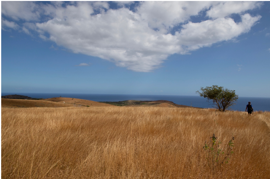
1. Le Cap La Houssaye, pour partie propriété du Conservatoire du littoral, abrite l'une des dernières savanes ouvertes de La Réunion.