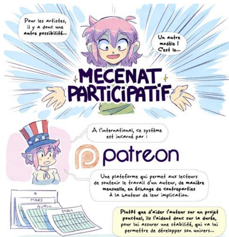
Illustration 1 : Un nouveau modèle de financement des artistes du web