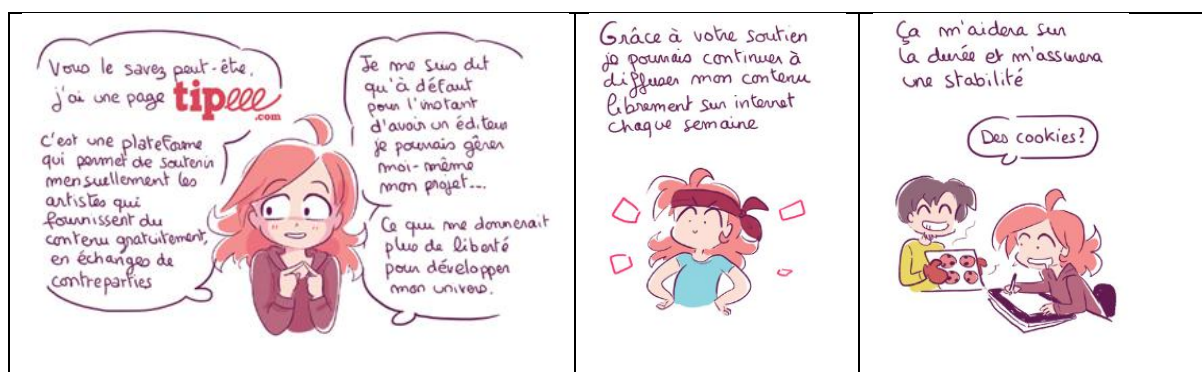
Illustration 2 : le soutien des Tipeurs comme mode d'accès à la liberté