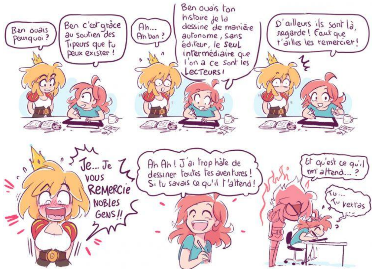
Illustration 4 : Pourquoi Yatuu est-elle présente sur Tipeee ? 18