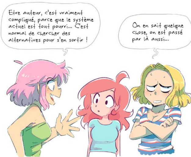
Illustration 3 : Les encouragements de Maliki envers Yatuu