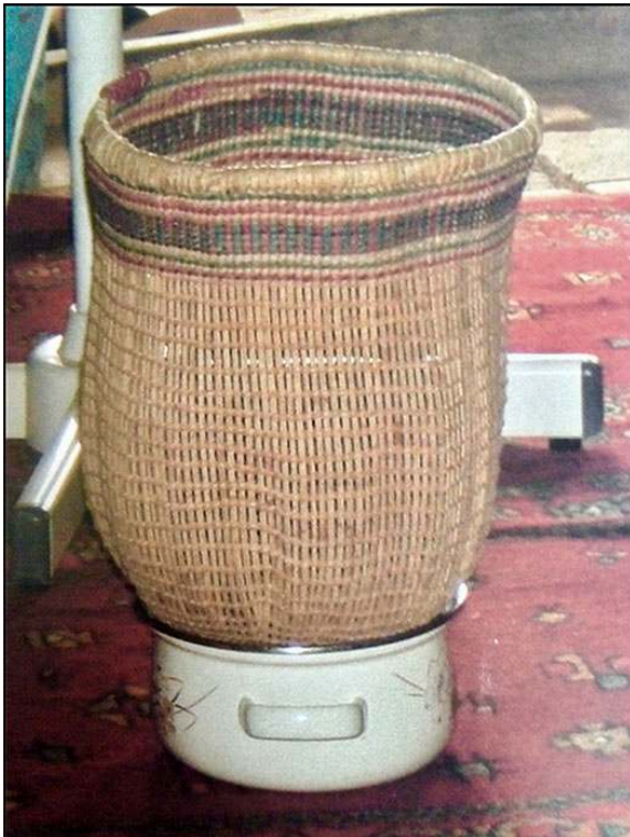
Niaber HAÏDARA, La Gastronomie à la tombouctienne , Saint-Jean d'Angély, Impressions Jean-Michel Bordessoules, 2005, p. 36.