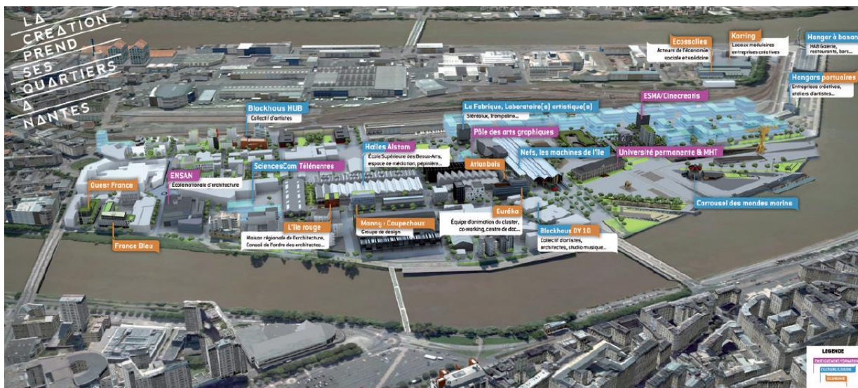
Image présentant le quartier de la création, extraite du dossier de presse, « La création prend ses quartiers, Ouverture de l'espace d'animation du Cluster & Inauguration du Karting », 19 janvier 2012