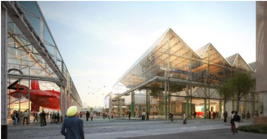
Vue perspective sur le parvis « glissé » sous l'ESBANM, reliant les différents programmes du site du projet de reconfiguration des Halles Alstom. (images Franklin Azzi architectures, février 2011)