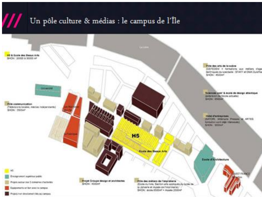
Diapositive extraite d'une présentation du projet urbain de l'île de Nantes, SAMOA, mai 2007