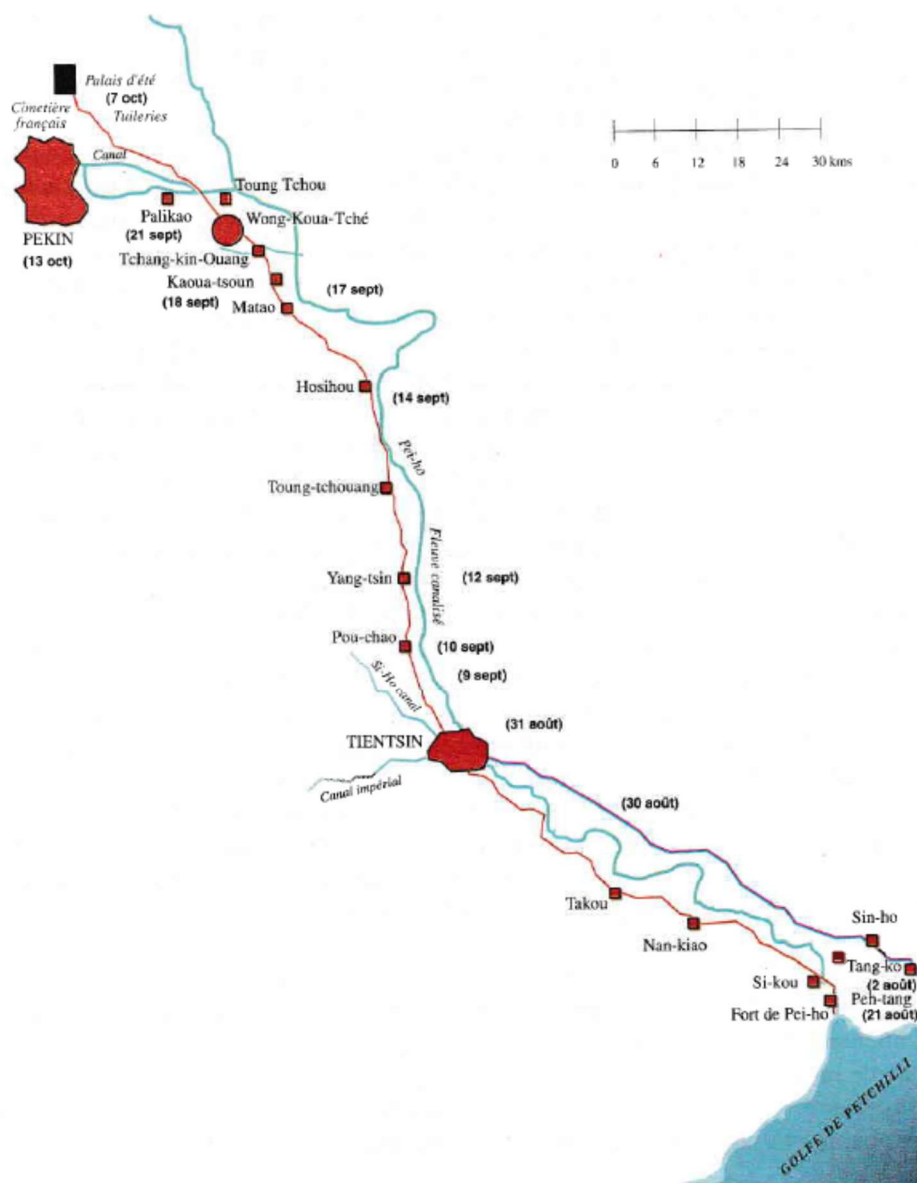
Figure LXIX. – Itinéraire des armées alliées en Chine (août-octobre 1860)