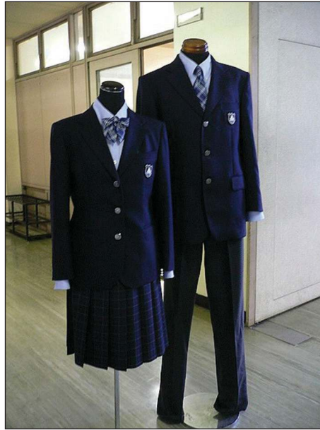
Photo 3 - Uniformes japonais du lycée Izuo depuis 2003 à Ôsaka, Japon