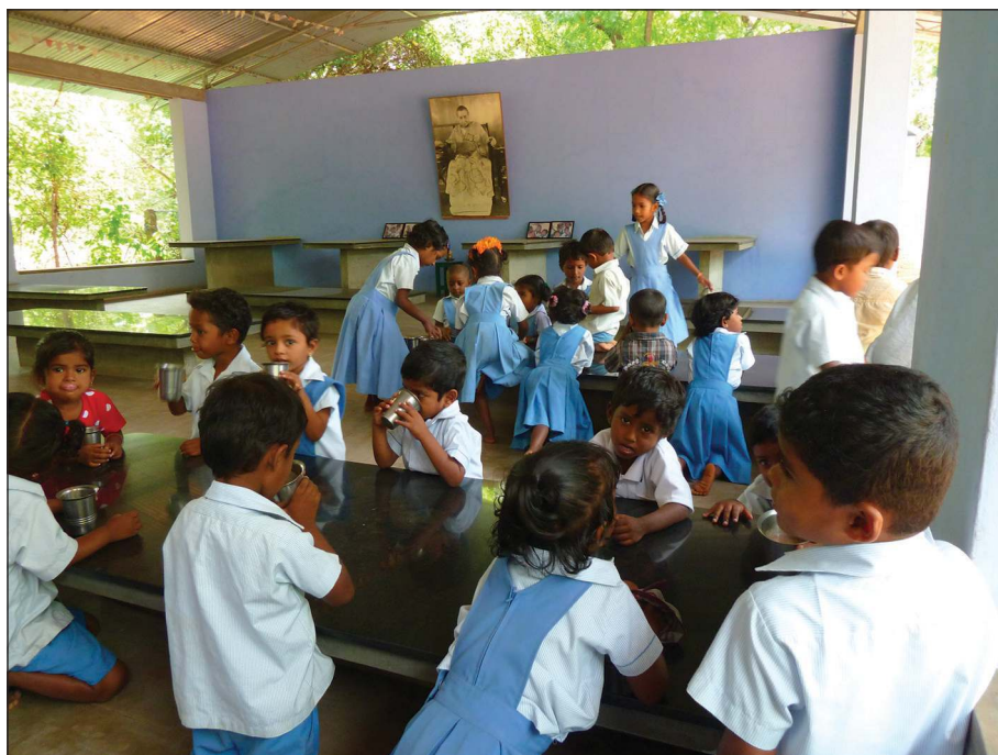
Photo 2 - Dans cette école de l'État du Tamil Nadu, les enfants prennent chaque matin un verre de lait, mélangé à des céréales grillées, des pois chiches, du sucre et des vitamines, qui est appelé sathu maavu. Ils portent l'uniforme de leur école, seuls sont exemptés ceux qui fêtent leur anniversaire (Inde, 2013)

Si la représentation des parents vis-à-vis de l'ensemble du système éducatif est généralement favorable, pour les filles comme pour les garçons, à une participation accrue au circuit scolaire la mixité réelle n'est pas toujours observable.