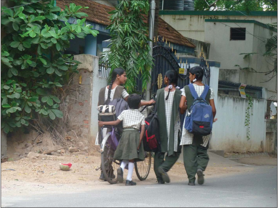
Photo 4 - Jeunes filles du Tamil Nadu se rendant à l'école (Inde, 2014)

la réforme du secteur éducatif. En effet, une révision du texte premier de l'éducation, directement lié à la Constitution japonaise, la Loi Fondamentale sur l'Éducation , a eu lieu dans les années 2000 au Japon, s'inscrivant ainsi dans l'ensemble des mesures néolibérales que défend Koizumi Jun'ichirô, Premier ministre d'avril 2001 à septembre 2006 (Galan, 2013). L'article 5, qui garantit la coéducation et le respect mutuel entre les deux sexes a également été modifié, malgré les protestations de groupes d'enseignant-e-s, d'associations féministes et de délégations japonaises aux Nations unies. Le ministère de l'Éducation a justifié de façon détaillée les raisons de la suppression de l'article 5, en expliquant que la coéducation était désormais effective dans le pays. Sans faire de mauvais esprit, on peut se demander dans ce cas pourquoi les institutions japonaises non mixtes sur leurs statuts ou dans les faits, notamment les universités à cycle court, continuent d'orienter et de marquer une ségrégation entre les deux sexes, mais aussi si le gouvernement n'imagine pas, pour une population ciblée ou pour des raisons économiques, de ne plus proposer une scolarité similaire aux filles et aux garçons.