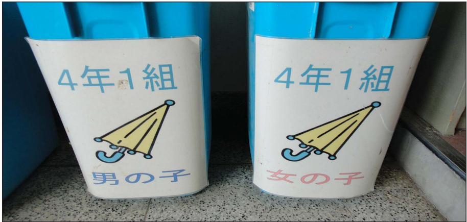
Photo 1 - Porte-parapluie dans une école japonaise : bleu pour les garçons, rose pour les filles (école T dans la métropole de Tôkyô, février 2014,)