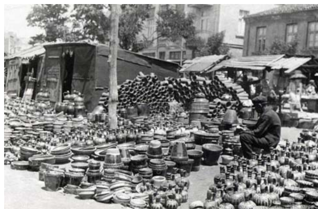
Fig. 3 : Carte postale, Sofia, marché des femmes, années 1930.