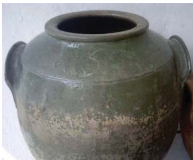
Fig. 9 : Jarre marquée « 5 » sur l'épaule. Lovč, Coll. part.

cette opération pratiquée encore au milieu du XX e siècle. D'après les descendants du potier, il était possible de faire poisser dans l'atelier une jarre achetée ailleurs. La pose de la poix nécessitait un réchauffement préalable des parois du récipient pour assurer une meilleure pénétration dans les pores (François 2016). Durant l'époque ottomane, en Bulgarie, il semble que seule la paroi extérieure était poissée. Était-ce en raison de la composition de la poix ou à cause d'une interaction éventuelle avec le contenu ? Un proverbe bulgare va dans ce sens en affirmant « Une goutte de goudron gâche une jarre (ou un tonneau) de miel ».