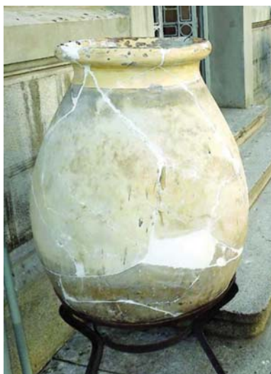
Fig. 17 : Jarre de Biot devant le Musée de la ville de Silistra

préférence et avec les poils rasés courts et tournés vers l'intérieur. Le fromage et le saindoux se gardaient dans des tonnelets en bois. Les sacs en tissus, suspendus aux poutres ou aux murs pour éviter les rongeurs, renfermaient des fruits et des légumes ou des préparations de pâte séchées (Мурджева-Панчева 2007, Лулева 2002).