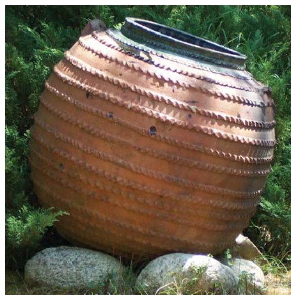
Fig. 14a-14c) : Grandes jarres à cordons : (a) région de Botevgrad ; (b) Musée de Samokov ; (c) région de Trojan. Coll. part.