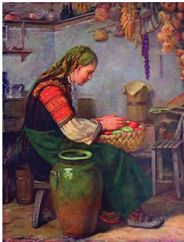
Fig. 16 : « Préparation des conserves d'hiver », Jan Mrkvička, entre 1881 et 1921. Galerie Nationale d'Art, Sofia

Aux XVIII e et XIX e siècles, dans l'ouest de la Bulgarie, l'artisanat de la terre était très actif dans plusieurs centres urbains et dans de petits ateliers de campagne à l'activité saisonnière avec une diffusion locale. Cependant l'utilisation des jarres n'était pas aussi fréquente que dans les régions du pourtour méditerranéen. Il y avait