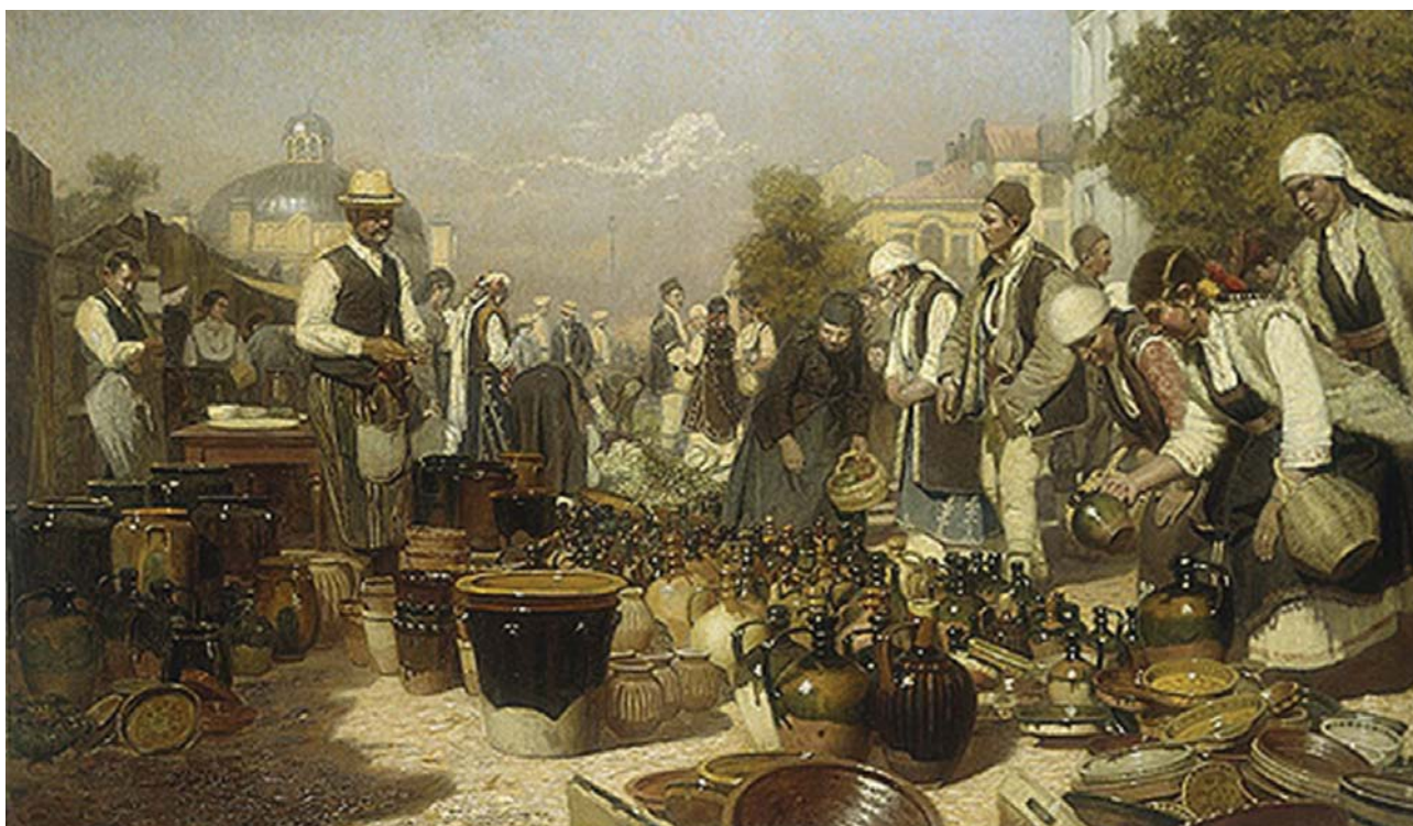
Fig. 5 : Anton Mitov, « Marché aux légumes de Sofia » (Marché potier), 1917. Galerie nationale d'art, Sofia.