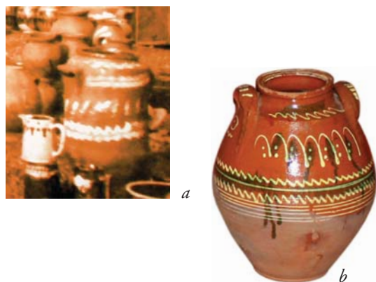
Fig. 13a, 13b : Jarres et jarron décorés : (a) détail de photographie du marché de poteries de Trojan à la ville de Ferdinand, 1834, fonds du musée de Trojan ; (b) jarron peint d'engobe et rehaussé de glaçures, fonds du musée de Trojan

De nombreuses recherches ethnographiques livrent des informations sur les granges qui étaient des pièces entières aménagées en bois, compartimentées et destinées au stockage des récoltes céréalières. De gros coffres en bois pouvaient contenir les grains ou les farines qui étaient aussi placés dans de grands paniers en vannerie. En Thrace, le yaourt épais de l'automne était conservé en outre de brebis fraîche de