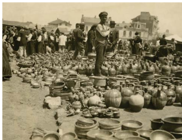
Fig. 2 : Carte postale d'un marché potier de Sofia, années 1930.

siècles, deux grands centres de production principaux, Trojan et Businci, fournissaient Sofia en céramiques. Comme semble l'indiquer le matériel archéologique, des petits ateliers locaux complétaient les besoins de la population de la ville. Sur les cartes postales, sur les photos d'archives du début du XX e siècle comme sur un tableau peint en 1917 par le peintre Anton Mitov, la plupart des jarres mises en vente sur les marchés de Sofia étaient munies de deux anses accolées en forme de « fer à cheval » (fig. 5). Par ailleurs, de petites jarres, comme celles qui sont empilées sur les marchés (fig. 4) et celles qu'on trouve dans des contextes du XVII e siècle, ont des anses verticales (fig. 6). Ces différents modes de préhensions sont visibles sur la photo du marché potier de Kyustendil du début du XX e siècle (fig. 7). D'autres exemples, archéologiques et patrimoniaux, confirment cette observation (fig. 8a-c). Généralement, les anses en « fer à cheval » étaient appliquées sur des formes quasi-cylindriques dont les volumes variaient de 10 à 100 litres. Les formes à deux anses verticales, à ouverture souvent plus serrée et panse plus ovoïde, ont des dimensions plus réduites et contenu de 10 à 20 litres. Toutefois, comme en témoigne l'étalage du marché de Kyustendil, des formes identiques pouvaient recevoir indifféremment l'un ou l'autre type d'anses.