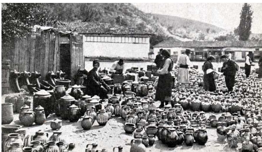
Fig. 7 : Carte postale, marché potier de Kyustendil, début du XX e siècle.