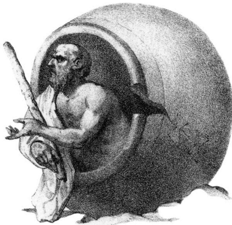
Jarre à large ouverture dite tonneau de Diogène. Grivaud de la Vincelle, Arts et métiers des anciens, vol. I, Paris, 1819, p. 400, pl. XXXIII.

ISBN : 978-2-35371-979-2 Achévé d'imprimer en Juin 2016 sur les presses de Mondial Livre 8, rue de Berne 30000 Nîmes – FRANCE Dépôt légal : Juin 2016