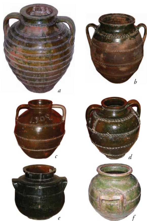
Fig. 12: Jarres et jarrons à cordons : (a) musée de Samokov ; (b-d) musée de Trojan ; (e) musée de Tétéven ; (f) musée de Trojan

De nombreuses recherches ethnographiques livrent des informations sur les granges qui étaient des pièces entières aménagées en bois, compartimentées et destinées au stockage des récoltes céréalières. De gros coffres en bois pouvaient contenir les grains ou les farines qui étaient aussi placés dans de grands paniers en vannerie. En Thrace, le yaourt épais de l'automne était conservé en outre de brebis fraîche de