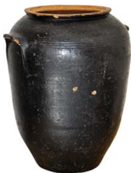
Fig. 15 : Jarre poissée de Sofia, H 50 cm. Coll. part.