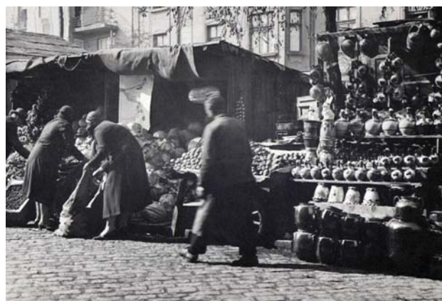
Fig. 4 : Carte postale, Sofia, marché des femmes, vendeur de poterie, années 1930.

En dehors des grandes villes, dans les campagnes, la commercialisation de la poterie se faisait lors des foires ou par vente itinérante, dans des charrettes menées par les potiers à travers les villages. D'assez vastes zones pouvaient ainsi être approvisionnées. Selon les sources écrites, au XIX e -début XX e siècle dans le cadre de cette vente, le potier échangeait le récipient de terre contre son contenu de grains