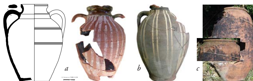
Fig. 8 : Jarrons de Kyustendil : (a) fouilles du site de l'Ancien cinéma d'été ; (b) collection du Musée d'Histoire de Kyustendil ; (c) jarre de Kyustendil Coll. part.

Les traditions régionales pour les jarres se manifestaient principalement à travers le traitement de surface. Un revêtement de glaçure, souvent verte, était posé sur toute la surface extérieure ou seulement sur la partie haute des jarres petites et moyennes. Quelques incisions en bandes droites ou ondulées pouvaient animer les surfaces. Les cordons digités consolidaient les grandes formes comme celle de Samokov qui atteint 60 cm de hauteur (fig. 12a). Leur fonction était principalement décorative pour les objets de taille moins importante qui, comme les exemples de Trojan et de Tétéven (fig. 12b-e), ne dépassent pas une trentaine de centimètres. Des bandes moletées ou hachurées pouvaient remplacer les cordons pour les petits formats (fig. 12f). Les jarres ne portent pas de décor élaboré car elles sont placées dans des espaces de resserre - le sous-sol où les aliments sont conservés au frais ou le réduit du garde-manger à l'étage. Il existe des exceptions comme sur cette photo d'archive de l'étalage de poterie de Trojan vendue au marché de la ville de Ferdinand (l'actuelle Montana) (fig. 13a). Placée à côté de petits pichets bien décorés, une grande jarre est peinte à l'engobe, elle est ornée de motifs simples organisés en registres et semble avoir eu un rôle d'enseigne. Les chansons folkloriques évoquent toutefois la « jarre peinte pour le miel ». Elle correspondrait plutôt aux petites formes comme