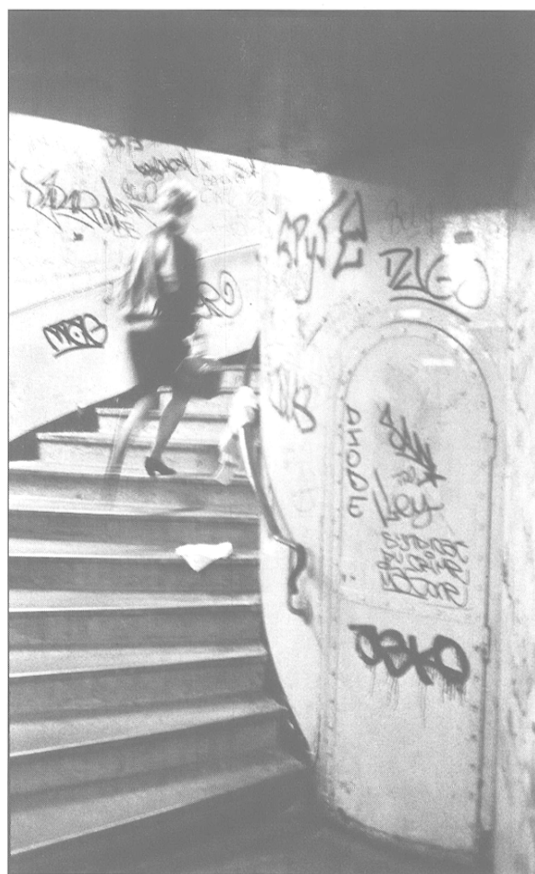
Un territoire marqué par les autres.

Relier, « sortir » les individus de la sphère privée où ils se réfugient, c'est tramer une reconnaissance mutuelle entre les habitants, veiller à ce qu'ils puissent faire cercle autour des institutions supposées les servir, c'est-à-dire se servir d'elles pour être ensemble. Ce n'est pas faire du lien social pour compenser celui que défait la police avec son injonction de « circuler ». On dépasse ici la représentation d'une « bonne » prévention qui ferait du lien social, qui produirait de la