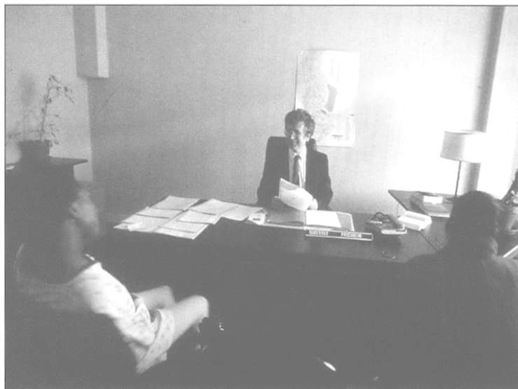
Maison de la Justice et du Droit, Sarcelles.

que le quartier n'est pas « hors-droit », que le territoire n'appartient pas à ceux qui tentent d'y faire régner leur ordre à eux. C'est également un renforcement de l'îlotage policier, des passages de la Brigade anti-criminalité.