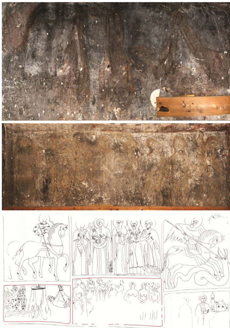
Fig. 7. - a) Detaliu cu primul grup de chinuiți de pe peretele de nord; în capătul lui se poate vag distinge preotul spânzurat de mâini și de picioare. b) Detaliu cu grupul de opt chinuiți din cea de-a doua scenă din registrul inferior al peretelui de nord. c) Schemă iconografică a peretelui de nord, publicată de Cincheza-Buculei 1981, cu cele două scene anterioare semnalate în conturul autorului, 2015