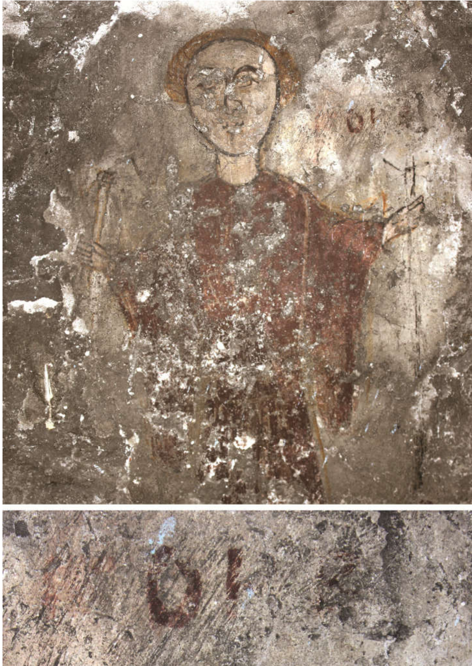
Fig. 6. - a) Detaliu al presupusului „orant” (© Anca Crișan, 2012). b) Detaliu al inscripției fragmentare care îl însoțește (© autorul, 2013)