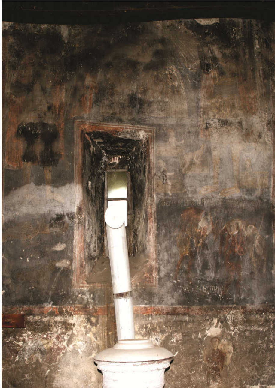
Fig. 3. - Partea dreaptă a peretelui de sud de la Leșnic. Pot fi observate, de sus în jos: Învierea Morților, fiarele care varsă trupurile celor devorați (în stânga ferestrei), cei doi cărauși (în dreapta ei), și presupusul „orant” (dedesubt)