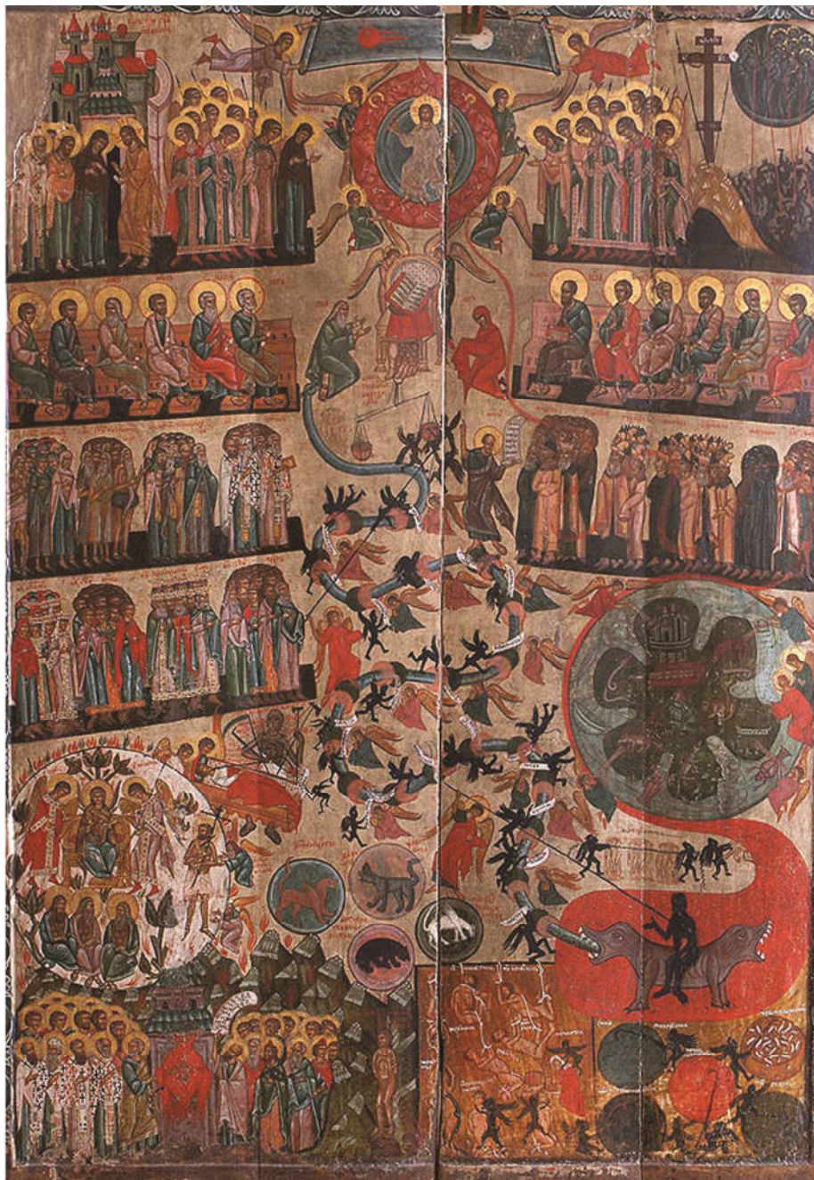
Fig. 10. - Icoana de la Mshanets, păstrată astăzi la Muzeul național din Liov.