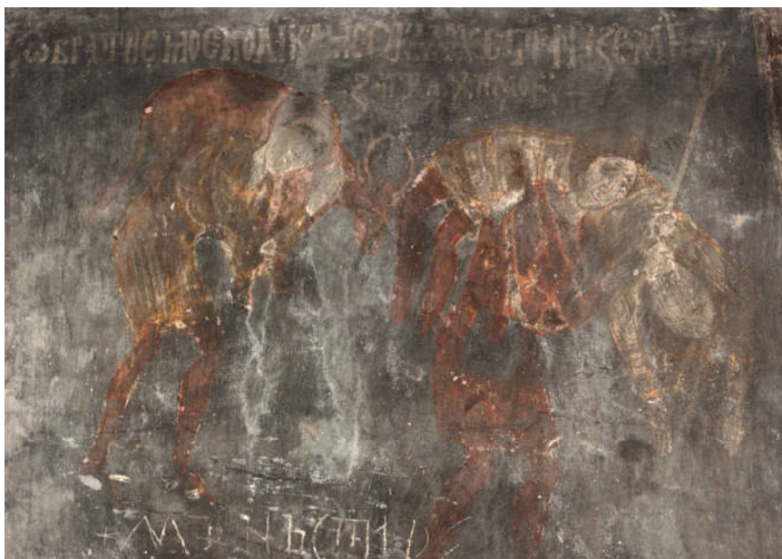
Fig. 4. - Detaliu al scenei celor doi cărauși