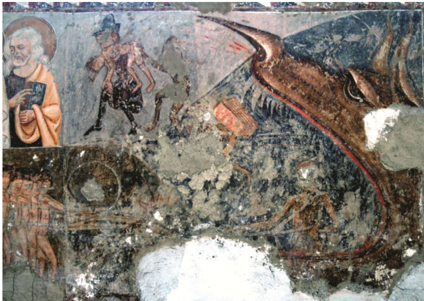
Fig. 8. - Detaliu din Judecata de Apoi de pe peretele de nord din biserica de la Mugeni: cărăușul care fuge din gura larg deschisă a Leviatanului (© Adrian Andrei Rusu, 2009)