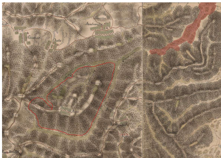
Fig. 1. - Alăturare a două planșe din Cartarea iozefină redând topografia munților de la sud de Leșnic la sfârșitul secolului al XVIII-lea. Limitele satului Leșnic sunt redate prin suprapunere de culoare. Conturul din stânga marchează limitele pădurii lui Dobre (prelucrare a autorului, 2015)