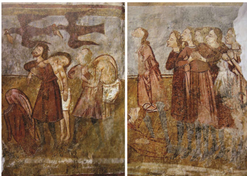
Fig. 9. - Două detalii din Judecata de Apoi de la Svinica (Slovacia): a) cărăușii; b) bocitorii (după Jékely et al. 2009, p. 358-359)