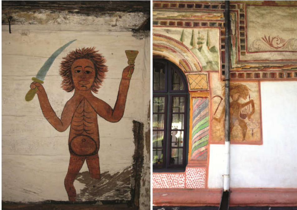
Fig. 11. - a) Moartea cu sabia și pocalul în picturile bisericii de lemn „Sfinții Arhangheli” de la Tăuți, com. Florești (jud. Cluj), c. 1829. b) Moartea cu coasa, pe fațada sudică, registrul inferior al bisericii „Sfinții Voievozi” de la Ionești (jud. Gorj), în 1836; după Zamora 2013, p. 101