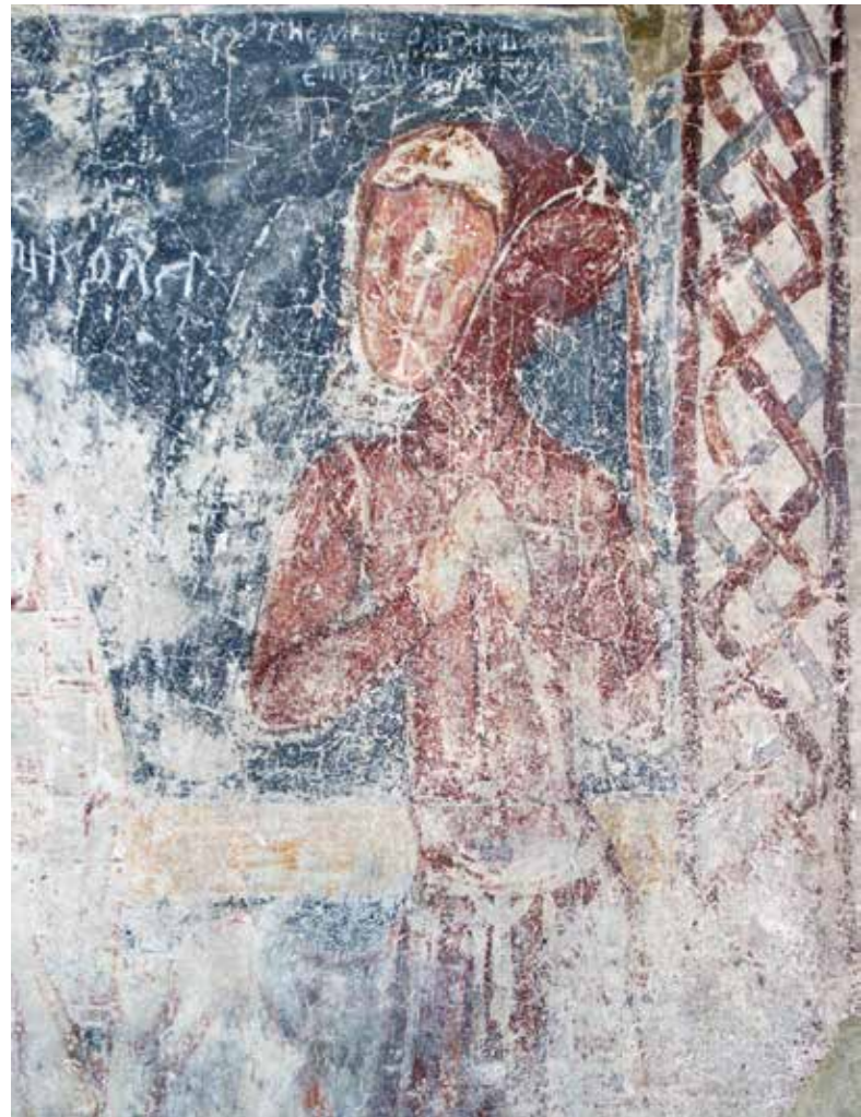
► Fig. 9. Sanctuaire de l'église de Strei. Suppliant du registre inférieur adressant ses prières à saint Nicolas.

ture du Trecento dans le Nord de l'Italie, saisissables dans la technique de la fresque, dans les yeux en amande, dans les bandeaux décoratifs, de tradition cosmatesque ». 17 Ayant vu les peintures trecentesques de l'Italie du Nord, ces considérations me paraissent arbitraires. Je crois que les peintures de Strei sont simplistes, qu'elles suivent la vague du gothique international 18 et que les deux scènes attribuées au deuxième peintre témoignent plutôt d'une série de particularités qui ne se trouvent pas en Italie. J'y reviendrai.