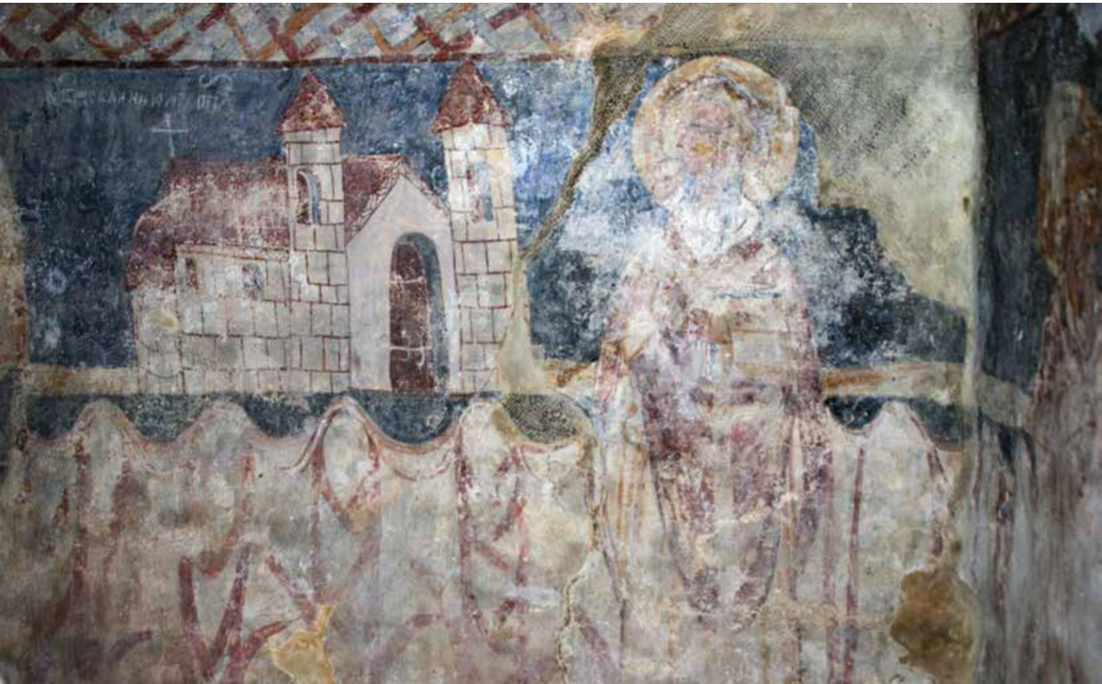
▲ Fig. 42. Sanctuaire de l'église de Strei. Détail de la représentation de saint Callinique.