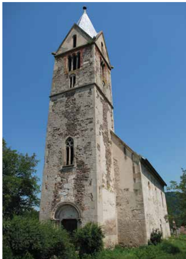
◄ Fig. 1. Église de Strei. Vue extérieure depuis le nord-ouest.

Il faut ajouter également une observation formulée par E. Cincheza-Buculei, avec laquelle je suis relativement d'accord. Elle a étudié six (ou sept) représentations de sup-