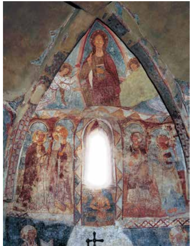
▲ Fig. 35. Sanctuaire de l'église de Strei. Le cortège des apôtres sur la paroi est. De gauche à droite : Jacques le Majeur, Paul, Pierre et Jean l'Évangéliste.

Cela dit, le Colloque, en rapport avec une Maiestas Domini , évoque deux autres thèmes plus connus : les assesseurs pour le Jugement dernier (dans un Tribunal immobile des apôtres) 51 et les spectateurs de l'Ascension (qui regardent le Christ). En effet, lorsqu'on est en présence de colonnes et d'autres modèles architecturaux, il est judicieux d'évoquer la Jérusalem céleste de l'Apocalypse. 52 En traitant l'iconographie des peintures murales du Trentin et du Tyrol, H. Stampfer et Th. Steppan considèrent que l'apparition des apôtres sous le registre supérieur de la Maiestas Domini fait référence à la Jérusalem céleste. 53 Cette connotation est héritée d'une tradition ancienne. Les apôtres en siège apparaissent sur la mosaïque de la basilique Sainte-Pudentienne à Rome (début du V e siècle), où ils représentent