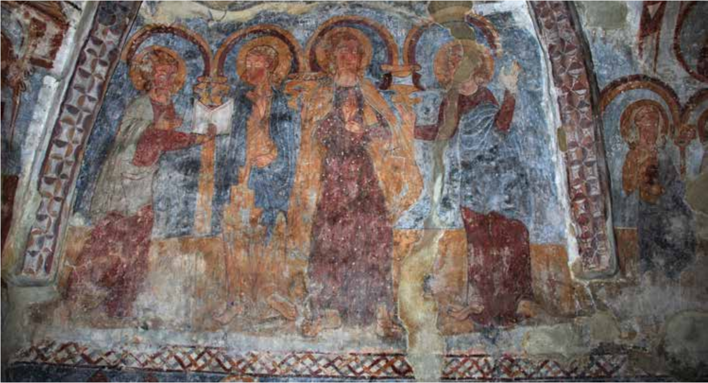
► Fig. 7. Sanctuaire de l'église de Strei. Le cortège des apôtres et des saints sur la paroi Nord. De gauche à droite : deux saintes impératrices, quatre apôtres non identifiés, la Vierge Marie ; et deux apôtres sur la paroi est : Jacques le Majeur et Paul.