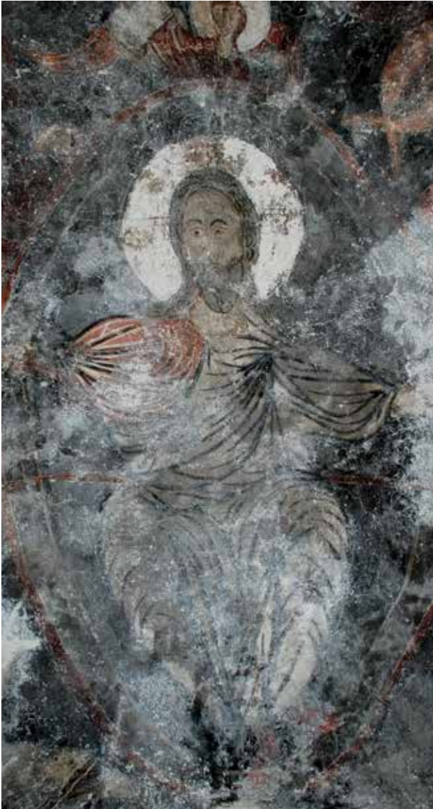
◀ Fig. 10. Église de Streișangeorgiu. Vue d'ensemble des peintures du sanctuaire.