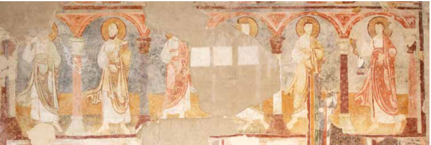
▲ Fig. 26. Paroi nord de l'église de Pozzoveggiani. Le premier cortège d'apôtres.