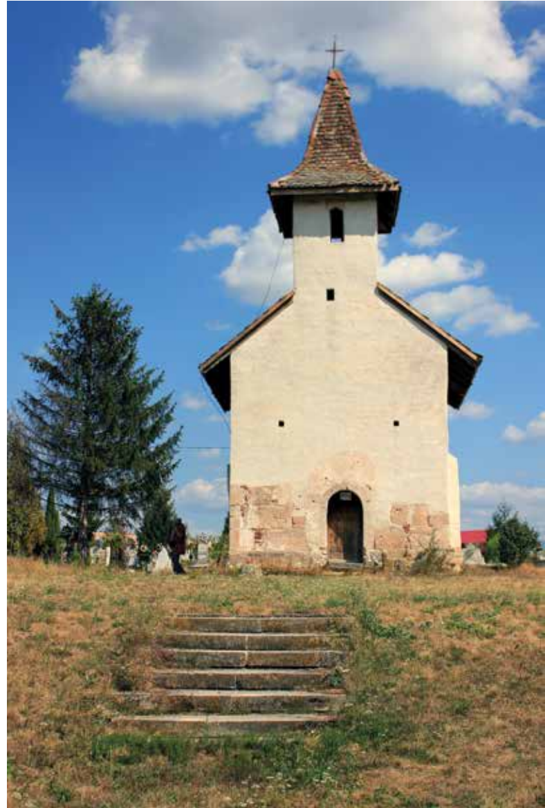
▼ Fig. 12. Église de Streișangeorgiu. Vue extérieure depuis l'ouest.

peu de peintures du xiv e siècle, dont le style n'a pas de rapports avec celui des peintures de Strei. 19 Je ne suis donc pas convaincu par la démonstration 'dalmate', ni par sa continuation, proposée par V. Drăguț dans un article ultérieur, qui ressemble à un récit de fiction. 20 Quant au portrait (ou autoportrait) du peintre du sanctuaire, évoqué parfois comme un écho du même Trecento , 21 je ne suis pas certain que l'inscription ait été bien lue et je ne suis pas non plus convaincu que le personnage peint dans le sanctuaire soit un peintre. Les rapports entre le prétendu 'Grozie' et le maître 'Ivanich' de la même inscription ne sont pas clairs, de même que le nom de 'Grozie', bien que j'accepte en dernier lieu d'utiliser cette lecture du nom propre par souci