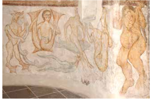
▼ Fig. 34. Sanctuaire de l'église de Pozzoveggiani. Décoration du registre inférieur.

débout, entre des colonnes, sous des arcades, et les apôtres ne discutent plus ; ils regardent tous vers le Christ. La signification de la théorie d'apôtres a donc changé. L'absence des gestes est déterminée par la présence du Christ. Elle se traduit en un sens différent pour cette scène. Cela permet de supposer que le thème que nous suivons a évolué de manière différente d'une représentation à l'autre. Ce regard commun de tous les apôtres de Summaga vers le Christ accentue le rapport avec l'Ascension et la Pentecôte, tout en gardant le sens du Jugement dernier. À Termeno, lorsque saint Pierre regarde, en revanche, la Maiestas Domini , il le fait parce qu'il évoque quelque chose à son partenaire qui est peint de l'autre côté de la baie de la fenêtre axiale et qui tient sa main dirigée vers sa bouche (Fig. 22 et 23). 44 Les raisons des deux regards sont différentes. Le regard de Termeno correspond plus au doigt que saint Paul lève vers la Maiestas Domini de Strei qu'aux regards de Summaga. Le regard de Termeno et le doigt de Strei indiquent le sujet de la conversation.