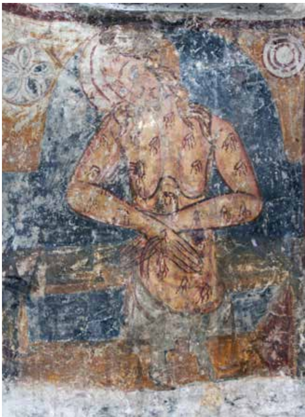
▲ Fig. 13. Sanctuaire de l'église de Strei. Christ de pitié sous la fenêtre axiale.