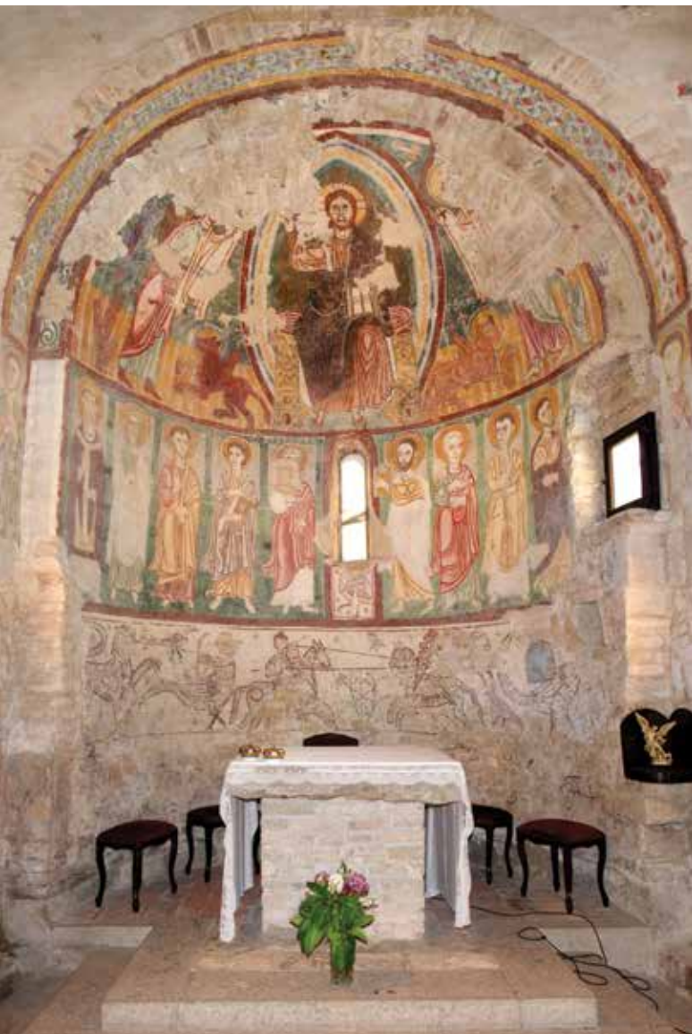
▼ Fig. 27. Église de Pozzoveggiani. Vue d'ensemble des peintures du sanctuaire.

variation –, il est évident que chaque personnage témoigne d'une position unique, qu'il exprime un message particulier et qu'il est en train de dialoguer avec un autre pour défendre son opinion. Cependant, il est improbable que les peintures de Strei soient inspirées par celles du sanctuaire italien. L'écart chronologique et géographique est trop important. Qui plus est, l'arc triomphal de Termeno porte le sacrifice de Caïn et Abel, et non pas l'Annonciation. Les rapports entre les programmes iconographiques des deux églises sont infimes.