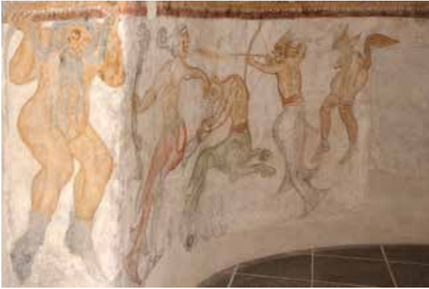
▲ Fig. 32-33. Sanctuaire de l'église de Termeno. Décoration du registre inférieur. Cliché de l'auteur.