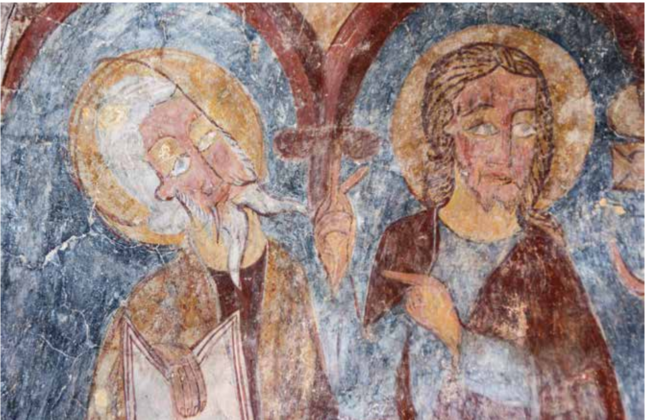
▼ Fig. 17 Sanctuaire de l'église de Strei. Détail de la conversation des deux premiers apôtres anonymes de la paroi nord.