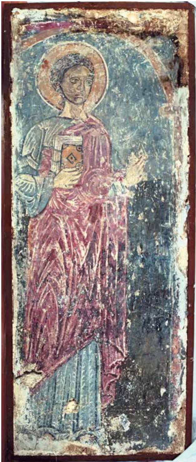
▲ Fig. 49. Fragment de peinture de l'église Saint-Martin de Deva, aujourd'hui dans les collections du Musée de la civilisation dace et romaine de Deva (comté de Hunedoara).