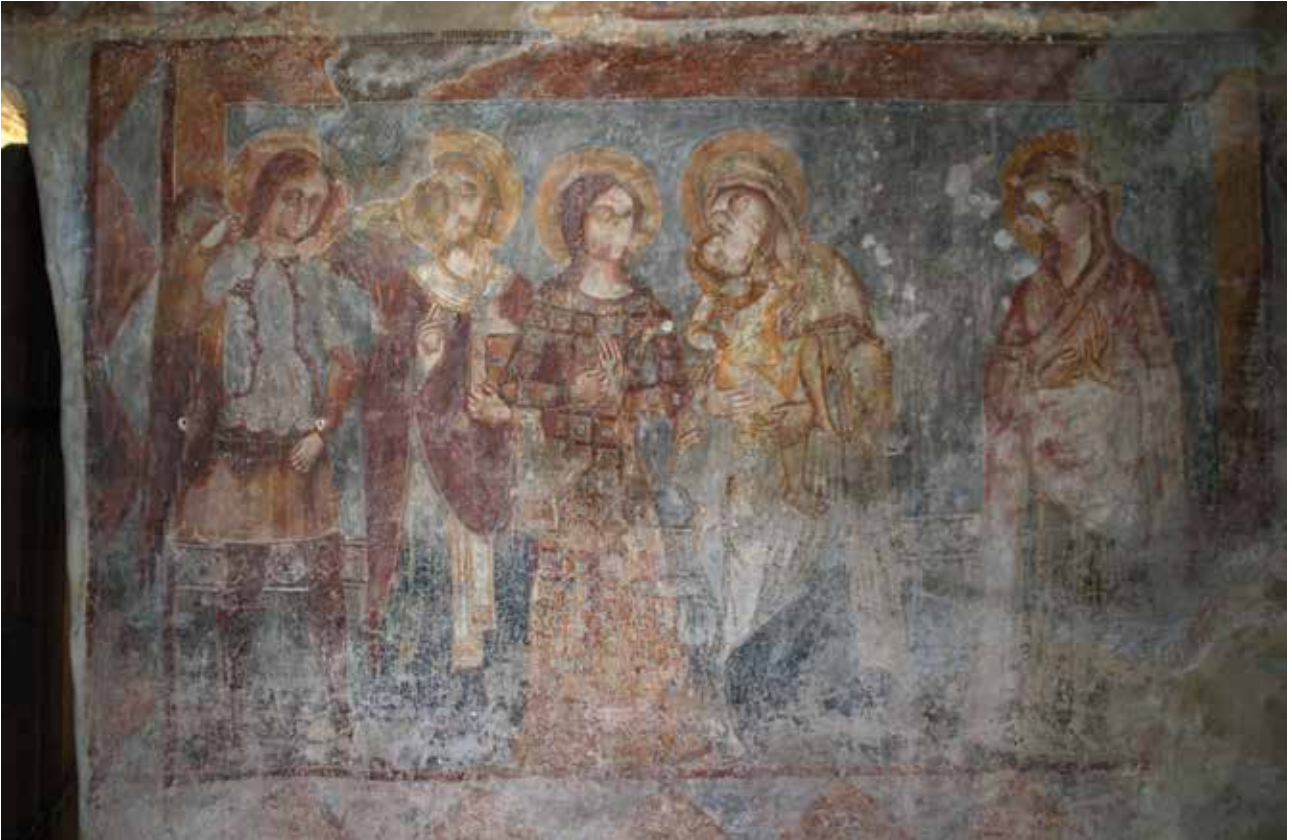
▲ Fig. 16. Église de Strei. Peintures de la nef. Vue d'ensemble de la seconde composition attribuée au deuxième peintre (un archange, un saint évêque, sainte Dimanche, la Vierge de Tendresse et une sainte non identifiée).