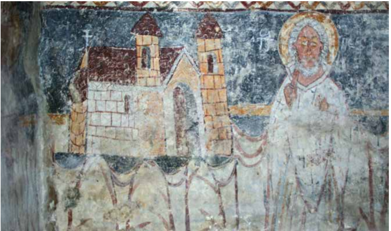
▼ Fig. 43. Sanctuaire de l'église de Strei. Détail de la représentation de saint Pierre.