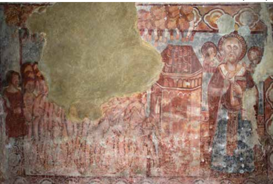
▲ Fig. 45. Paroi Sud de la même nef. Détail de la tentative de portrait pour le personnage profane.