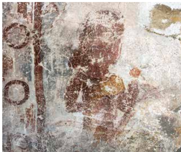
▼ Fig. 3. Église de Strei. Détail du bâtisseur peint dans l'intrados de l'entrée sud. Cliché de l'auteur.