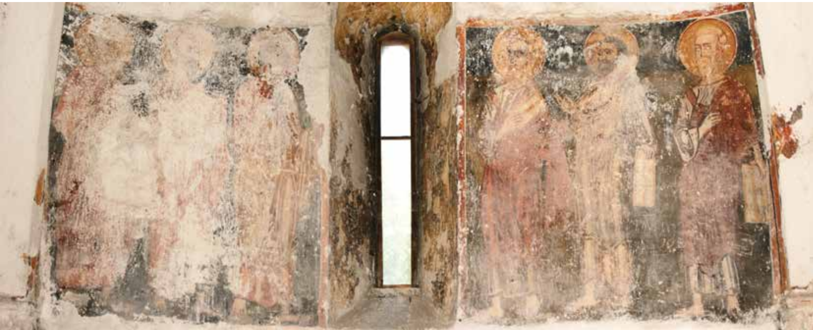
▲ Fig. 52. Sanctuaire de l'église de Sântămărie Orlea. Le cortège des apôtres sur la paroi Est.

de la mort de Pauper Paulus me semblaient renvoyer dans la même direction. Je ne reprends pas ici la trop longue argumentation de 2014, mais je me permets d'insister sur la question de la barbe du mystérieux Pauper Paulus – un attribut qui me permettait d'identifier ce Paul avec un frère mendiant ayant pu servir de prêtre local. Il y avait des cas similaires en Transylvanie, tel Petrus plebanus , un personnage barbu et tonsuré peint dans le sanctuaire de Cisnădie. Et les explications étaient simples : les solitarii et praecipue illi qui sacra mysteria contrectant étaient dispensés du barbirasium . 152 Cela dit, mon ancienne persévérance dans l'analyse de la barbe pouvait sembler ridicule en 2014, mais elle ne l'est désormais plus : la lettre papale du 1 er juillet 1373 s'adressait aux Observants qui vivaient parmi les Wlachi scismatici du royaume de Hongrie et qui recevaient le droit de bâtir six églises où ils pouvaient rester pour servir de prêtres pour les communautés valaques. Pauper Paulus pourrait être l'un de ces prêtres, dans la mesure où il s'occupait d'un périmètre plus large comme le Pays du Hațeg, la Vallée du Mureș et d'autres parties du comté de Hunedoara. Le fait que l'église de Strei soit une copie à échelle réduite de celle de Sântămărie Orlea ne fait que souligner pour une énième fois les rapports évidents entre les deux monuments, des rapports réciproques.