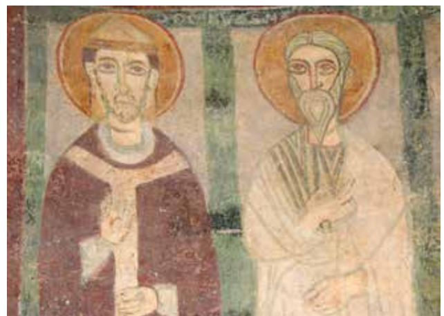
► Fig. 28-31. Sanctuaire de l'église de Pozzoveggiani. Apôtres en train de discuter.