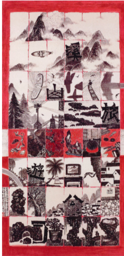
Ill. 1 Hommage à « Voyageurs par monts et rivières » de Fan Kuan n°5 (溪山行旅 Xi shan xing lü)(2000 ; 137 x 69 cm).

Lo Ch'ing nous invite ainsi à reconsidérer la relation entre homme et nature aujourd'hui. Ces aspects de la vie contemporaine nous séparent-ils de la nature ou nous en rapprochent-ils ? En quoi notre expérience diffère-t-elle de celle des montagnards de Fan Kuan ? Sans doute l'artiste veut-il opposer la sérénité d'autrefois, qui permettait de s'imprégner et de se ressourcer dans la nature, au chaos contemporain d'une vie fragmentée, entrecoupée. Cette existence trépidante laisse-t-elle le temps de méditer et d'évoluer à son aise (遊 you ) dans un paysage ? Peut-on « réactiver sa tension vitale » lorsqu'on se livre à des voyages effrénés (旅遊 lüyou ) ? Ces œuvres suggèrent que nous sommes sans cesse en mouvement, et que l'excessive mobilité et le culte de la vitesse propres à notre époque « post-industrialisée » modifient notre perception de la nature et notre rapport au monde.