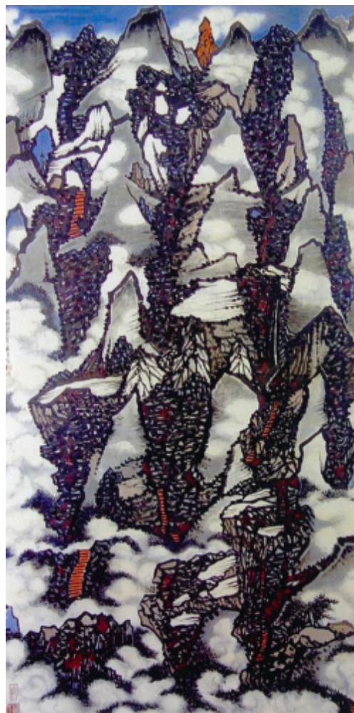
III. 2 Dix mille ravins et nuages auspicioseux ( 萬壑祥雲 Wanhe xiangyun ) (1997 ; 137 x 69 cm).

pans rocheux plus clairs, résultent d'un travail du pinceau précis et maîtrisé, rehaussé de quelques couleurs : bleu de la mince bande de ciel qui apparaît tout en haut, rouge carmin des feuillages, ocre des escaliers. Les rochers s'empilent en des entrecroisements de plans complexes pour former une composition dynamique. Le cheminement à travers les montagnes est matérialisé par un escalier, élément inhabituel dans les peintures classiques, réapparaissant de loin en loin et attirant l'attention du spectateur. Comme toujours chez Lo Ch'ing, aucun lettré ni aucun paysan n'est représenté ici, mais l'escalier suffit à évoquer une présence humaine.