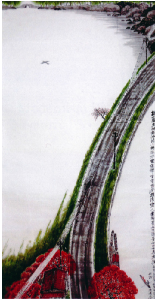
Ill. 5 Vignes desséchées, vieux arbres et route d'asphalte ( 枯藤老樹柏油路 Ku teng laoshu boyoulu ) (2011 ; 179 x 96 cm).

Et nous devons payer le taxi de nos vies