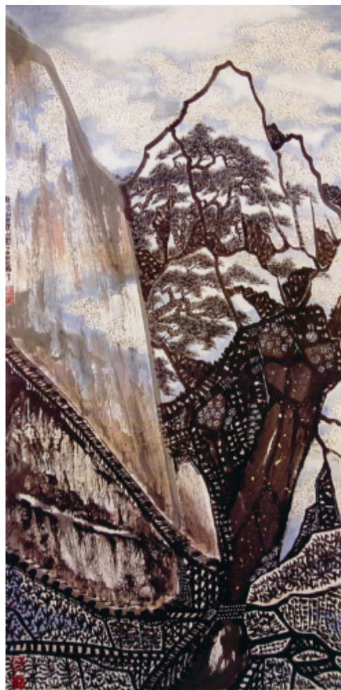
Ill. 3 Les rails de chemin de fer jaillissent des montagnes (鐵軌出岫圖 Tiegui chu xiu tu )

Le contraste entre le paysage sauvage et l'irruption de la technologie, qui se retrouve souvent sous