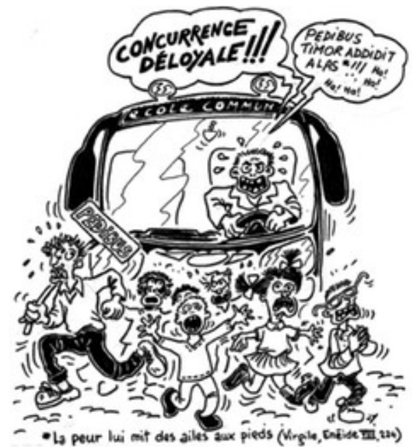
Le Pédibus, une solution alternative à l'automobile. Joël Yerpez

Au-delà de ces réserves qui marquent la littérature scientifique, il faut voir que le déploiement des Pédibus reste marginal et difficile à pérenniser. En plus d'être essentiellement présentes dans les quartiers favorisés, la plupart des lignes de Pédibus n'excéderaient pas deux ans. Quand certaines