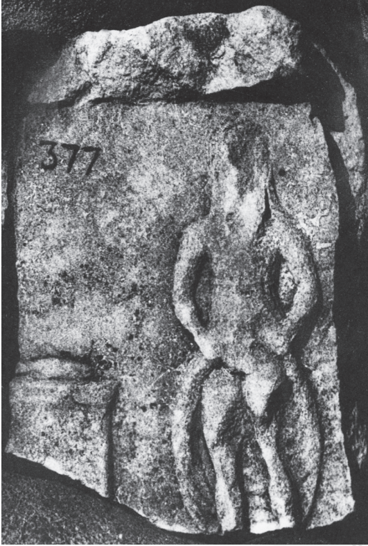
Fig. 3. Bas-relief représentant Priape et un autel au poisson (Musée de Smyrne, Izmir, Inv.Nr:377) (cl. Robert & Robert 1950, pl. V).

connue pour ces colias 70 , poissons de la famille des scombridés (thons 71 ou maquereaux 72 ). Ils sont présentés par Pline l'Ancien 73 comme les plus petits des lacerti , " lacertorum minimi ". Ce terme désignait des poissons qui étaient salés et découpés 74 . Ainsi, la position de Parion dans le détroit de Dardanelles, lieu de passage obligatoire pour les poissons migrateurs comme les scombridés, a pu jouer un rôle dans l'affermage de zone de pêche, probablement en vue d'approvisionner des ateliers à salaisons.