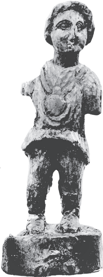
Fig. 6. Statuette en bois de Priape découverte dans l'épave Planier 1 , Marseille (haut. totale : 35 cm) (Musée des Docks Romains, Marseille, inv. 188 – dessin vectorisé en DAO d'après les clichés du CCJ, CNRS, in : L'Hour 1984).

Plusieurs villes portuaires ont livré des témoignages du culte priapique, par exemple Pompéi (Italie) 78 , Baelo Claudia (Espagne) 79 , Marseille (Bouches-du-Rhône) 80 ou Lattes (Hérault) 81 . Sa présence ne peut en aucun cas être rattachée assurément aux activités de pêche. Priape, présenté comme le dieu des ports et des rivages dans la littérature antique, protégeait tous les navigateurs, ainsi qu'un certain nombre de corps de métiers qui étaient certainement présents dans ces villes.