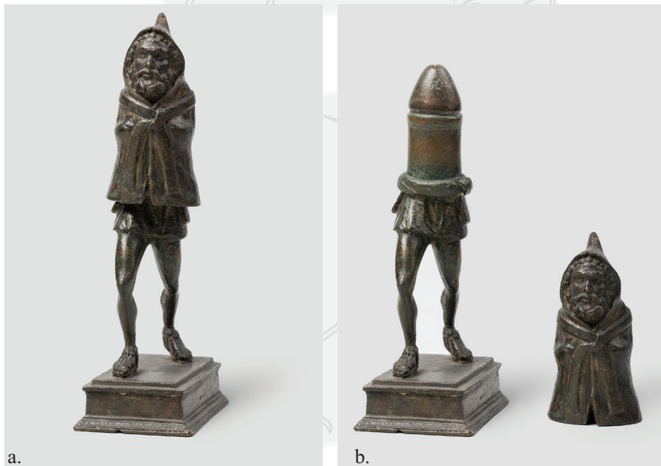
Fig. 1. Statuette en bronze de Priape découverte à Rivery (Somme) (a.) (haut. : 18 cm ; long. socle : 9,2 cm ; larg. socle : 5,3 cm). La partie supérieure est amovible de manière à laisser apparaître un phallus (b.) (collection du musée de Picardie, Amiens, n° inv. M.P.1876-477).

À ce titre, les représentations de ce phallus et les trouvailles archéologiques (peintures, amulettes, statues) mis au jour depuis le XVIII e siècle ont participé à alimenter un préjugé tenace qui est en contradiction avec les attributs réels du dieu. À l'image des "franges de cheveux sur le front" mises en exergue par R. Barthes dans ses Mythologies 38 , les coiffures, les habits, l'architecture