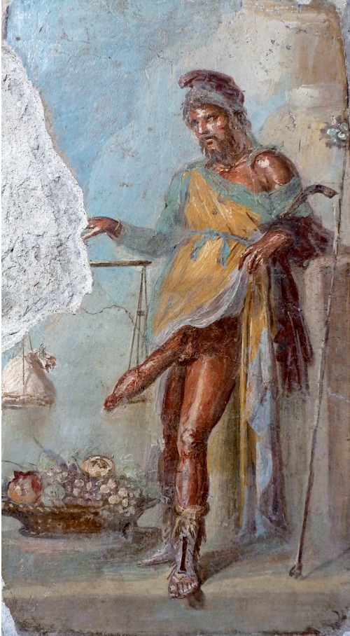
Fig. 2. Priape de la maison des Vettii à Pompéi (VI, 15, 1) avec sa triple attribution : prospérité financière (bourse), fertilité et abondance dans les jardins et les vergers (fruits) et protection contre le mauvais œil (phallus).

ou encore des attitudes particulières sont autant de signes de romanité dans l’imaginaire commun. Parmi eux, la débauche et l’idée d’une dépravation sans limite restent encore fort ancrées. La figure de Priape et son phallus en érection a alimenté cette perception d’une société romaine composée de “chauds latins” 39 . Si les représentations de la divinité n’étaient pas détruites ou détériorées, elles occupaient une place de choix dans les alcôves secrètement gardées à l’image du cabinet secret du Musée archéologique de Naples 40 . Actuellement, la présentation de ces œuvres est publique. Mais, la débauche comme signe de romanité est encore bien présente, véhiculée principalement par le média audiovisuel 41 et la bande-dessinée 42 . À partir des années 60, la représentation de l’Antiquité est devenue un prétexte pour des mises en scène érotiques voire pornographiques. Cette vision s’inscrit dans un contexte de libération des mœurs, faisant du film à l’antique un miroir de la société et de ses évolutions 43 .