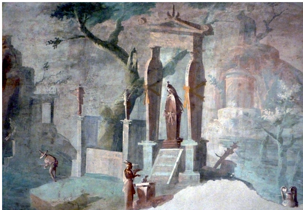
Fig. 4. Peinture murale de l' Ekklesiasterion du Temple d'Isis à Pompéi (VIII, 7, 28) (Musée archéologique de Naples).