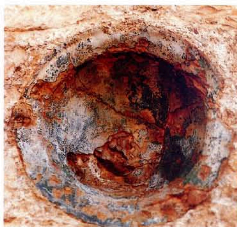
Bacini au-dessus de la porte occidentale de Saint-Véran à Utelle (Alpes-Maritimes).