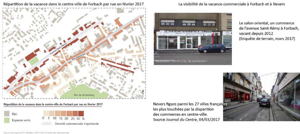
Figure 2. La vacance commerciale, un marqueur de la dévitalisation du centre-ville : l'exemple de Forbach et de Nevers.

27 La vacance des logements est également manifeste dans les trois villes étudiées. À Vichy (figure 3), si le taux de vacance des logements communal de 21 % (l'un des records enregistrés par le rapport de l'IGF et du CGEDD) varie de 10 à 26 % du parc selon les IRIS en 2013, le centre-ville, qui concentre les logements anciens de la ville, est l'un des quartiers les plus touchés par ce phénomène. Nevers fait également partie des villes moyennes françaises où le taux de vacance des logements est le plus élevé (17 % en 2013) et les enjeux autour du traitement de l'habitat indigne sont particulièrement concentrés dans le centre-ville.