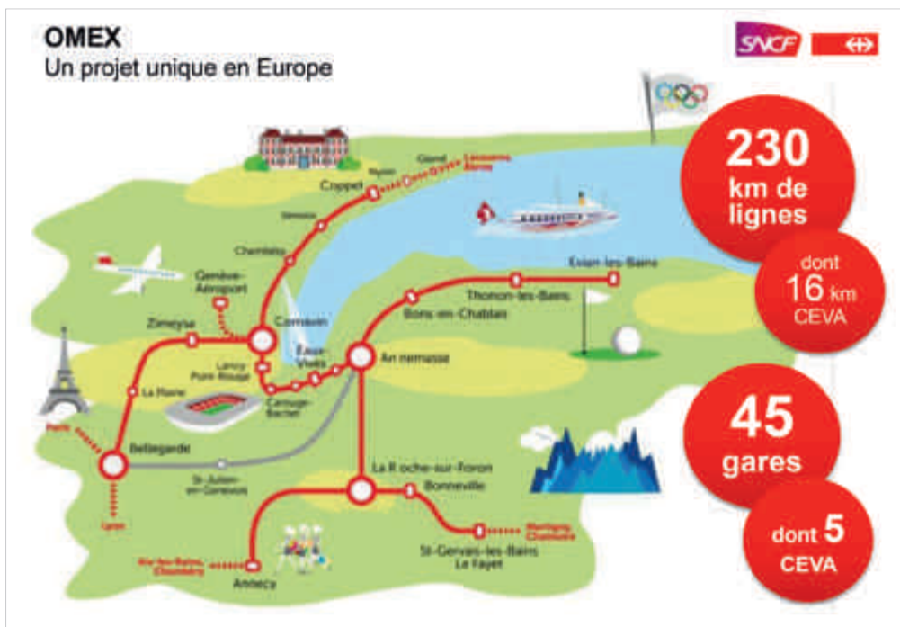
← [4] Le Léman Express

Le Léman Express est un projet extrêmement ambitieux puisqu'il sera, à son inauguration prévue 11 le 8 décembre 2019 12 , le plus grand réseau ferroviaire régional transfrontalier d'Europe. Il concerne en tout 230 km de lignes ferroviaires, mais surtout un maillon central en tunnel de 16 km dont 2 km en France (et donc 14 km en Suisse), 45 gares en France et en Suisse (dont 5 CEVA, 4 étant des gares nouvelles souterraines dans Genève le long d'une tranchée couverte de 4,5 km). Deux tunnels de 2 024 m (Pinchat) et 1 470 m (Chample) ont été construits, avec tout un réseau de puits d'accès et de sorties de secours. Côté matériels roulants, 40 trains ont été produits en France (Alstom) et en Suisse (Stadler) avec une charte graphique unique. Le Léman Express repose sur un service à forte fréquence en heures de pointe (6 trains par heure et par sens prévus entre Annemasse et Genève Cornavin, l'axe central du réseau). Une cadence à la demi-heure est prévue entre Évian-les-Bains, Annecy, Saint-Gervais les Bains, Annemasse, Bellegarde jusqu'à Coppet en Suisse.