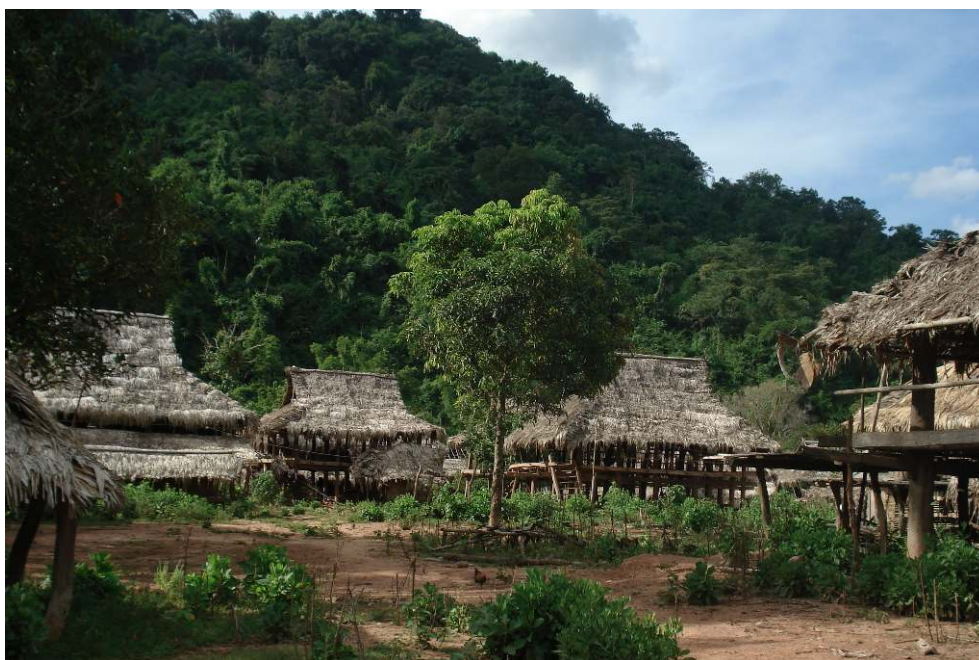
Photo 3. Un village abandonné de la région de Nyot Ou.

Fait de bois, de bambou et de feuilles, les villages sont assez facilement déplaçables quand le besoin s'en fait sentir (guerre, incendies, recherche de terre) ou, comme c'est le cas pour ce village, sur injonction des autorités du district pour se réimplanter en bord de route, malgré l'avis des habitants.