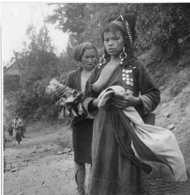
Photo 1. Femme Akha Nouheu, région de Phongsaly, vers 1950.