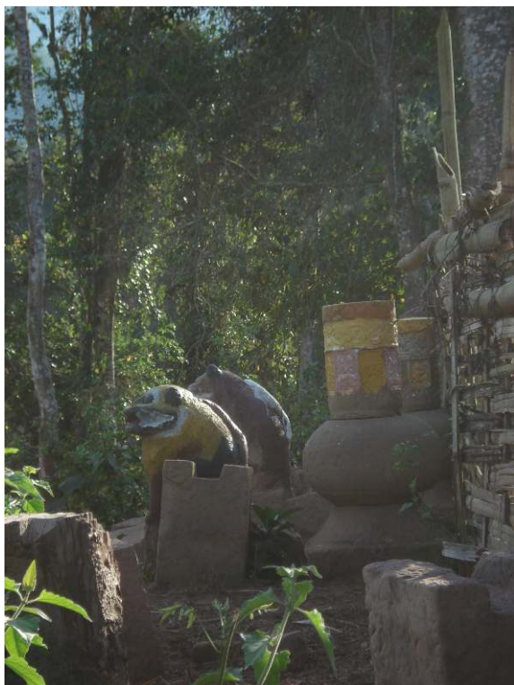
Photo 5. Les ruines d'un temple Tai Lü dans le district de Nyot Ou.

« Le paysage qui nous entoure est désert. À peine devine-t-on à flanc de coteau, de l'autre côté de la vallée, l'emplacement d'un ancien ray, déjà reconquis par une brousse épaisse. Ces régions ont cependant vu se succéder sans doute, depuis des siècles, de nombreuses agglomérations. Mais ici les hommes passent sans laisser le moindre écrit, le moindre signe sur une pierre et, tel que des ombres sur un mur, il ne reste rien de leurs pistes à peine visibles, de leurs cabanes croulantes, de leur agriculture primitive » écrivait Guillemet (1921 : 240) à propos de la région de Phongsaly. Les rares traces visibles du passé sont le fait des populations Lao et Tai Lü.