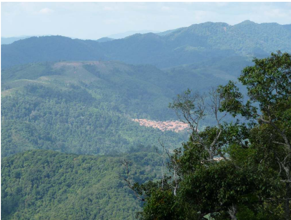
Photo 4. Un village d'essarteurs Akha du district de Boun Tai.

Ce village perdu dans la forêt rappelle que la région de Phongsaly fut durant longtemps faiblement peuplée. Avec l'augmentation de la pression démographique, des regroupements de villages le long des axes routiers et le développement des cultures commercial, cette photo ne sera bientôt qu'un souvenir.