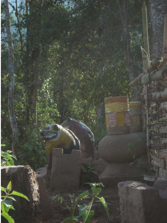
Photo 5. Les ruines d'un temple Tai Lü dans le district de Nyot Ou.

« Le paysage qui nous entoure est désert. À peine devine-t-on à flanc de coteau, de l'autre côté de la vallée, l'emplacement d'un ancien ray, déjà reconquis par une brousse épaisse. Ces régions ont cependant vu se succéder sans doute, depuis des siècles, de nombreuses agglomérations. Mais ici les hommes passent sans laisser le moindre écrit, le moindre signe sur une pierre et, tel que des ombres sur un mur, il ne reste rien de leurs pistes à peine visibles, de leurs cabanes croulantes, de leur agriculture primitive » écrivait Guillemet (1921 : 240) à propos de la région de Phongsaly. Les rares traces visibles du passé sont le fait des populations Lao et Tai Lü.