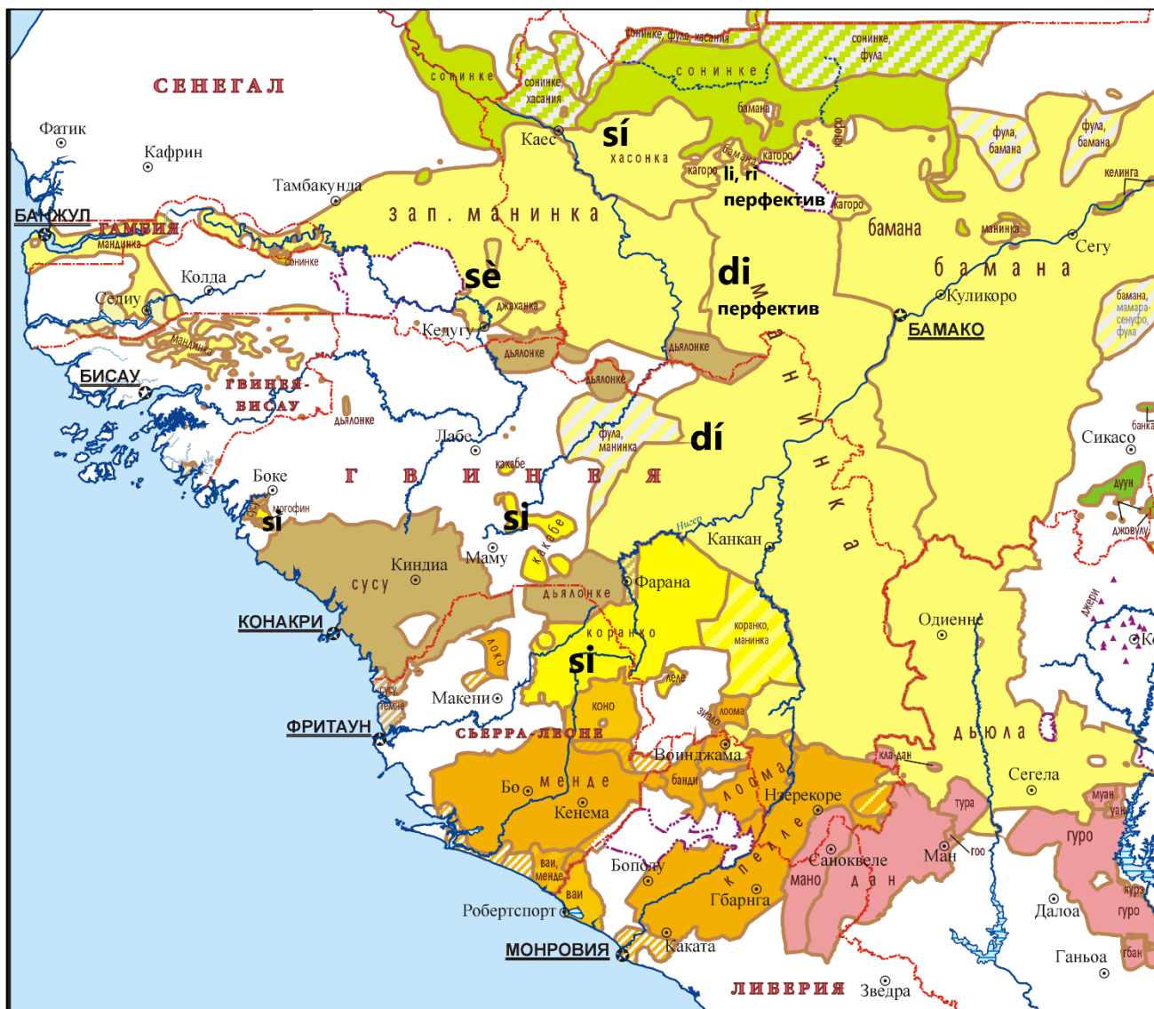
Рис. 1. Распределение показателей будущего и сходных с ними показателей переходного перфектива в языках манден и моколе

Географическое распределение всех этих показателей представлено на рис. 1.