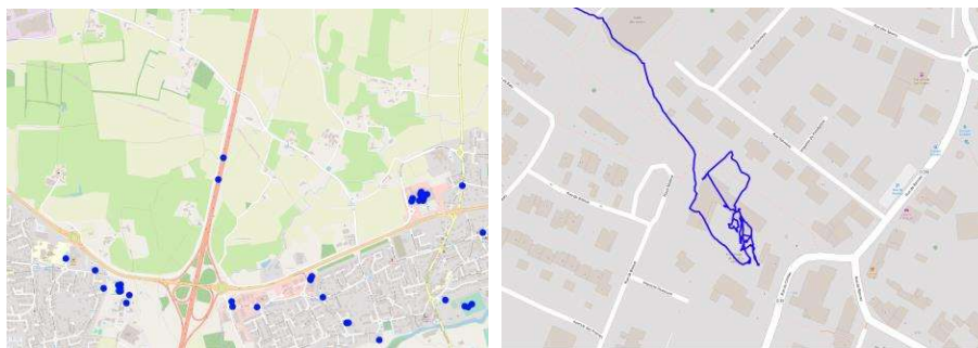
FIGURE 3. Faux lieux sur l’autoroute (à gauche) et faux trajet à l’école (à droite).

lorsque l’amplitude spatiale des déplacements est réduite (domicile proche de l’école ou au-dessus d’un centre commercial). La multitude de situations contribue ainsi à générer des faux positifs ou négatifs (Fig.3) : par exemple des arrêts détectés sur des autoroutes en raison de bouchons ou encore des trajets au sein de lieux (domiciles, écoles) voire de « grands lieux » (centre commerciaux, parcs, cimetières).