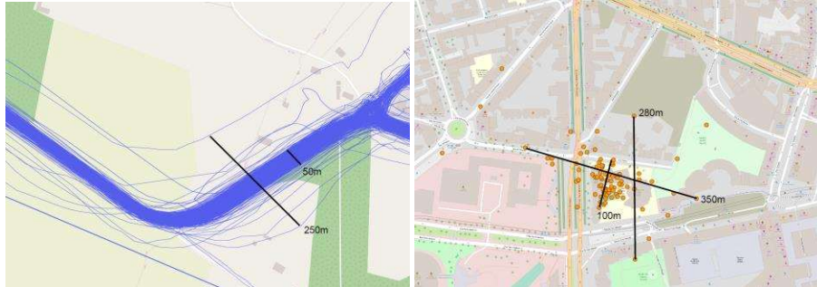
FIGURE 5. Imprécision des trajets à l’entrée d’Orgères (à gauche) et des lieux associés à l’une des écoles (à droite).