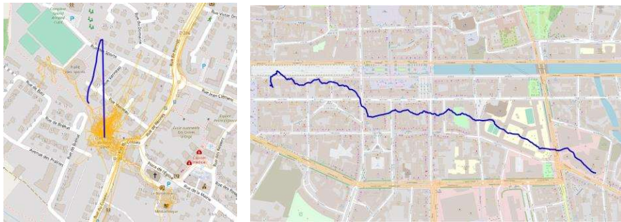
FIGURE 2. Effet de la perte momentanée du signal satellite (à gauche), effet de canyon urbain et décalage de la trace (à droite).

(TTFF), le déchargement de la batterie, la mise en veille ou la défaillance de l'accéléromètre. Ainsi, le TTFF peut conduire à la perte d'informations entre le début d'une mobilité (où le datalogger est en veille due à une immobilité prolongée) et l'enregistrement des positions une fois le signal GPS actif. Un autre ensemble d'erreurs relève des limites techniques du dispositif selon les environnements pratiqués par les enquêtés (Fig.2) : perte de signal à l'intérieur des bâtiments ou dans le métro, nombre insuffisant de satellites captés, réverbération des signaux lors « d'effets de canyon urbain ». Ce type de cas génère des positions GPS aberrantes qui se répercutent sur les trajets : traces décalées ou hors du réseau routier, vibrations et sinuosités, formes rectilinéaires, etc.