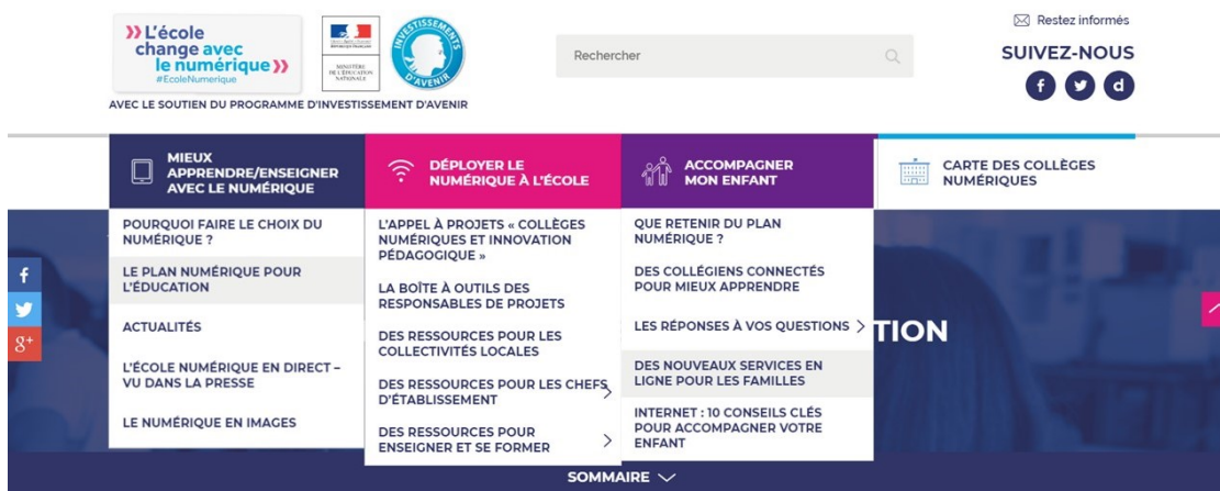
Figure 1. Page d'accueil et onglets

Dès le bandeau de la page d'accueil du site, une mise en réseau du discours à travers les différents réseaux parents par des boutons cliquables et des technomots précédés d'un hashtag s'observe.