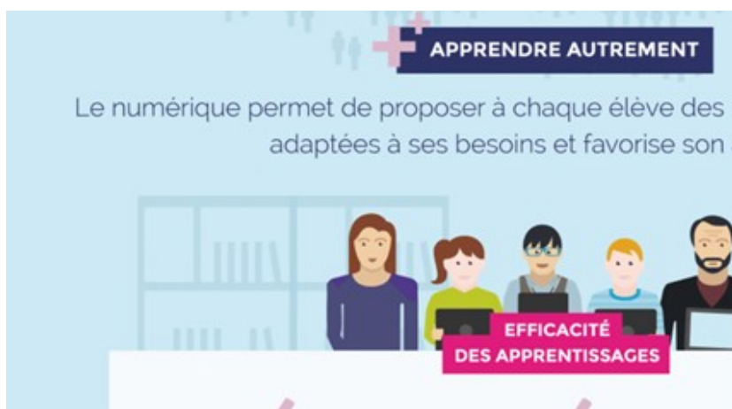
Figure 2. Infographie à caractère didactique

La didacticité transparait notamment dans des infographies qui à l'aide de mots-clefs et pourcentages viennent défendre l'idée d'un numérique source inépuisable d'avancées pédagogiques.