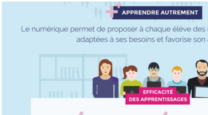
Figure 2. Infographie à caractère didactique

Une volonté de validité scientifique semble poindre, pourtant rien de ce qui est annoncé n'est justifié ou étayé de références, les pourcentages ne sont pas expliqués, tout est hors contextes.