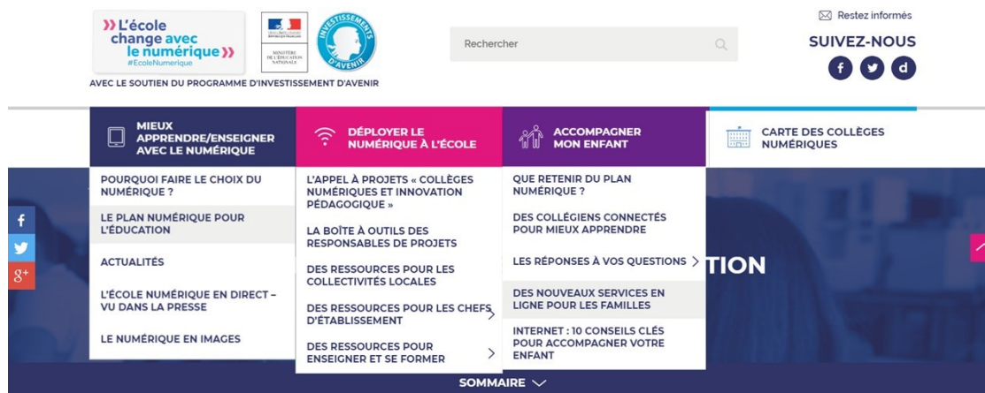
Figure 1. Page d’accueil et onglets

Dès le bandeau de la page d’accueil du site, une mise en réseau du discours à travers les différents réseaux parents par des boutons cliquables et des technomots précédés d’un hashtag s’observe.