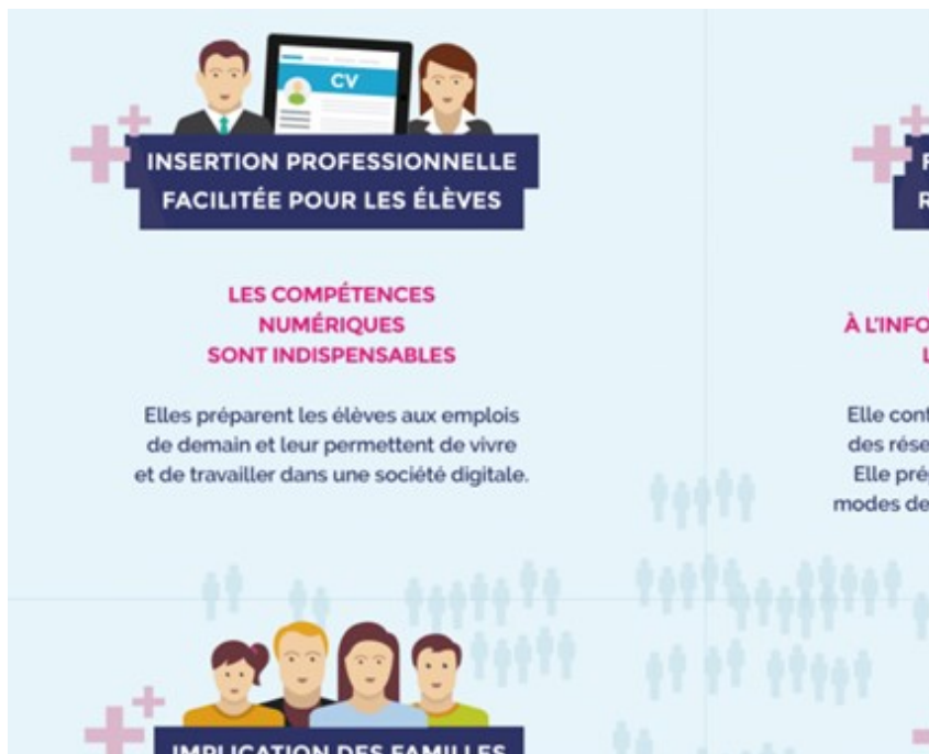
Figure 3. Infographie à caractère didactique

Une volonté de validité scientifique semble poindre, pourtant rien de ce qui est annoncé n'est justifié ou étayé de références, les pourcentages ne sont pas expliqués, tout est hors contextes.