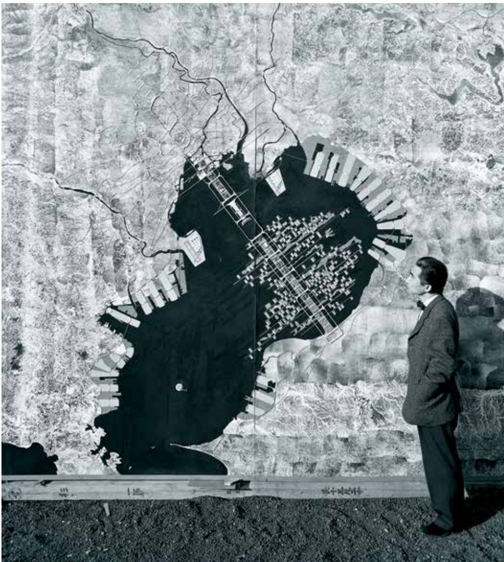
Kenzo Tange montrant son projet Tokyo Bay (1960).

comme ça que tout a commencé. Pour la première proposition, il n’y avait rien qui ressemble de près ou de loin à un édifice construit, il y avait seulement un axe 6 .” Quant à Kurokawa, il désirait développer des formes plus “organiques”, mais sa manière de dessiner n’était pas conforme à ce qu’attendait son professeur : “Lorsque Tange me donnait un croquis sur lequel il avait tracé une ligne droite, je me mettais à la déformer avec des courbes et à la décomposer en cellules puis, lorsque je lui rendais le dessin, il retraçait une ligne toute droite ; on a eu l’occasion de répéter ce processus de nombreuses fois 7 .”