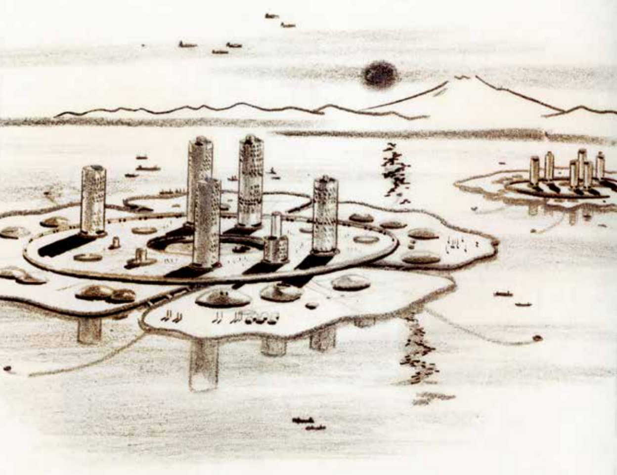
Marine City 1963, Kiyonori Kikutake arch.