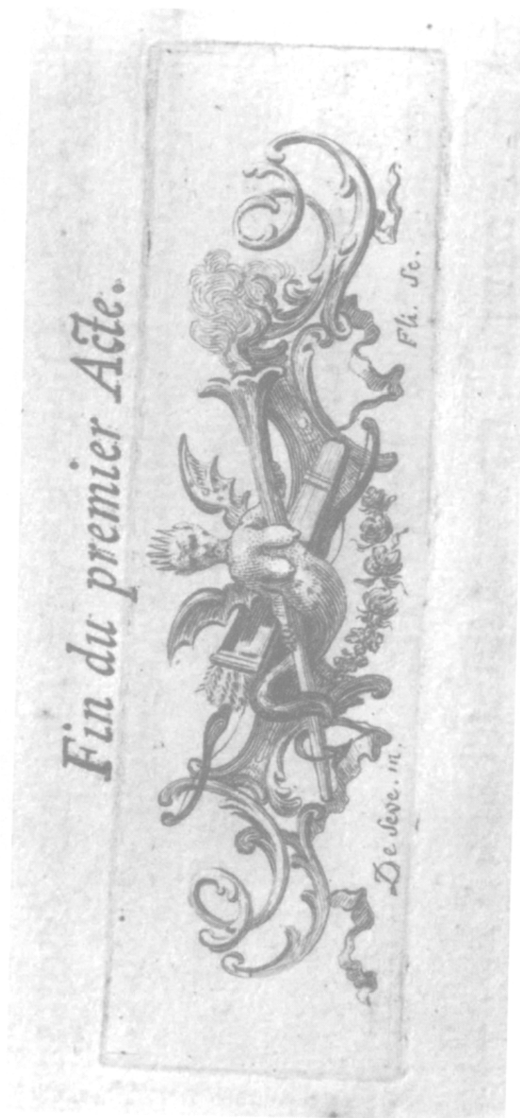
Phèdre , cul-de-lampe acte I, gravure de Jean-Jacques Flipart d'après Jacques de Sève. Vol. II, p. 386.