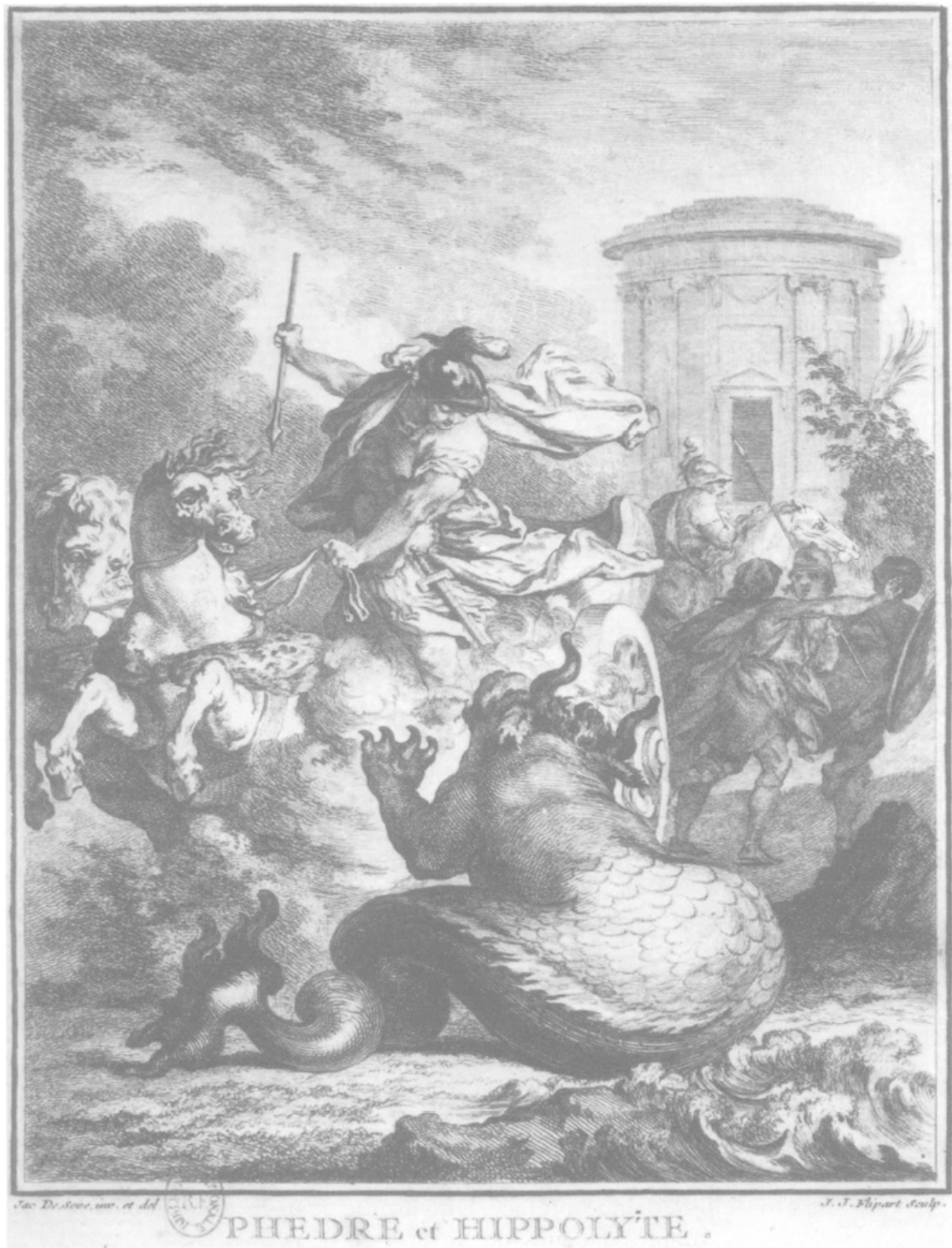
Phèdre , vignette, gravure de Jean-Jacques Flipart d'après Jacques de Sève. Vol. II, p. 368.