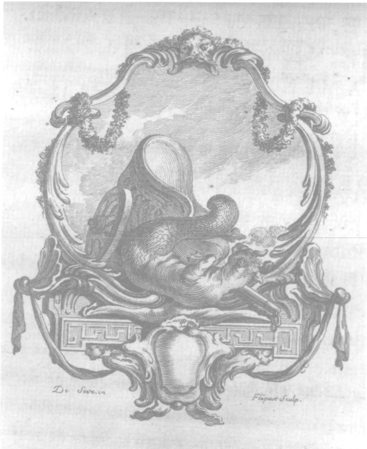
Phèdre , cul-de-lampe préface, gravure de Jean-Jacques Flipart d'après Jacques de Sève. Vol. II, p. 367.