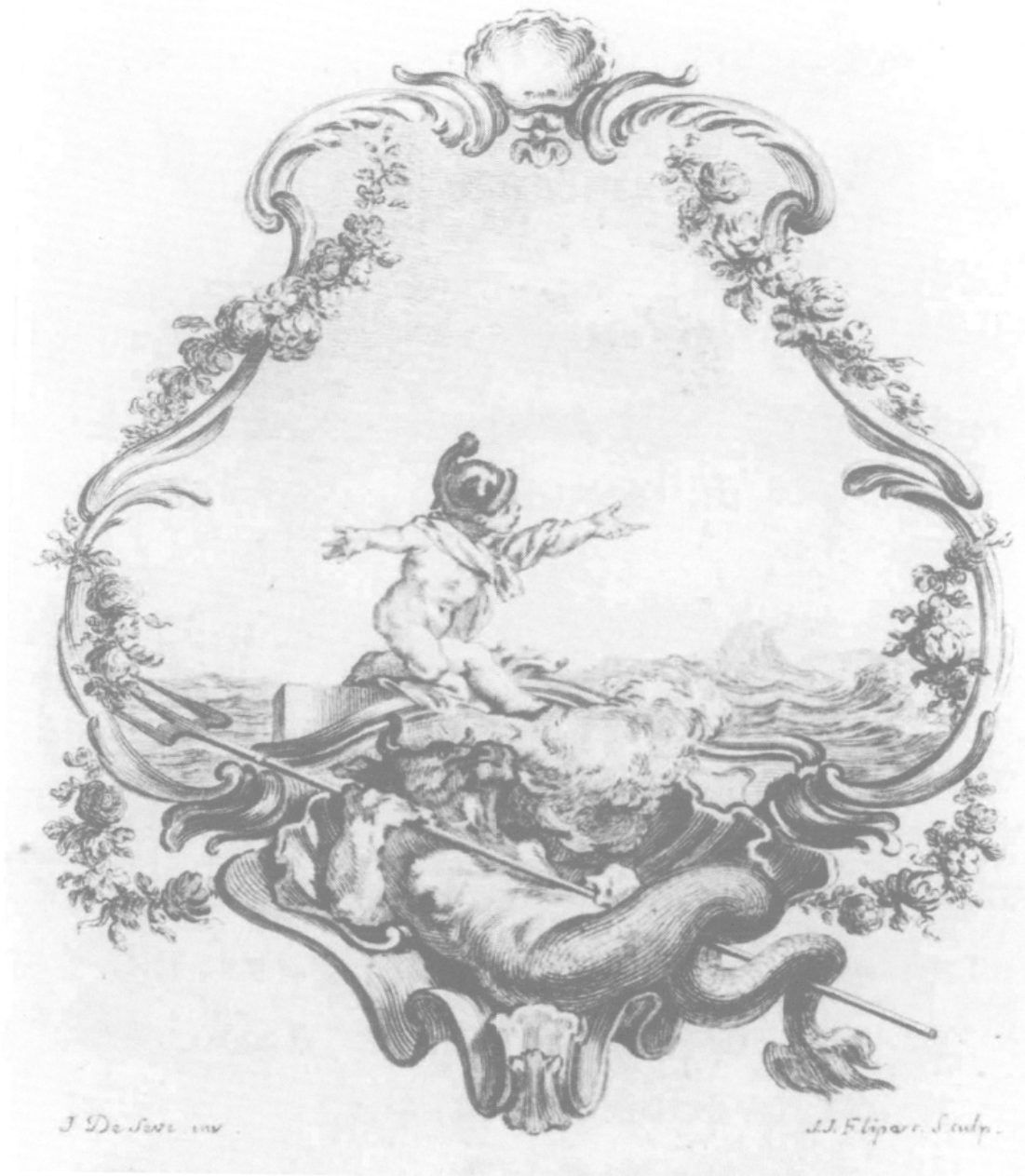
Phèdre , cul-de-lampe acte III, gravure de Jean-Jacques Flipart d'après Jacques de Sève. Vol. II, p. 417.