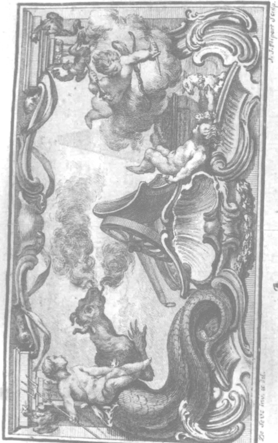
Phèdre , bandeau, gravure de Jean-Jacques Flipart d'après Jacques de Sève. Vol. II, p. 369.