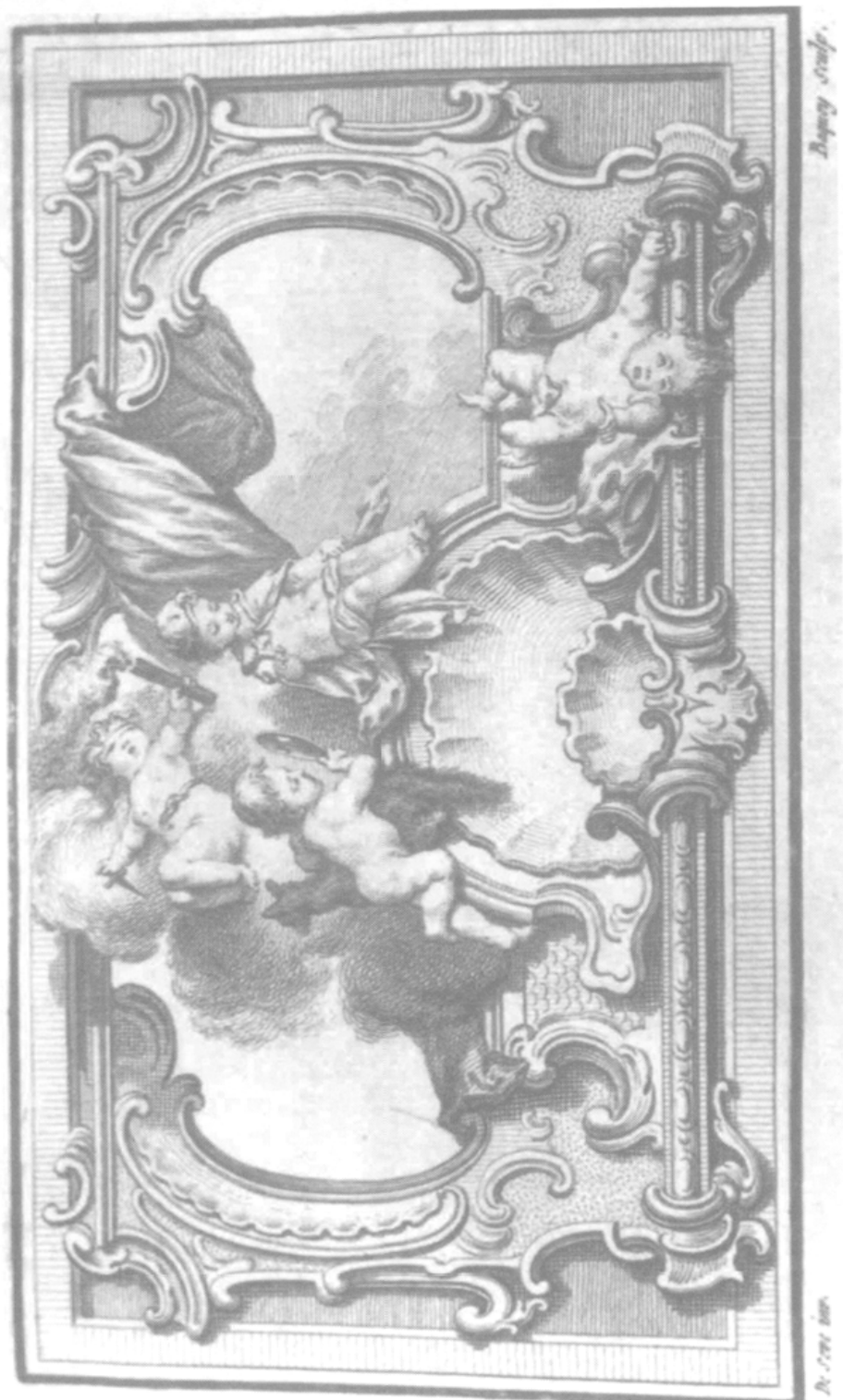
Britannicus , bandeau, gravure de Charles Baquoy d'après Jacques de Sève. Vol. I, p. 329.