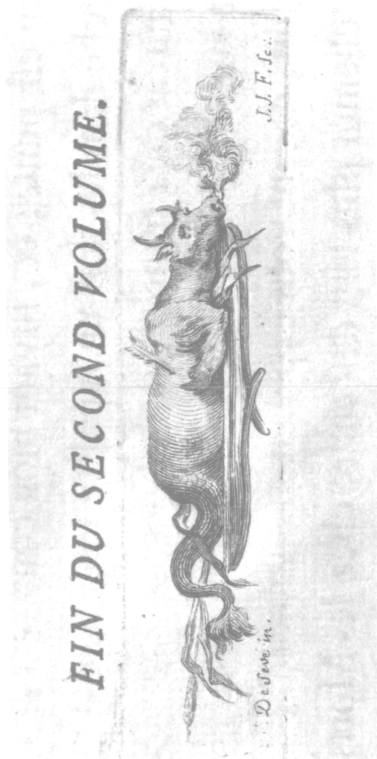
Phèdre , cul-de-lampe acte V, gravure de Jean-Jacques Flipart d'après Jacques de Sève. Vol. II, p. 447.