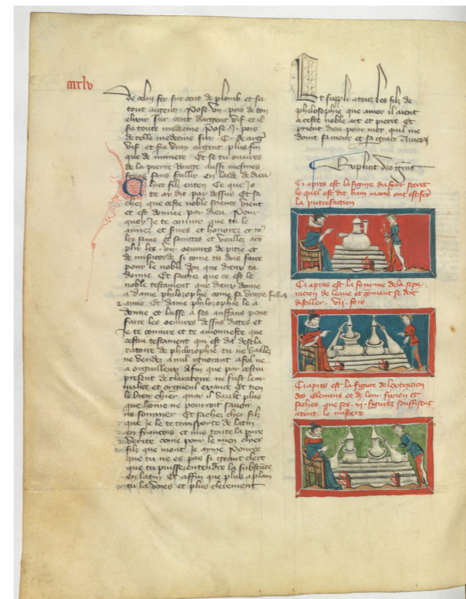
Représentation d'un four à bain-marie, scène de distillation extraction des éléments. Manuscrit Paris, Bib. Arsenal 2872, folio 457 © BnF.

Les savants médiévaux retiennent donc deux échelles : la première est globale parce qu'elle concerne, à travers les quatre éléments et leur combinatoire, la création dans son ensemble ; la seconde est locale, la division entre le monde et l'homme se complétant par la définition des caractéristiques élémentaires des individus, mais aussi des organes du corps humain ou des matériaux, les métaux en particulier, ou des aliments. Ce dernier aspect sera développé dans les régimes de santé que l'on commence à écrire en langue vernaculaire à partir du treizième siècle, et dont le Livre de Physique (parfois intitulé Régime du Corps ) d'Aldebrandin de Sienna, médecin italien, est un bon exemple.