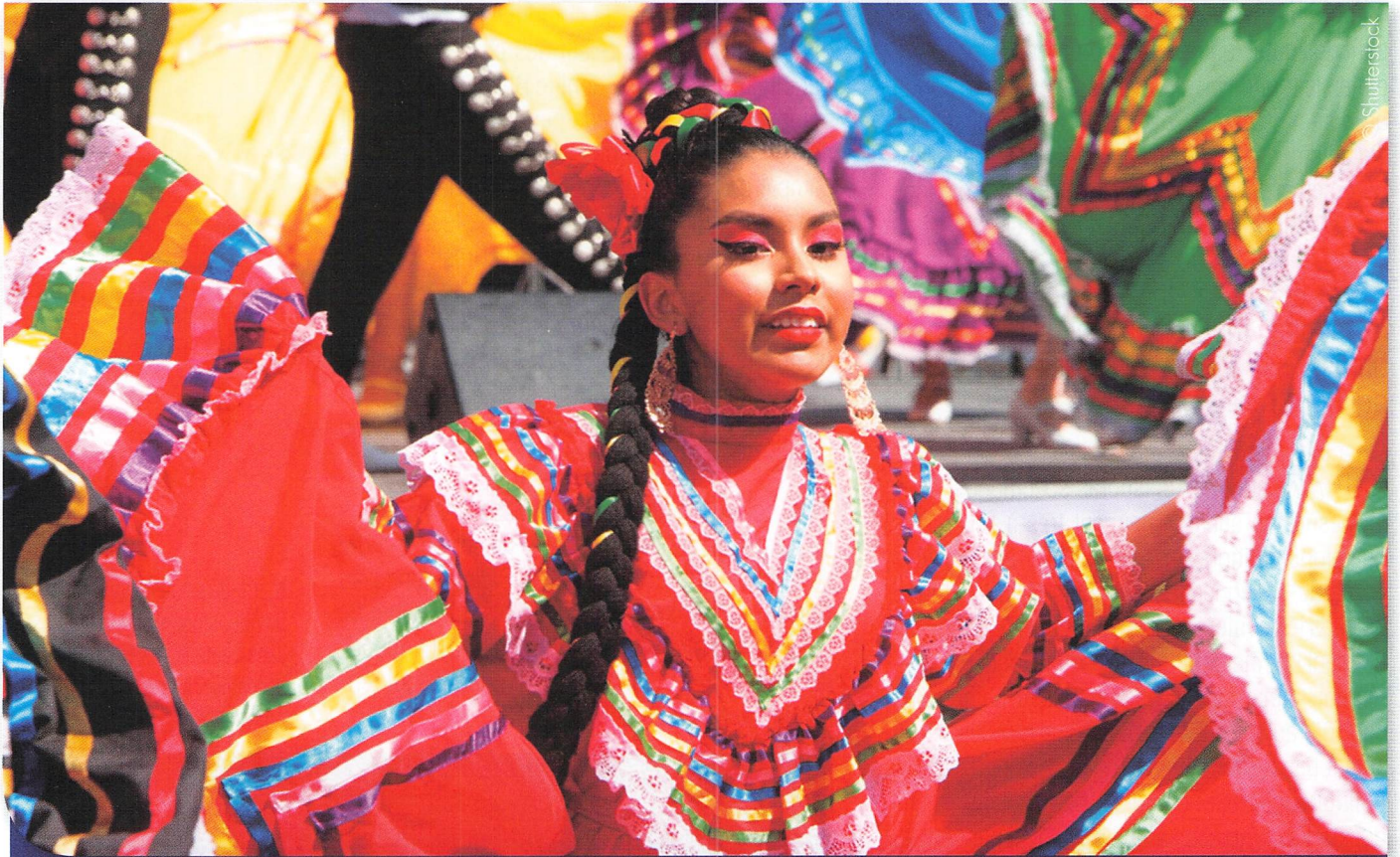
Festival du Cinco de Mayo à San Francisco en 2019. En Californie, la réussite scolaire et professionnelle des enfants hispaniques traduit le souhait d'américanisation de populations même si elles restent attachées à des composantes de leur héritage culturel.

La loi du nombre exprime qu'un pays doit avoir une géopolitique adaptée à son nombre habitants, quel que soit son niveau de peuplement. Certains pays ont très bien compris cela, comme Monaco qui s'est prévenu contre le risque d'un nouveau blocus français, comme celui de 1962, en acquérant une reconnaissance internationale de sa souveraineté en devenant membre des Nations Unies en 1993 et du Conseil de l'Europe en 2004. De même, la création en 1971 des Émirats arabes Unis a contribué à empêcher l'Arabie saoudite ou l'Iran de jouer la division entre les sept émirats pour s'y imposer.