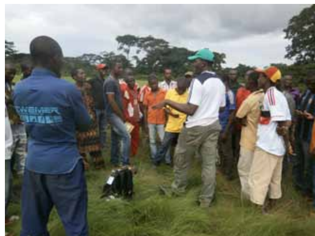
Figure 4a et 4b. Formation des cartographes locaux à la prise des coordonnées géographiques au GPS et à la réalisation des cartes dans le district de Nyabihu (Rwanda) et à Mang (Cameroun)

sont reportées sur la carte au fur et à mesure. Chaque participant est appelé à donner son avis sur le rendu final de la carte. La légende préparée doit être unanimement validée par les groupes de discussion (Rambaldi, 2005; Di Gessa, 2008). Afin d'éviter des conflits d'intérêts et les frustrations, des sous-groupes genre et peuples marginalisés sont organisés à part (Corbett and Rambaldi, 2009; Denniston, 1994). Les informations générées lors de l'élaboration de la carte participative sont au moins aussi importantes que cette carte elle-même. C'est l'occasion de collecter les informations sur les modes d'utilisation des différents écosystèmes et leur contribution à la sécurité alimentaire ou à la lutte contre la pauvreté. C'est également le lieu de discussion au sujet des droits d'accès, de la gouvernance, du fonctionnement des différentes institutions qui gouvernent la gestion