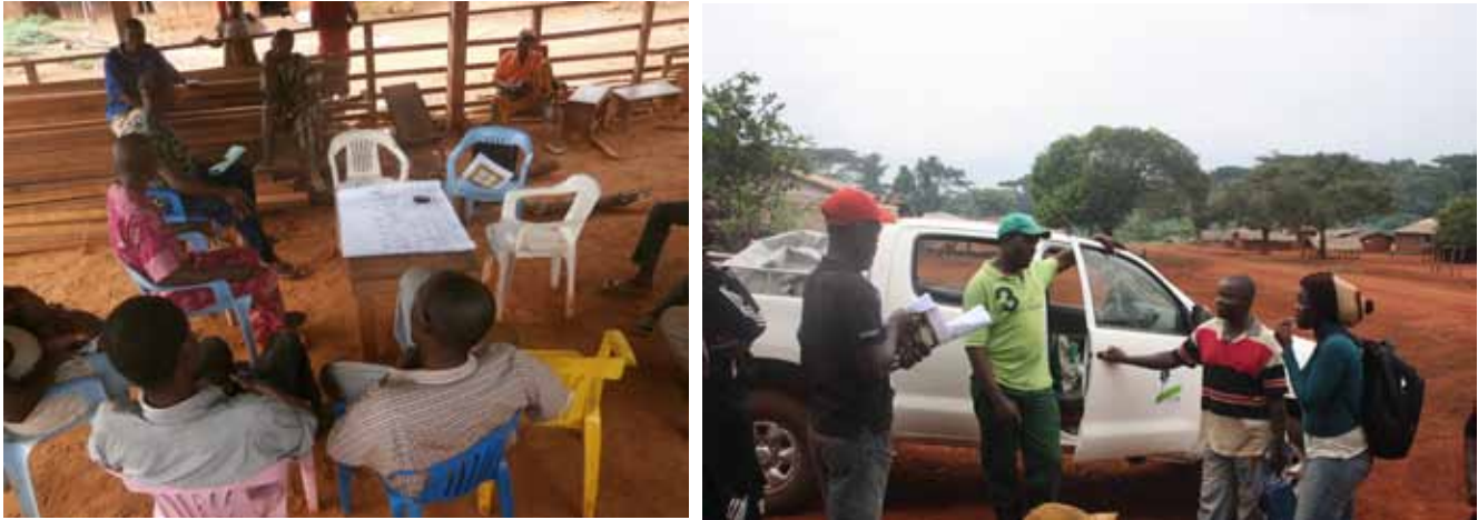
Figure 2a et 2b. Présentation du projet et de l'intérêt de la CPGR à Bompélo et à Mang