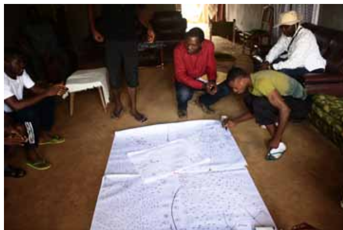
Figure 3a et 3b. Réalisation de la carte participative à Bongonda en RDC et à Ekekam II au Cameroun