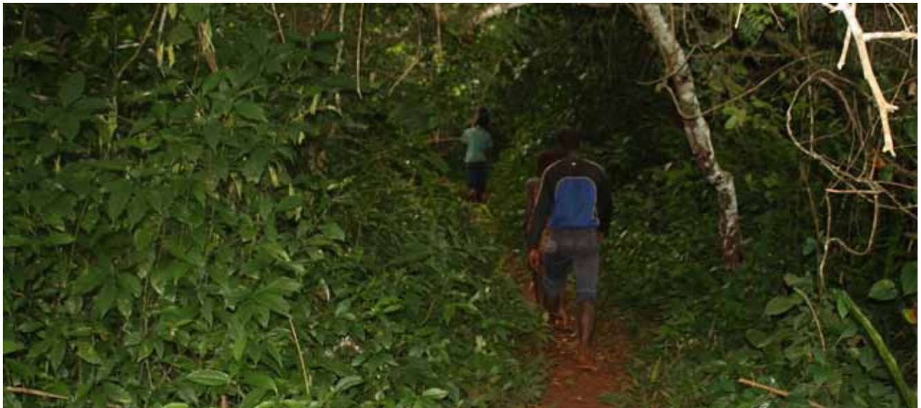
Figure 5. Descente en forêt pour enregistrement des pistes et identification des types d'utilisation des terres