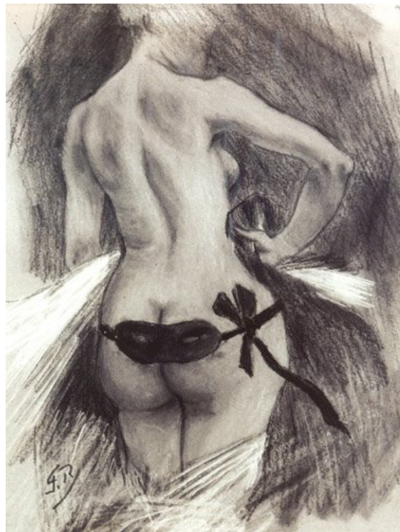
Félicien Rops, Hypocrisie , s.d. Eau forte sur vélin, 16,6 x 12, 7 cm, collection privée

De même la charge érotique des scènes finales ne nous surprend guère. Les bourgeois bien pensants – que l'artiste de Demolder a l'habitude de « scandalis [er] » 59 – parleraient sans doute d'« ordure naturaliste », même si, par bien des aspects, l'écrivain ne fait guère qu'aseptiser certaines images de son beau-père, le peintre et graveur Félicien Rops. On se souvient en effet de l'histoire : le sculpteur dédaigne Victorine, une jeune couturière qu'il sait être amoureuse de lui et à qui il ne reconnaît aucun charme. À l'occasion d'un bal masqué, il rencontre une femme dont il tombe follement amoureux. L'inconnue accepte de se donner à lui à une seule condition : il ne devra jamais chercher à connaître l'identité de la belle ; celle-ci, jusque dans les étreintes les plus folles, continuera à porter son loup et ses gants de soie noire. La belle inconnue est évidemment la petite couturière, mais le séducteur ne le découvrira que trop tard. Tel est le genre de situation que banaliseront par la suite tant de romans érotiques et que Demolder a pu rencontrer dans telle ou telle œuvre de Rops, qu'il s'agisse de la femme aux yeux bandés de Pornokrates , ou celle plus provocante sans doute, d' Hypocrisie (voir reproduction ci-après).