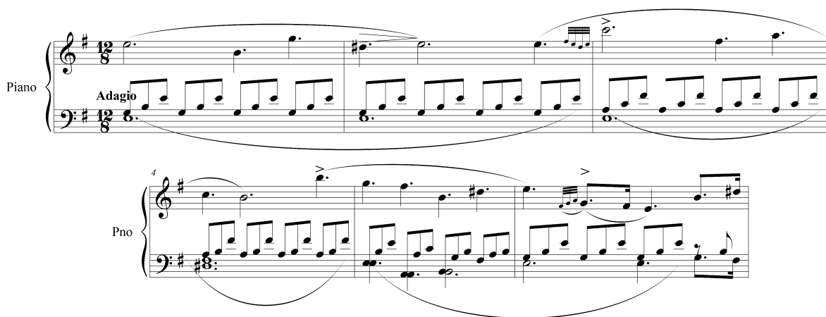
John Field, Nocturne n°10 en Mi mineur, incipit.

Le « Prélude », qui ne se composait que de quelques mesures dans la version de 1913, change dès lors totalement de nature. Confié au seul piano – et annonçant par contraste le passage a capella –, il augure désormais, dans la version de 1931, de cet isolement qu'Alissa prend pour une fusion avec Dieu. Car si cette pièce « prélude » au destin de l'héroïne, elle se présente plutôt comme un nocturne. Au XVIII e siècle on le sait, les pièces portant ce titre étaient des compositions orchestrales, destinées à faire ressentir les délices d'une fête et à permettre à chacun d'éprouver les dimensions de l'espace noyé dans les ténèbres 16 . Avec les compositeurs romantiques, le nocturne change totalement d'allure. Il devient une pièce intimiste et le plus souvent mélancolique, exécuté par un interprète seul et chargé de faire ressentir à son auditoire toute la mélancolie de la nuit. Son principe de base consiste très souvent à faire entendre des triolets de croches à la main gauche, tandis qu'à la main droite se déploie une mélodie langoureuse, un chant très simple, que vient parfois troubler un rythme inattendu de marche. C'est ainsi que se présente le 10 e Nocturne de John Field :